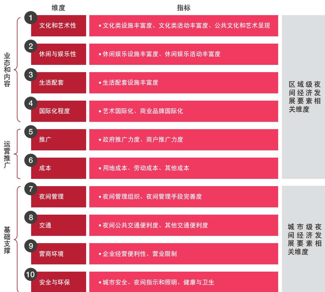
图二 夜间经济发展要素

普华永道思略特基于“机遇之城”的综合评估框架，建立了夜间经济评估模型，包括涵盖了业态和内容、运营推广和基础支撑三个层面的十个维度。在进行区域和城市评估时，普华永道思略特结合内部数据库与大数据精准抓取，衡量人流情况、业态密度、推广效果等，分析得出了夜间经济的提升方案。