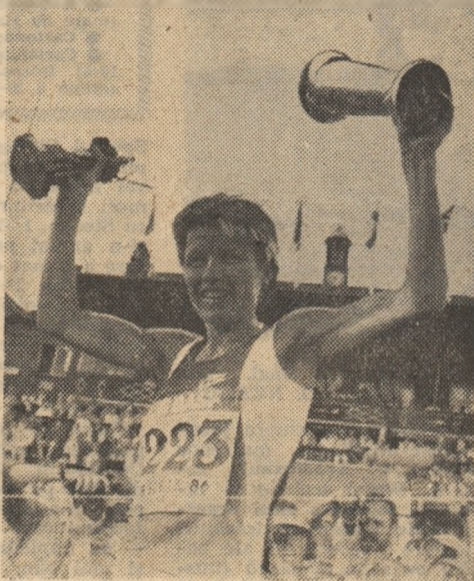
Norvegianca Ingrid Kristiansen, recordmană mondială la 10 000 m, savurându-și succesul...

● Între rezultatele săptămânii trecute, cu totul meritoriul ne apare, noul record mondial al norvegienei Ingrid Kristiansen : 30:13,75. Ea și-a îmbunătățit propriul record pe 10 000 m, cu peste 40 de secunde. În clipa de față o mai despart doar 13,75 s de granița celor 30 de minute! Va fi ea, oare, prima alergătoare care să depășească această barieră? În orice caz, Kristiansen este principala