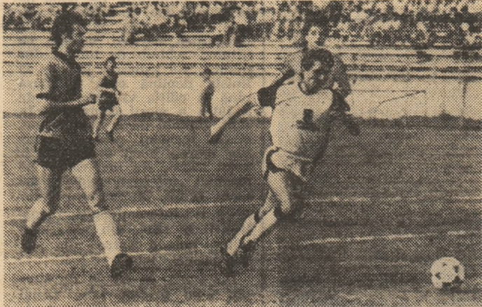
Golgeterul Sportului Studențesc și al campionatului, Hagi, pătrunde în careu

toate divizionarele A : 87 ! Deci, o medie de 2,56 goluri de meci, cind media campionatului, pe ultimii 5 ani, este de 1,25 goluri pe echipă. Ajungem să formulăm, astfel, atuu numărul 1 al Sportului în acest an competițional: eficacitatea sportivă (anul trecut, 71 de goluri), ea armare, a creșterii vitezei de acțiune, a orientării jocului mai mult pe poartă. Sigur, această predilecție a avut și aspecte negative — uneori nu s-a „elaborat“ îndeajuns la mijlocul terenului, s-au dat pase decisive greșite, s-a grăbit finalizarea —, dar apetitul ofensiv rămîne o realizare certă în evoluția echipei. Pozitivă este și participarea la finalizare a majorității jucătorilor : 12 marcatori din 22 jucători folosiți.