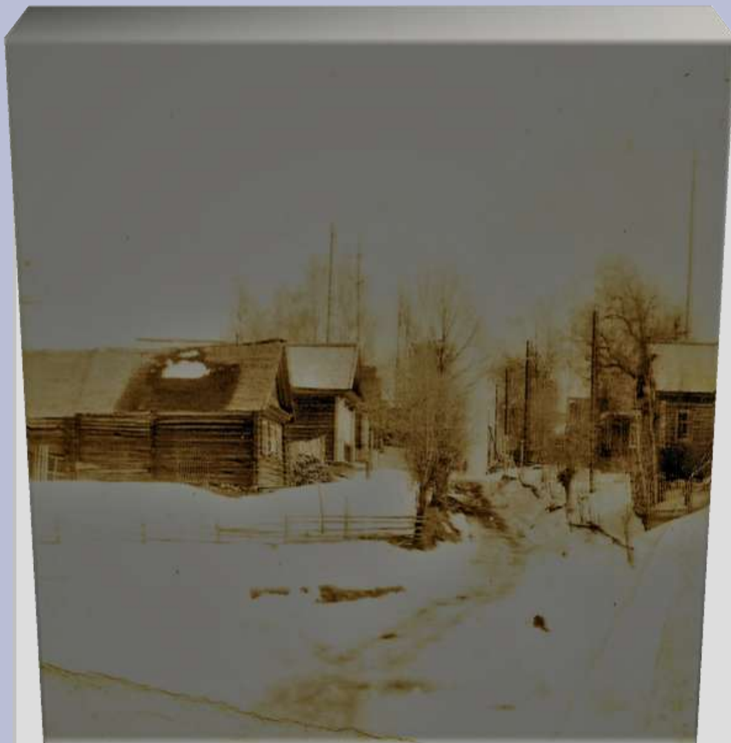
Язвиха, 1961 год.

В ольховой отсыревшей стороне, Куда ещё так трудно добираться, Герань тихонько рдеет на окне, Петух-склеротик налетает драться. И деревенька, словно пароход, Плывёт себе в далёкие туманы. Здесь детство бродит, Юность тут живёт - И потому всё кажется желанным..