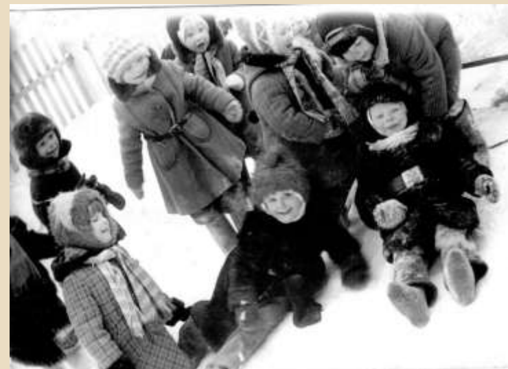
В 1980-е годы в Язвике было много детей.

К концу 1980-х гг. в Язвике было 42 двора. Имелись новый Дом культуры, восьмилетняя школа (открыта в 1988 году), столовая, детский сад, почта, 4 магазина, мастерские.