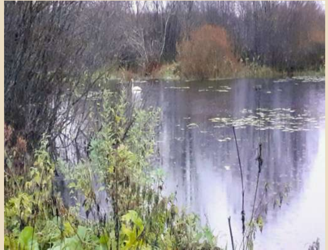
На пруду появляется белый лебедь.