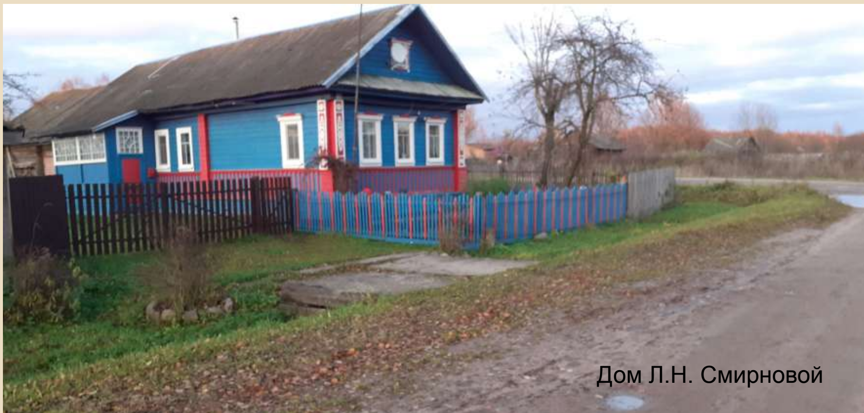
Дом Л.Н. Смирновой

Скота держат мало, на всю деревню - 4 коровы, полсотни овец и кур, 2 лошади.