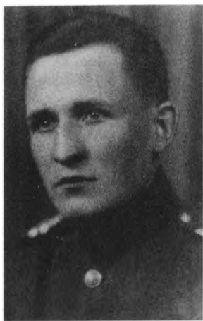
Bronius Butėnas. 1939 m.