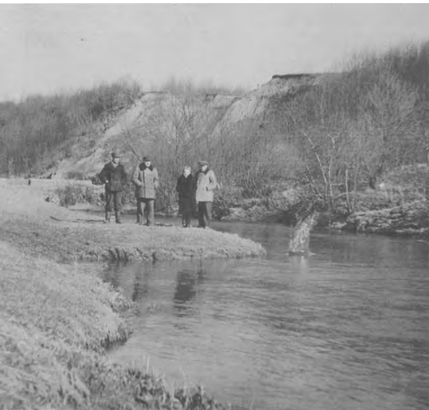
Prie Akmenos upės Penkininkų malūno užtvankos (Kretingos r., Bajorų k.), į kurią būdavo sumetami nužudytų partizanų kūnai. 1947 m.