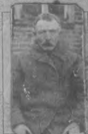
Paso savininko(ės) parašas