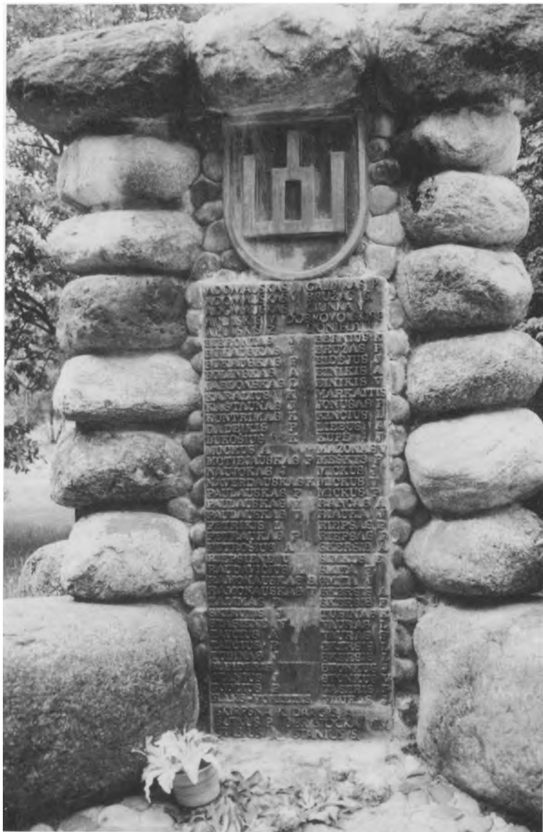
Paminklas Žemaičių legiono partizanams Mosėdyje. 1999 m.