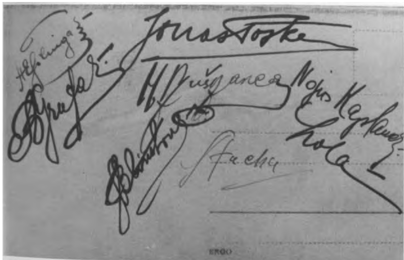
Jonas Semaška (trečioje eilėje) su jaunystės draugais - Ukmergės gimnazistais. Kitoje nuotraukos pusėje jų parašai