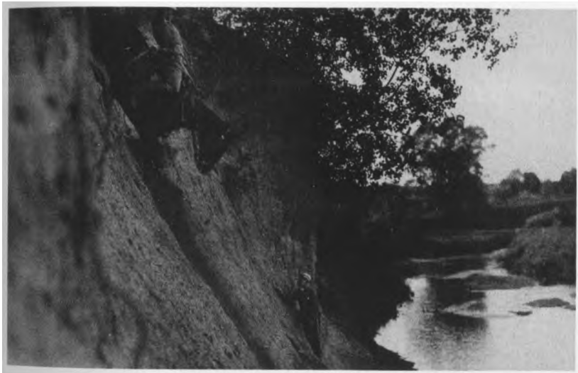
Sunku pratybose. O kaip kare?.