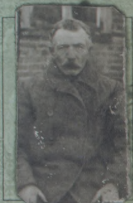
Paso savininko(ės) parašas