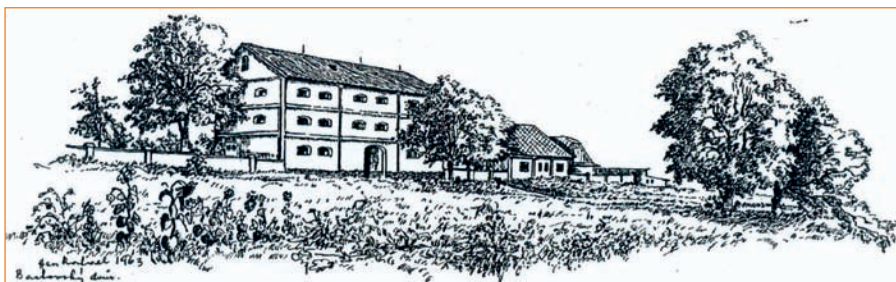
Perokresba Rafaela Hesse: Pohled na dvůr z jihozápadní strany – sýpka stavení čp. 1 (r. 1963)