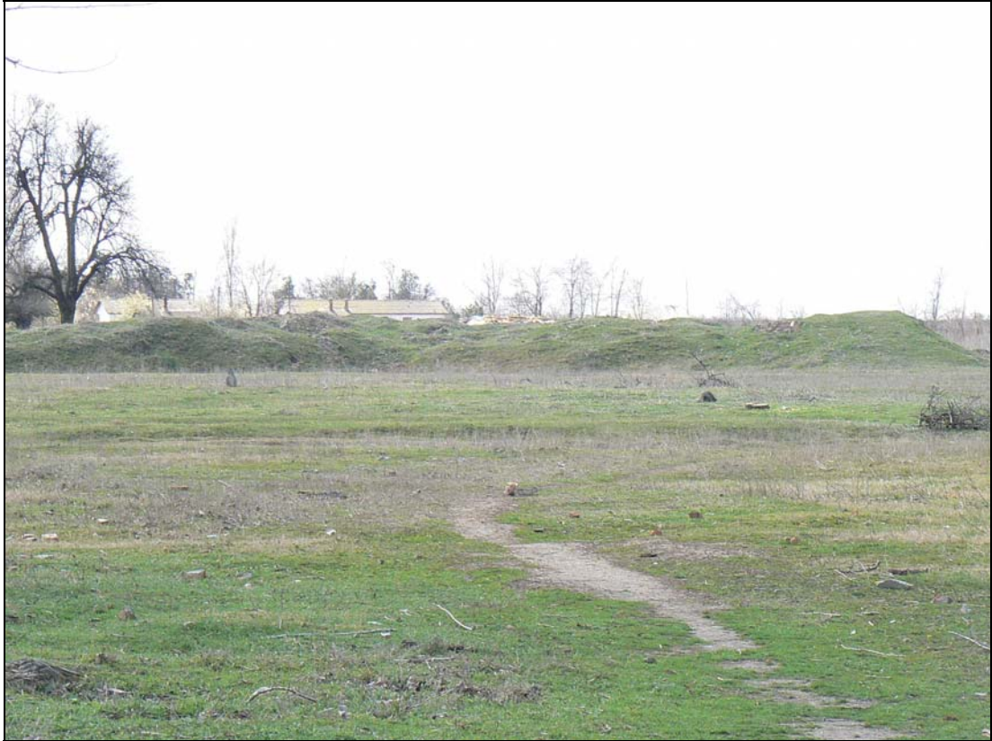
Locul în care se aflau barăcile deținuților.