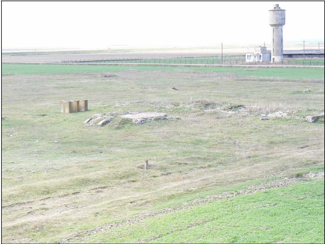
Locul în care se afla Spitalul Salcia.