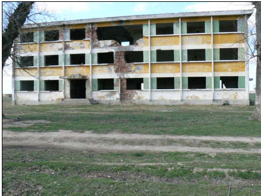
Blocul unde erau cazați militarii care asigurau paza Salciei.