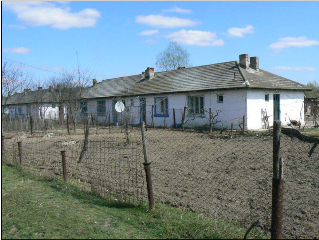
Locuințe ale ofițerilor de la Salcia. Aceste locuințe aveau canalizare și instalație de încălzire proprie.