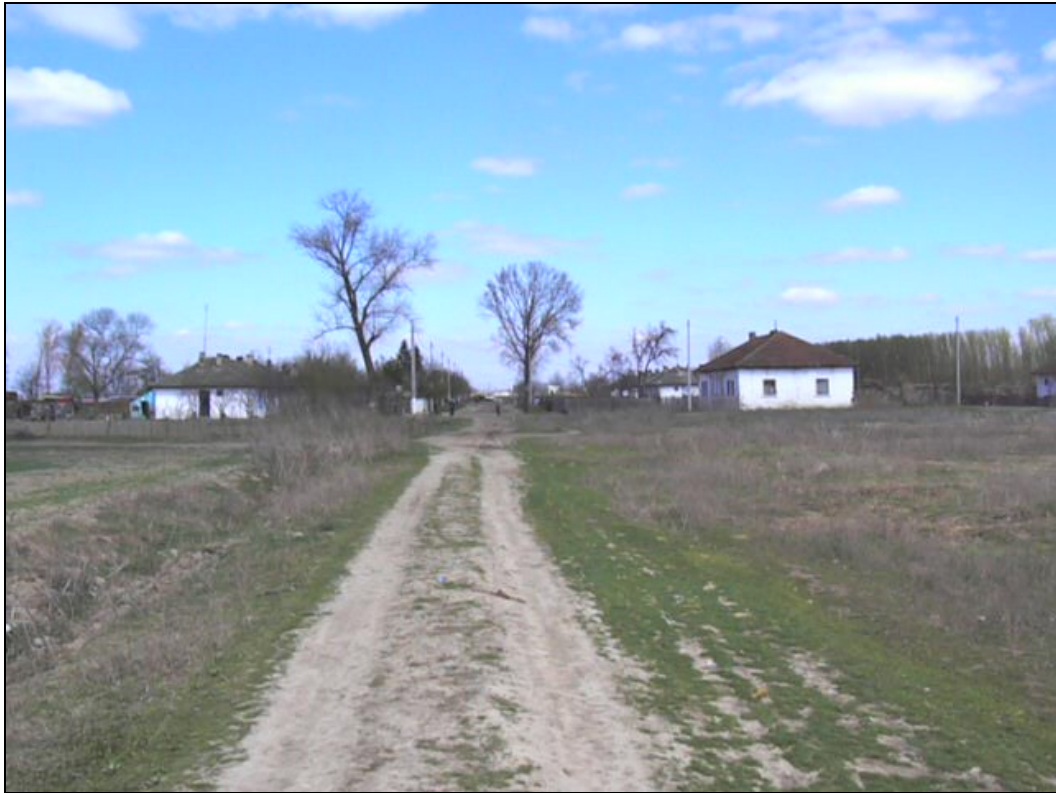
Vedere de ansamblu – Salcia.