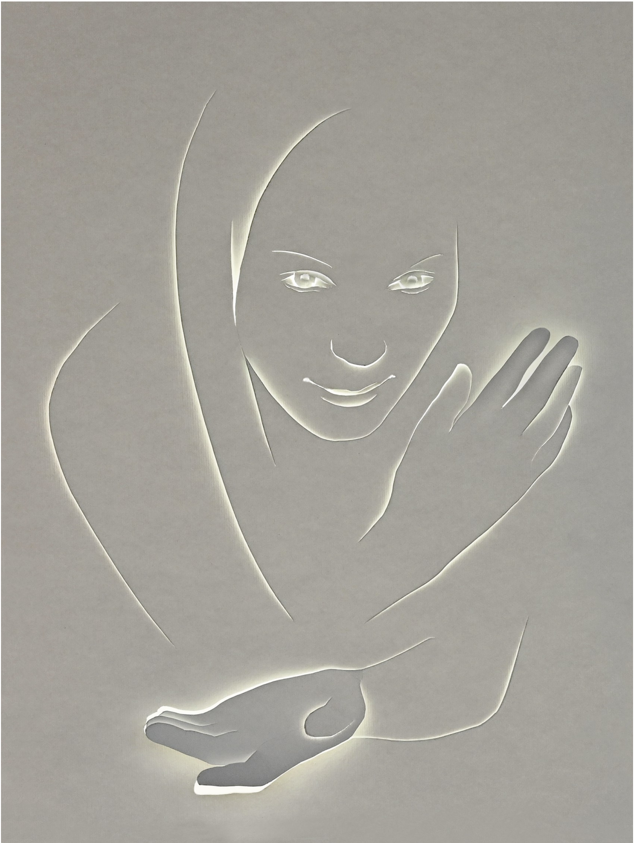
Večerná verzia obrazu (s podsvietením)