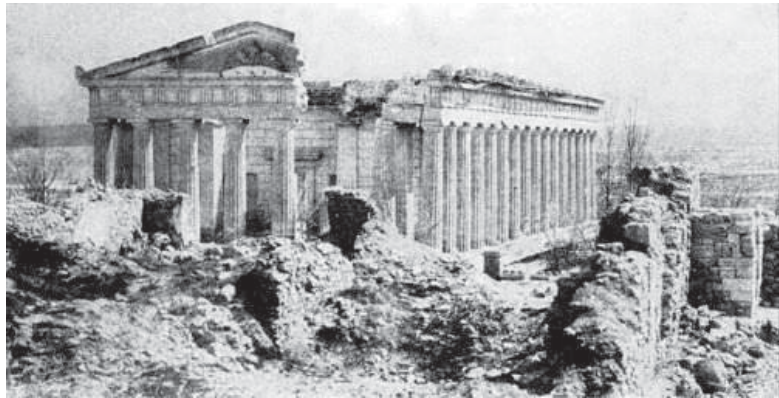
Петропавловский храм после Крымской войны

войны в донесении Алексия, епископа Таврического и Симферопольского, в Правительствующий Синод отмечалось, что по сведениям благочинного церкви Севастопольского округа протоиерея Арсения Лебединцева от церкви уцелели лишь стены, в фундаменте были трещины, «крыши, потолка, полов, дверей ничего нет, все это, как видно из оставшихся деревянных огарков, сгорело». Стены внутри были