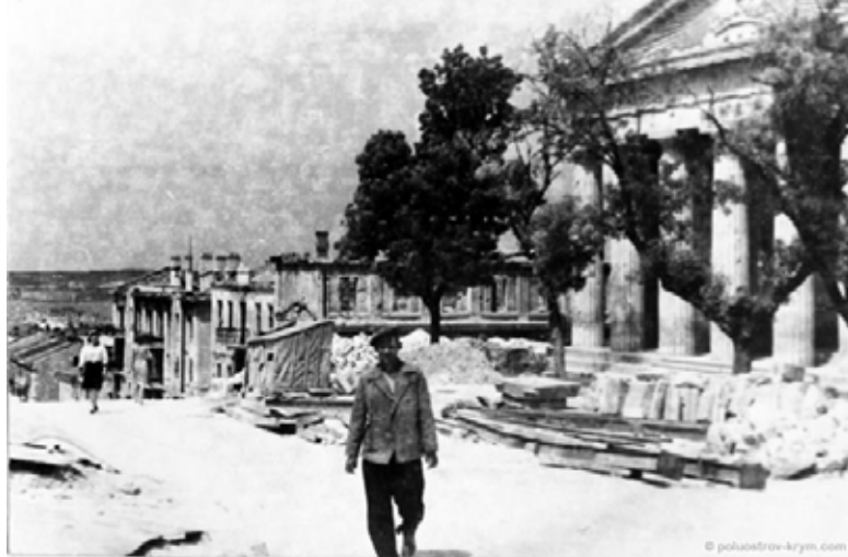
Петропавловская церковь после Великой Отечественной войны