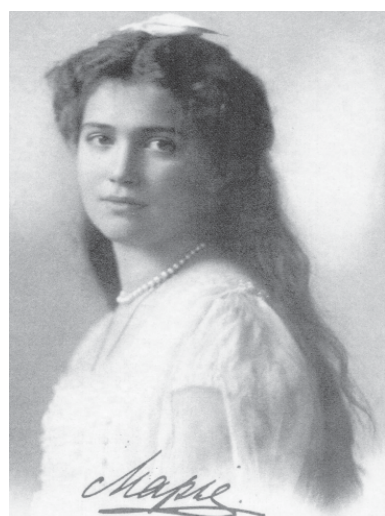
Великая княжна Мария Николаевна, «крестная мать» «Коммуны»

За последнее время на ремонт судна были выделены не-