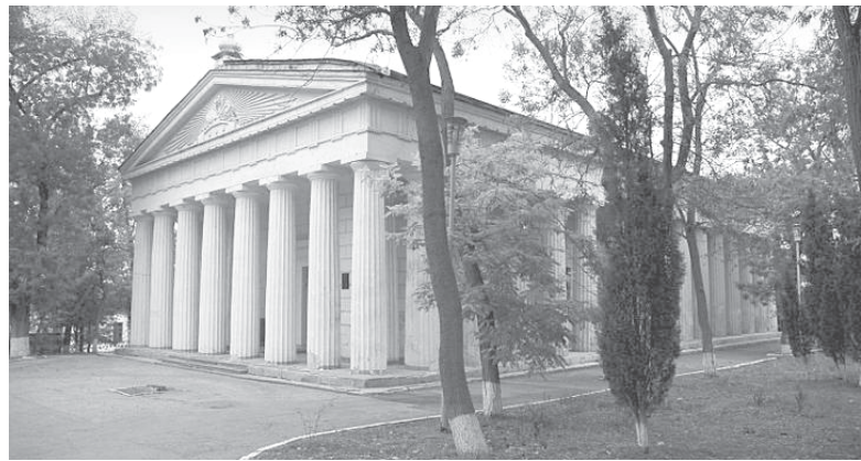
Петропавловская церковь в наши дни

12 июля — праздник славных и всехвалых первоверховных апостолов Петра и Павла