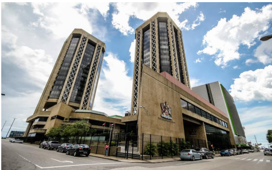
特多中央银行办公楼