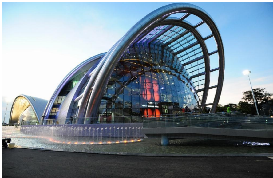
西班牙港国家演艺中心

西班牙港位于特立尼达岛西北海岸，西临帕里亚湾，是全国政治、经济、文化中心和主要港口，人口约54.4万。市内有多个历史性建筑、广场、公园及热带植物园。市区东部的皮亚尔科机场是加勒比海地区的主要机场，北部的马拉加斯湾沙滩细洁，是中美洲著名海水浴场。