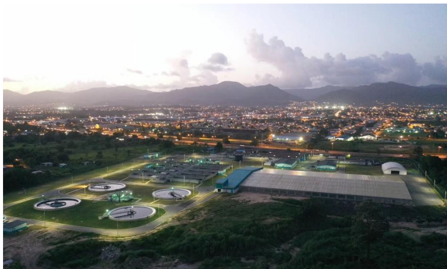
马拉巴尔污水处理厂-中国电建承建