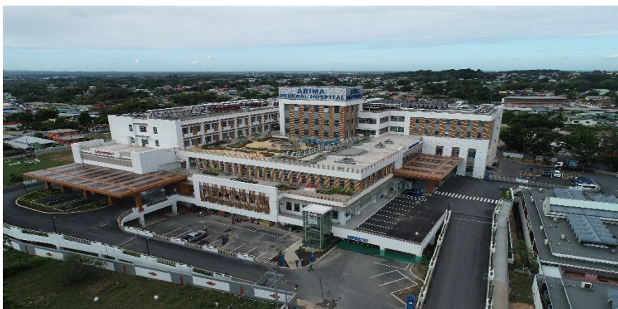
阿利玛医院-中铁建承建

【承包劳务】据中国商务部统计，2020年，中国企业在特立尼达和多巴哥新签承包工程合同7份，新签合同额1.67亿美元，完成营业额1.14亿美元。累计派出各类劳务人员192人，年末在特立尼达和多巴哥劳务人员310人。近3年完成的主要项目包括阿利玛医院、圣詹姆斯医疗中心直线加速器、特立尼达和多巴哥电信无线接入项目、特立尼达和多巴哥电信移动高速宽带及4G WTTX网络、库勒珀立交桥、新马拉巴尔污水处理项目、东方格调商业楼项目等。