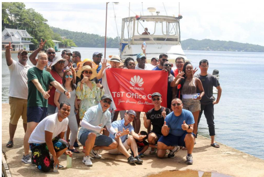
华为公司与当地员工团建