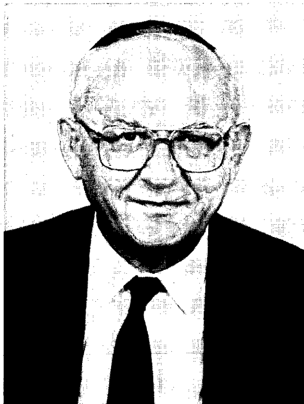
השופט פרופ' מנחם אלון