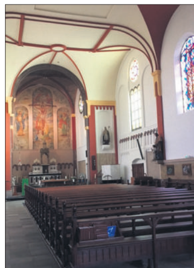
■ Het interieur van de kerk in 2022.

Nu werd de vraag waar de kerk moest komen. De parochie bezat enkele stukjes grond in de huidige