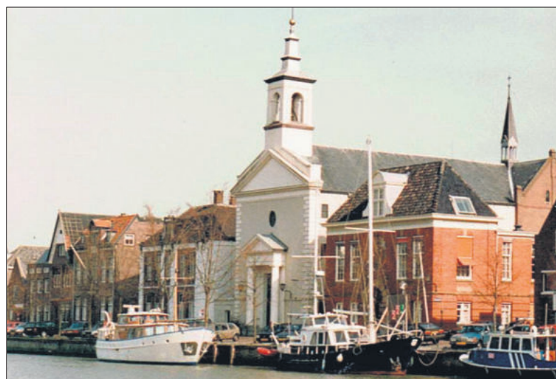
■ De kerk en het gemeentehuis in de jaren negentig.