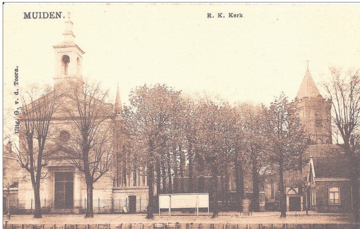
■ De situatie in 1913. Rechts achter de toren van de Grote kerk.