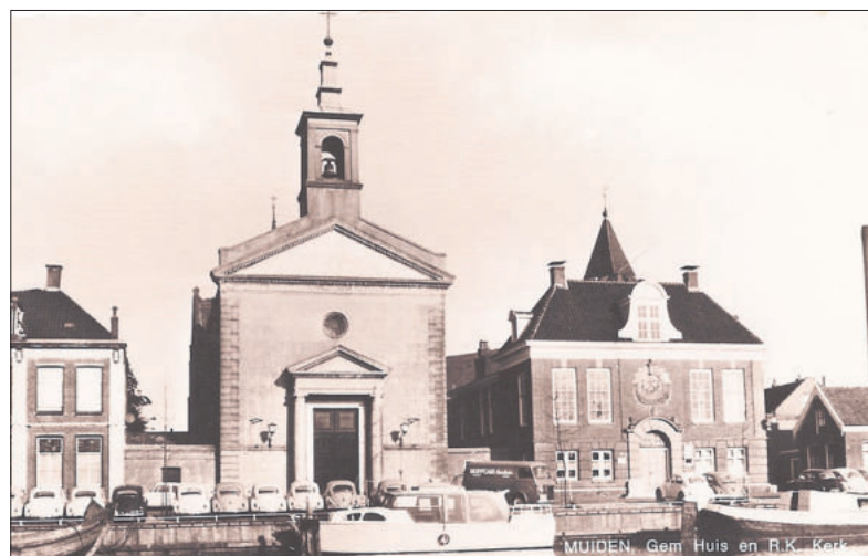
■ De kerk met het gemeentehuis ernaast omstreeks 1958. Ervoor een rij