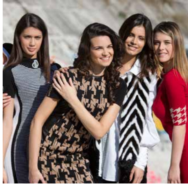
Alcune finaliste Miss 365 2016