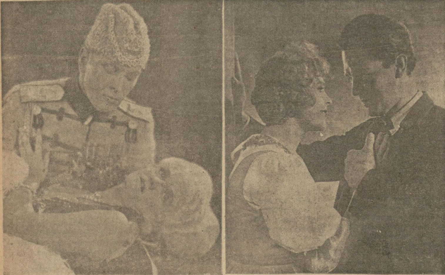
(Holivut'ta bir izdivaç) filminden bir sahne Liyan Hayd ve Gustav Fröhlich (Ebedî serseri) de

Açık olan üç sinemada gösterilen filmlerin üçü de güzel bestelenmiş ve iyi oynanmış Film operetleridir