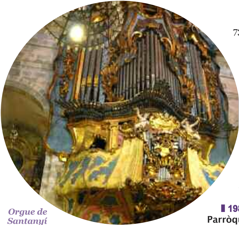
Orgue de Santanyí