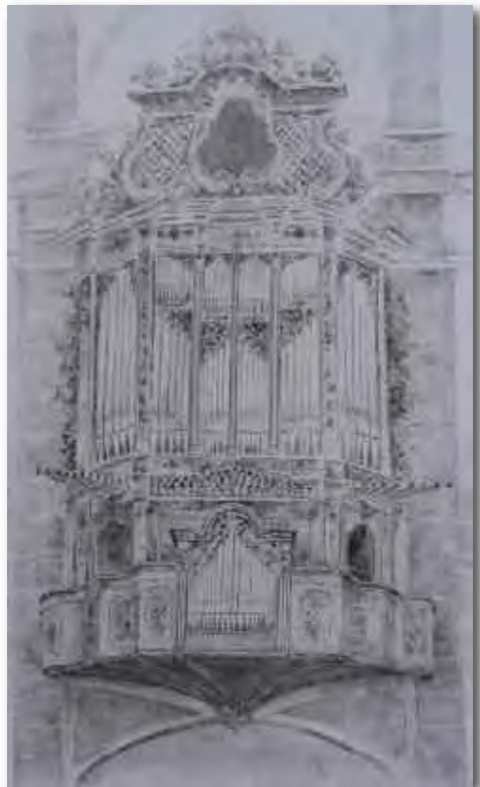
Orgue Bosch-Grenzing de la Parròquia de Sant Bartomeu d'Alaró Dibuix de Llorenç Gual