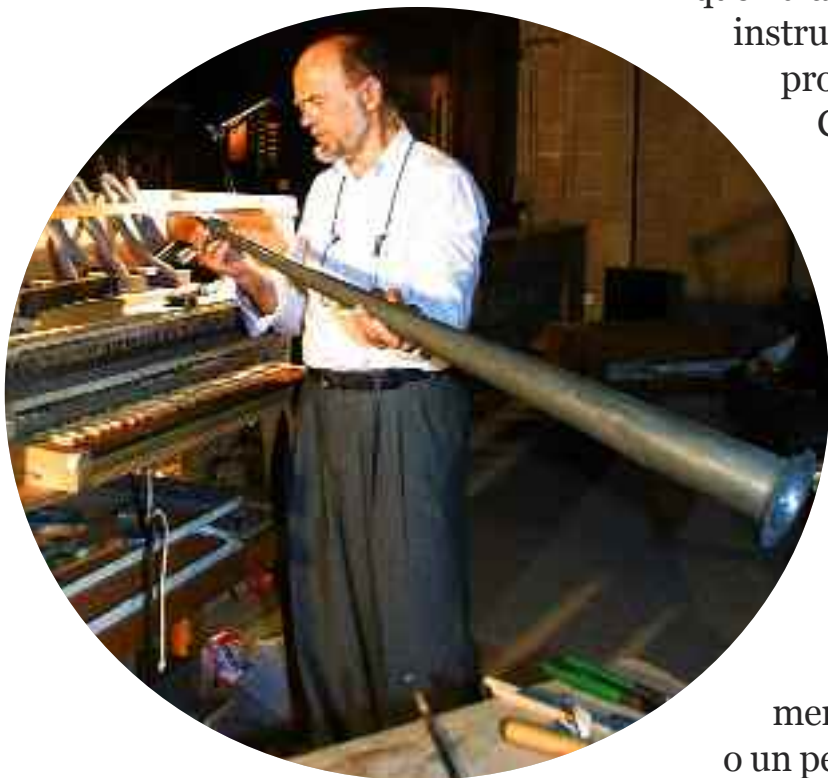
Grenzing treballant a l'església dels Socors de Palma

Aquell dia de fa vuit o nou anys sols sabia d'aquest instrument el que havia après durant el llarg procés de recuperació de l'orgue alaroner. Cadireta, flautat, jocs, tiradors, regalies... havien deixat de ser per a mi paraules misterioses.