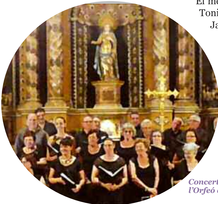
Concert de l'Orfeó d'Alaró