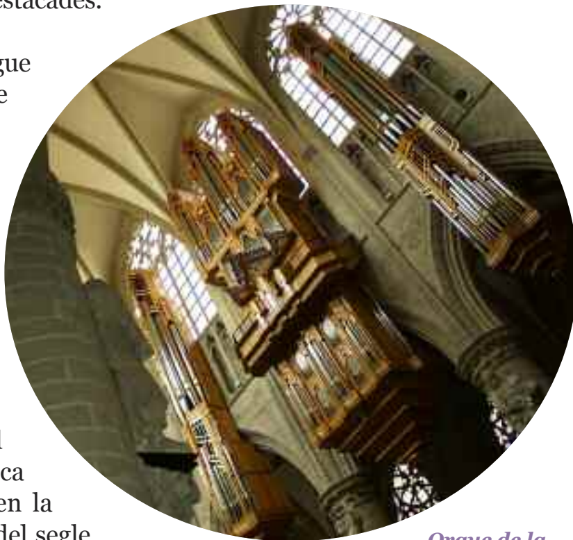
Orgue de la catedral de Brusel·les

La llista d'orgues de nova creació de Grenzing és llarguíssima, com també ho és la de restauracions. D'aquestes recuperacions sols en recordarem unes quantes: la catedral de Sevilla, els de la seu Metropolitana de Mèxic, el Jordi Bosch del Palau Reial de Madrid, el del Palau de la Música de Barcelona... Una obra sonora impressionant per un home que no ha deixat de treballar al llarg de mig segle.