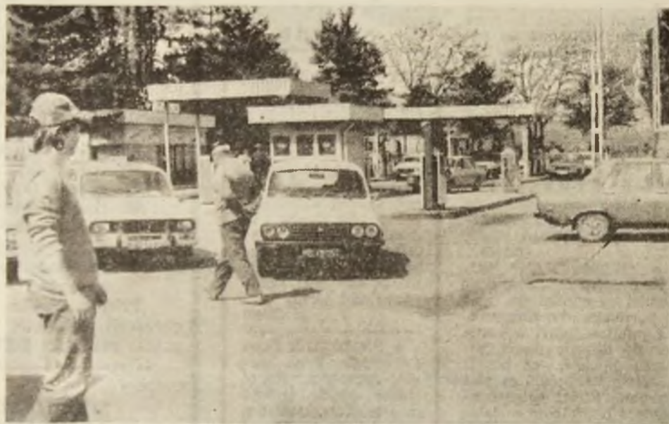
Stația de benzină nr. 3 Deva. Secvență din activitatea de fiecare zi.