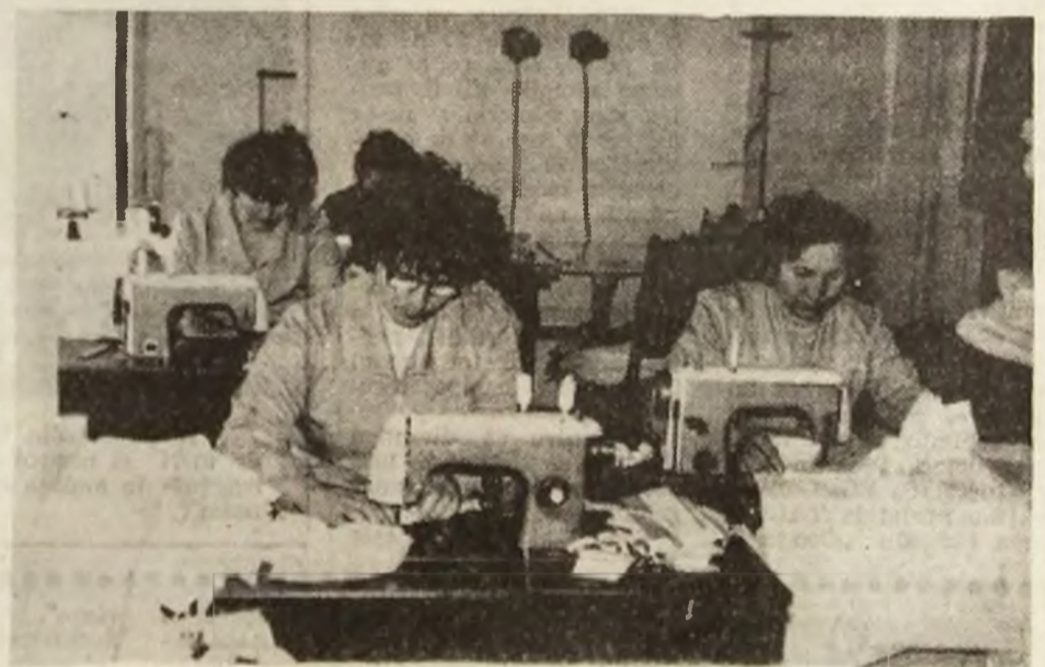
Aspect de la secția de croitorie serie și comandă din Petrița.