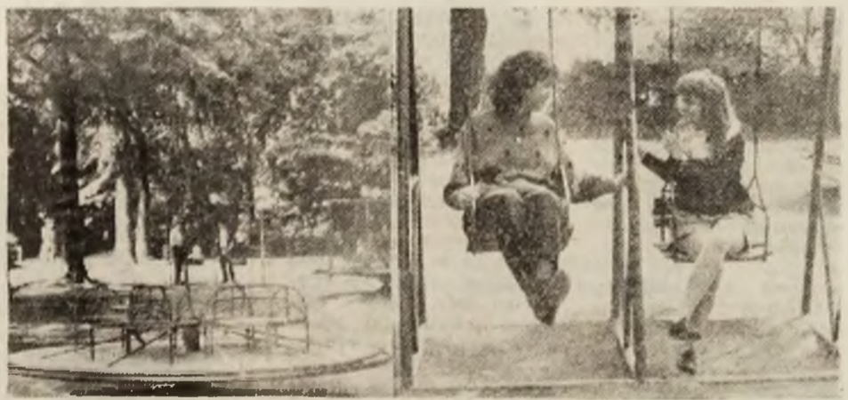
În parcul din Deva, unele aparate de joacă pentru copii au „decedat” de mult și nimeni nu le mai... învie. În schimb, tinerele din imagine „se leagănă” în amiaza mare, crezînd că mai sînt... copile. Pe cine să mai invinim?