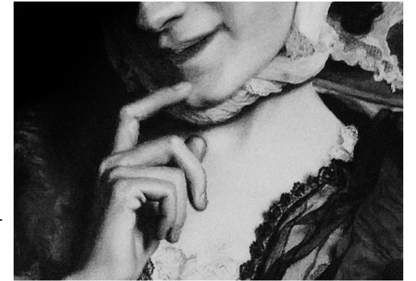
Portrait de Madame d'Epinay par Jean-Étienne Liotard

Flaubert à propos de Madame d'Epinay, dans Notes de voyage , Paris, 1910