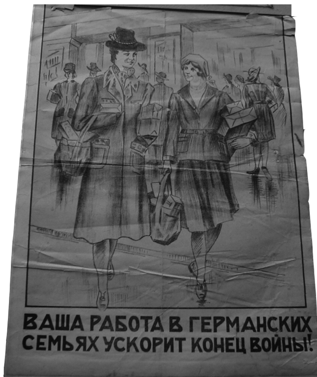
Плакат-призыв 1943 г.

Преследованию подверглись и руководители действовавших при оккупантах музеев. К 5 годам