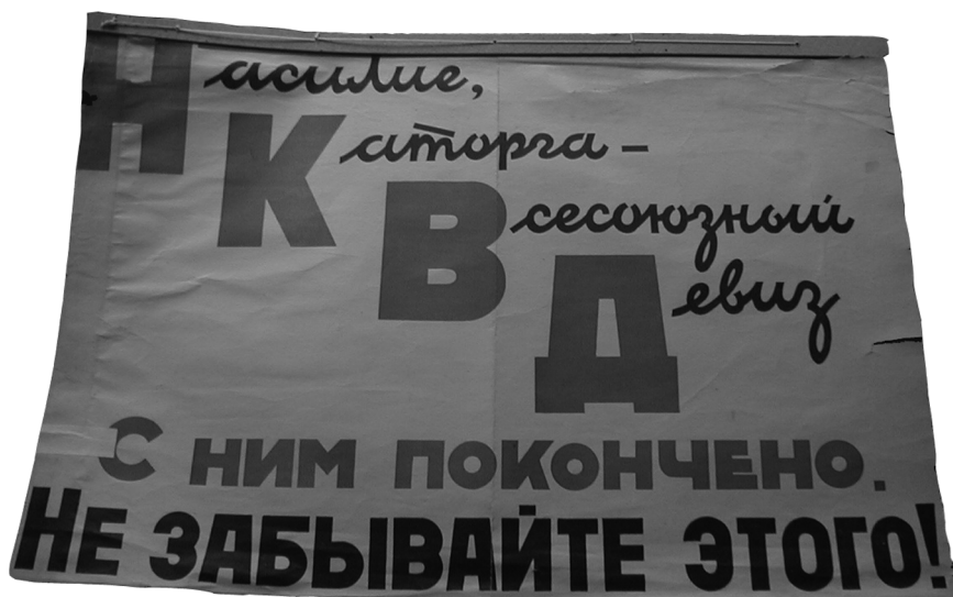
Такие плакаты были характерны для первого периода оккупации. С осени 1943 г. фашистская пропаганда уже больше пугала жителей Крыма, что если немцы убудут, то НКВД отправит в Сибирь всех, кто был в оккупации

Среди арестованных немало тех, кто проходил по категории «фольксдойче». Эти люди оккупантами рассматривались как главная опора на завоеванной территории. Они получали особый статус, находились в лучшем, чем остальные, и правовом, и материальном положении. Те, кто принимал немецкое подданство, оформлялся как «фольксдойче», одновременно принимали на себя определенные обязательства. За пользование льготами они должны были проявлять большую лояльность оккупационному режиму. Желая получить эти льготы, этот статус пытались получить те, у кого в роду была хоть небольшая доля немецкой