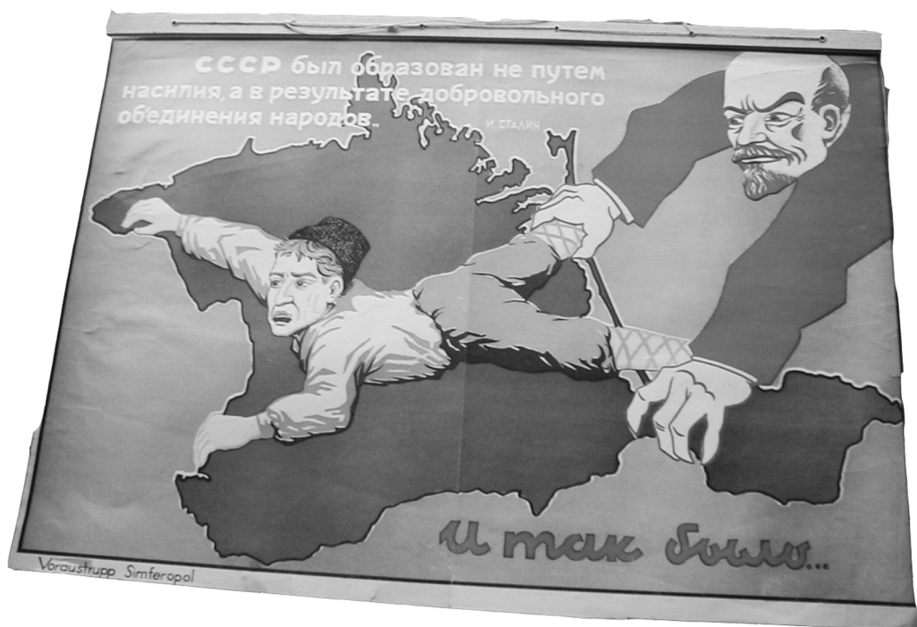
Массовый агитационный плакат. 1943 г.