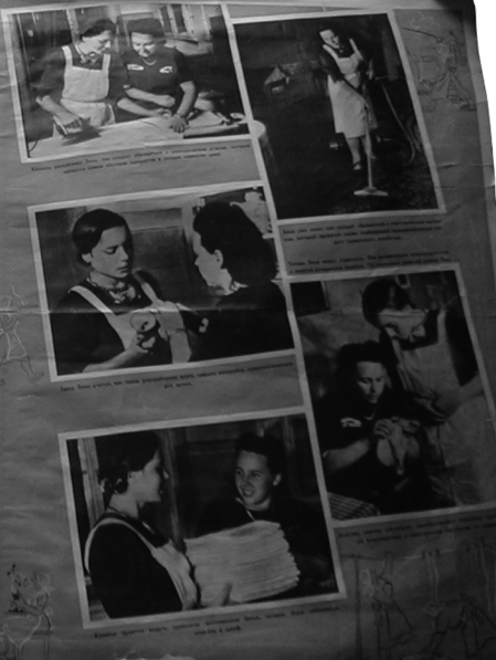
Плакаты демонстрирующие высокий культурный уровень Германии