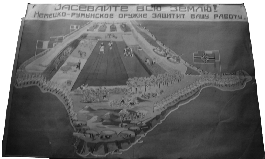
Нетипичный образец агитационного плаката: образ Ленина оккупанты практически не использовали