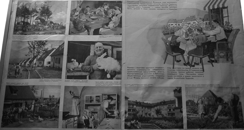
Средней, умиротворенной Филармон, под впечатлением строительства прекраснейшей культуры Германии — культурно-спортивного комплекса Московский рабочий имени Геринга — страна вышла из разрухи войны, достигла в жизни успехов, недостижимых в Германии.