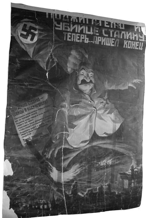
Карикатурный Сталин — персонаж большинства плакатов