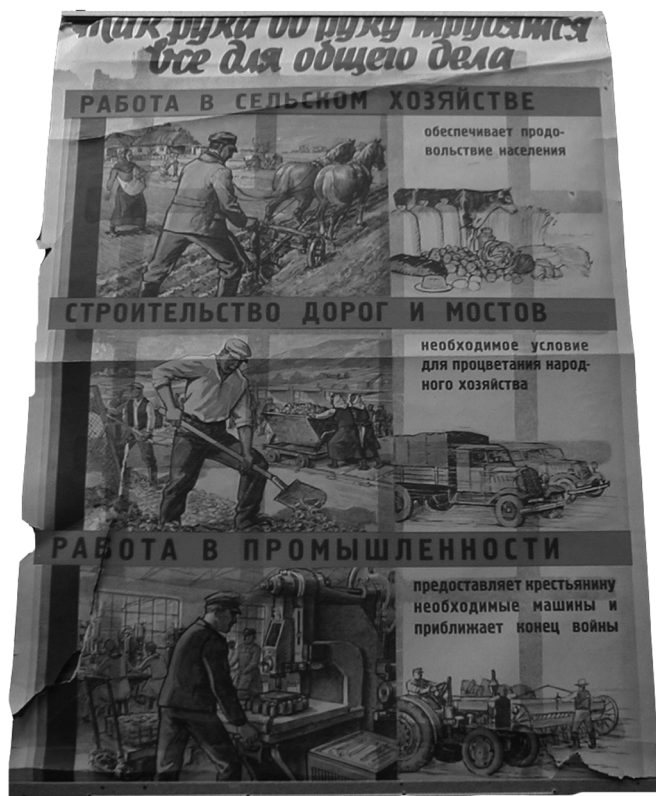
Агитационный плакат с призывом добровольно ехать на работу в Германию

усердие, с которым эти люди выполняли возложенную на них миссию. В ходе следствия решающую роль играли свидетельские показания. Отношение людей к рьяным сторонникам «нового порядка» было однозначно отрицательное. Факты ареста и осуждения коллаборационистов находили одобрение и полную поддержку общественного мнения. Люди на себе ощущали все «прелести» нового порядка, а эти люди воспринимались как его носители. Не последнюю роль играло и то, что эти лица, равно как и члены их семей, находились в большей личной безопасности и в гораздо лучшем материальном положении.