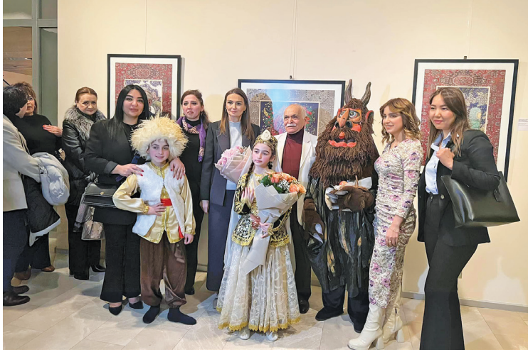
Əvvəli səh. 1-də

Xalq rəssamı yubiley ilində ilk sərgisini təqdim etdi