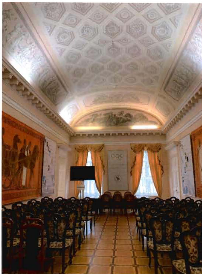
8. Фрагмент интерьера пом. 19-Н (25) Армянская столовая.