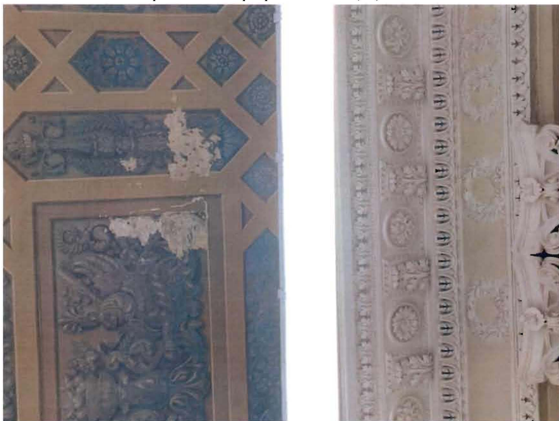
7. Фрагмент интерьера пом. 19-Н (23) Библиотека.