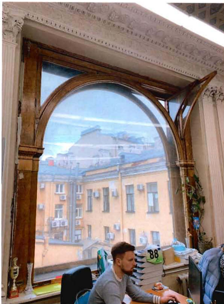
6. Фрагмент интерьера пом. 19-Н (23) Библиотека.