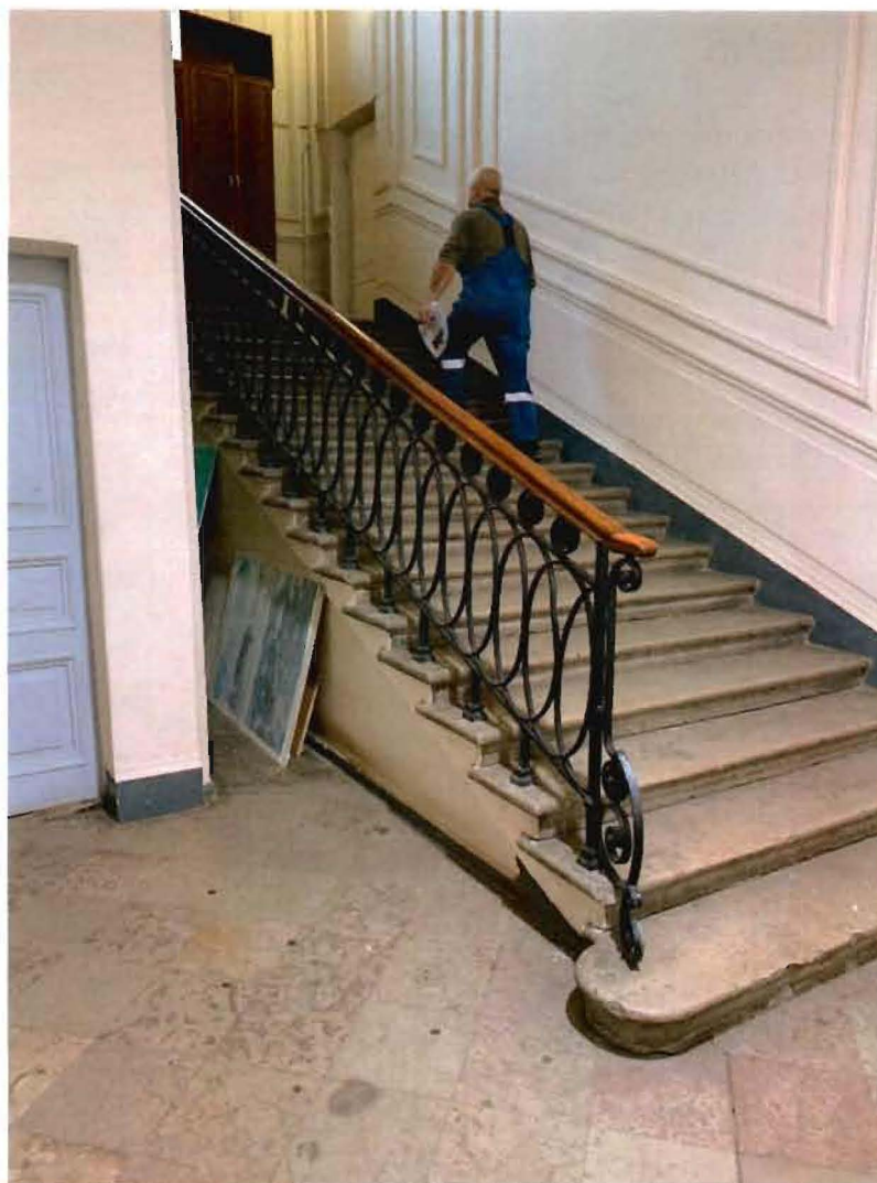
14. Фрагмент лестницы Л-6.