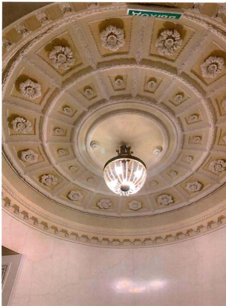
10. Фрагмент интеръера пом. 19-Н (2) Ротонда.