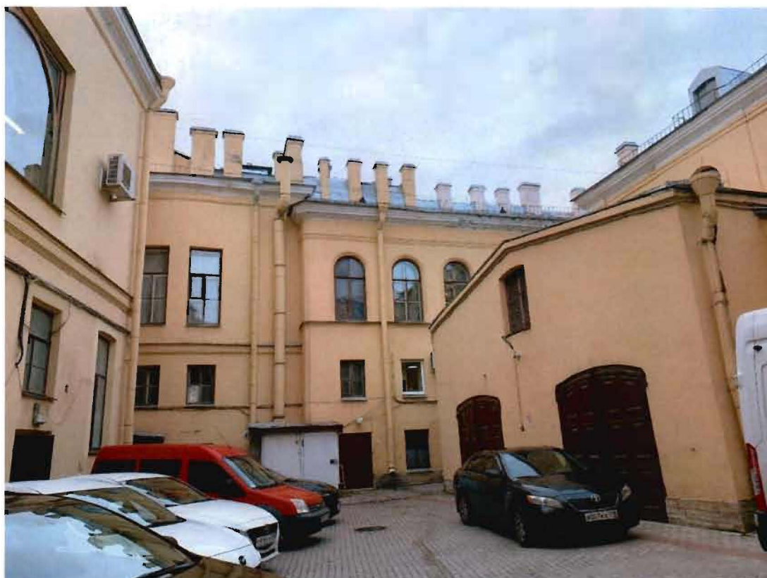
3. Вид на объект культурного наследия со стороны дворового фасада.