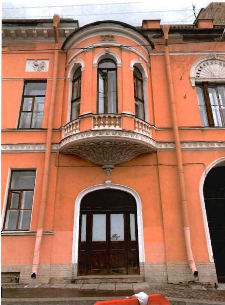
2. Фрагмент объекта культурного наследия со стороны наб.р.Мойки.