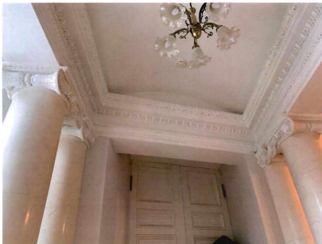
11. Фрагмент интеръера пом. 19-Н (26).