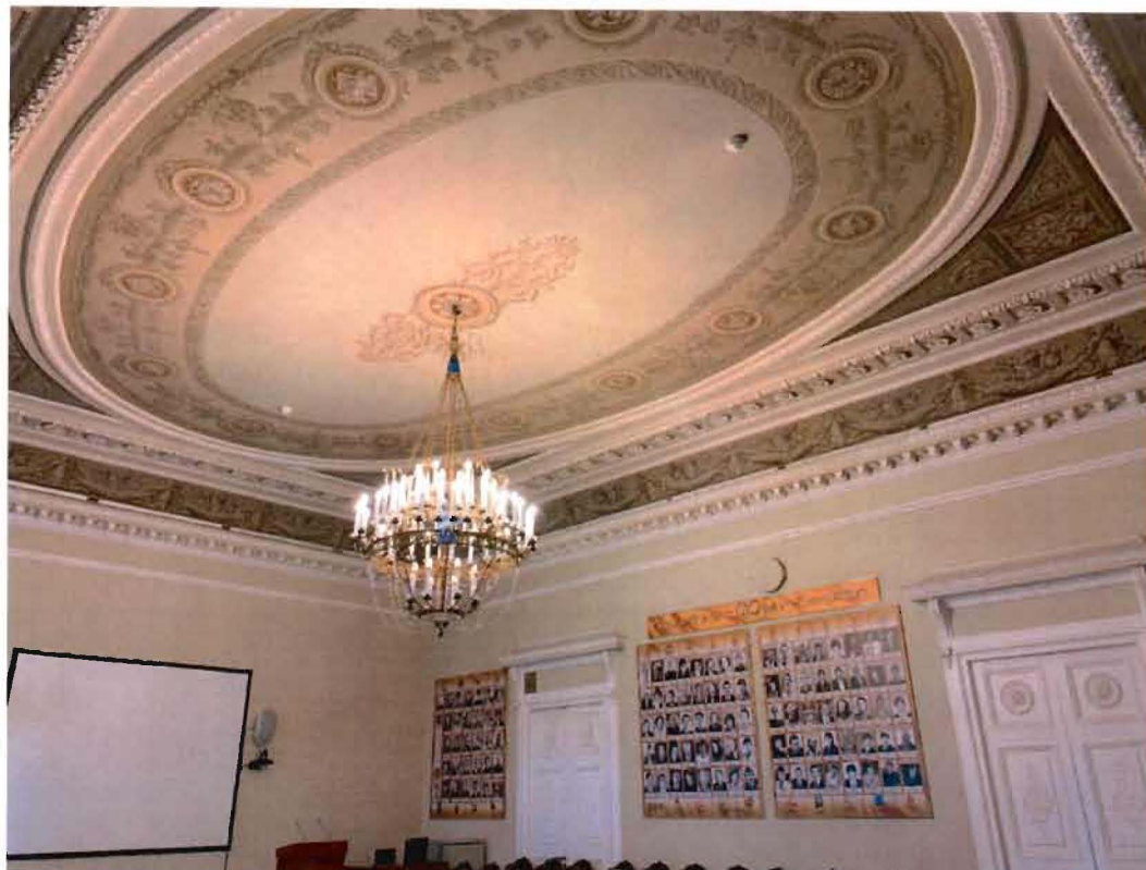
12. Фрагмент интерьера пом. 19-Н (24) кабинет князя.