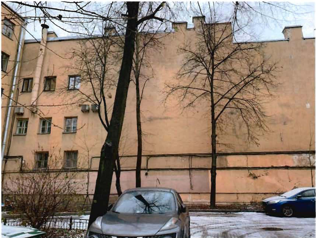
5. Вид на объект культурного наследия со стороны восточного фасада по Мошкову пер.