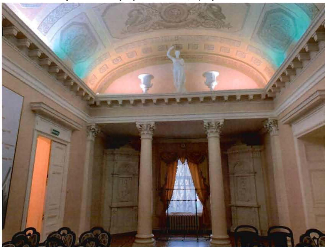
9. Фрагмент интерьера пом. 19-Н (25) Армянская столовая.