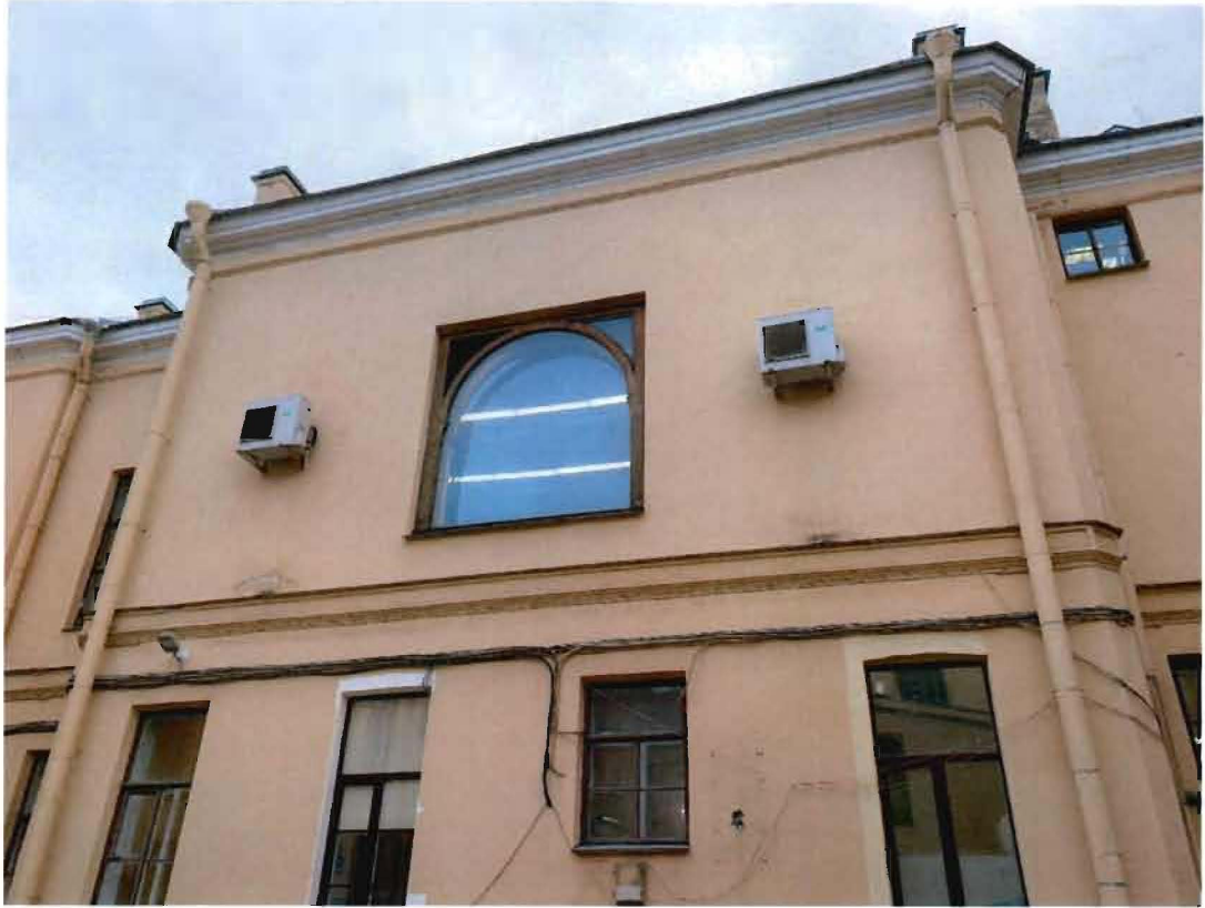
4. Вид на объект культурного наследия со стороны дворового фасада.