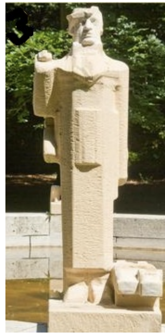
Teun de Jager