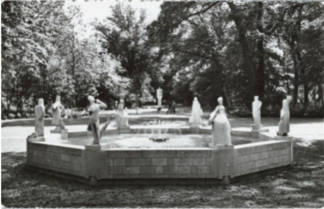
Het monument in 1962

In de beeldentuin van museum de Fundatie in Heino staan de originele beelden opgesteld. De beelden zijn helaas sterk verweerd. Twee beelden zijn in zo slechte staat dat ze niet meer buiten staan opgesteld. De zachte kalksteen is niet goed bestand tegen weersinvloeden.