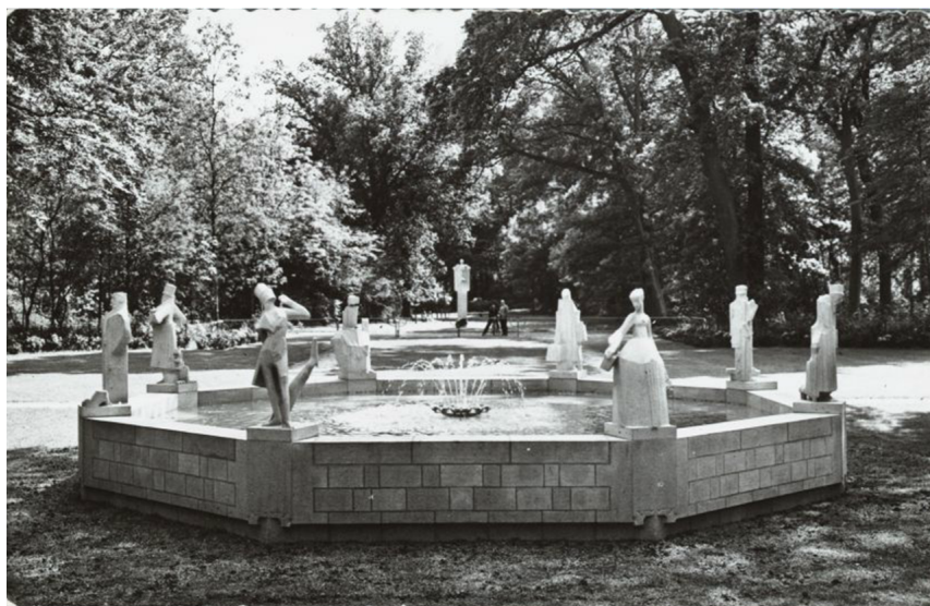
Een prentbriefkaart van het Hildebrand Monument kort na z'n onthulling in 1962

Weest zoo goed, mijn monument ter eere van de Camera Obscura, Hildebrand en zijn voorliefde voor de natuur, de plaats bezuiden den Hertenkamp aan te willen wijzen. (J. Brommer, december 1932)