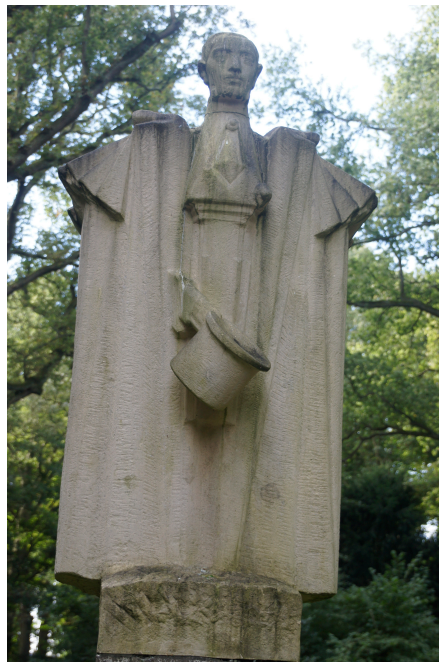
Het nog resterende (kunststof) beeld van Hildebrnd in de Hout