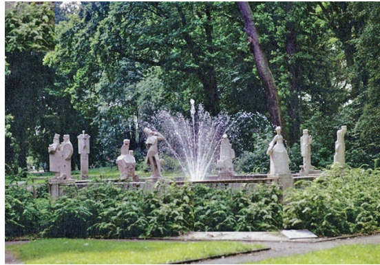
Het Monument is de jaren '60

175 jaar geleden schrijft Nicolaas Beets onder het pseudoniem Hildebrand het boek de Camera Obscura . In het boek neemt hij in verschillende verhalen de burgerlijkheid op de hak. Ter gelegenheid van de honderdste geboortedag van Beets, in 1914, start een ontwerpwedstrijd voor een Hildebrand Monument. Jan Bronner wint met zijn ontwerp van een achtkantige fontein waarbij op iedere hoek een beeld van een figuur uit het boek staat en op dertig meter afstand, verhoogd het geheel overziend, het beeld van verteller Hildebrand.