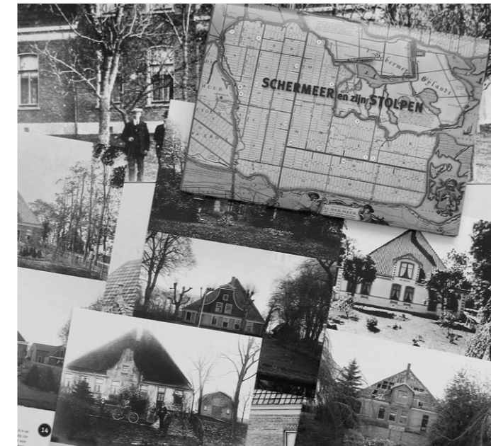
16 kaarten met stolpen oud en nieuw in mapje vormen de basis voor een pracht(fiets)route door de jarige Schermer.

De route De Schermer en zijn stolpen is in beeld gebracht in de vorm van een aantrekkelijk mapje met 16 kaarten van dito interessante stolpen. Een dwarsdoorsnede van het erfgoed en zodanig gerangschikt dat er een mooie route door het stolpenland is ontstaan. Op de kaarten is een vroegere afbeelding van de betreffende stolp te zien, meestal met de boerenfamilie al deftig poserend, en een foto van de huidige situatie en op de achterzijde een toelichtende tekst. De omslag van het mapje toont de 'Caerte van de Scher-meer' uit de 17 e eeuw met daarop de nummers van de stolpkaarten en de wegen. De kaarten kunnen verstuurd worden maar wij raden aan twee setjes aan te schaffen om er in ieder geval een zelf te houden. Voor 4 euro aan te schaffen in alle café's en restaurants, in de Museummolens (VVV) en via www.samen375schermer.nl . Ook bij de tentoonstelling in het Zwarte Kerkje. Een echte aanrader!