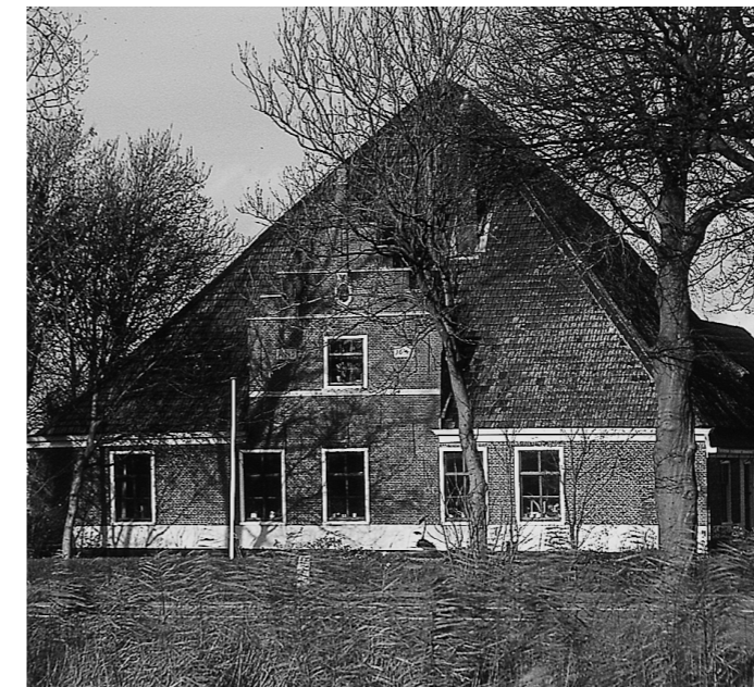
'De 12 Apostelen', Stompetoren. Schermer's oudste stolp (1641). Met karakteristieke 'Vlaamse' gevel en ronde schoorsteen.