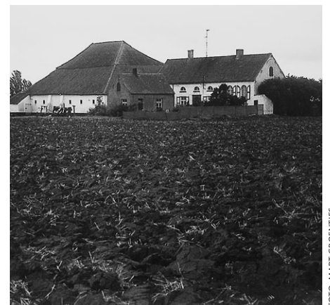
Stolp bij boerderijcomplex in West-Vlaanderen.