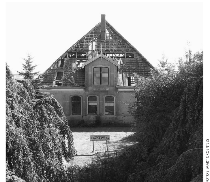
'De Hulst', Noordschermerdijk, Oterleek. De al begonnen afbraak werd stopgezet en plan voor herbestemming voor appartementencomplex ontworpen. Te bezichtigen (met toelichting) op 26 en 27 augustus.

alle 192 Schermer stolpen op briefkaartformaat in de tentoonstelling opgenomen. Openstelling is op zaterdag en zondag en in de feestweek (22 t/m 30 aug.) ook op dinsdag 26 en donderdag 28 augustus (telkens van 11 tot 16 uur).