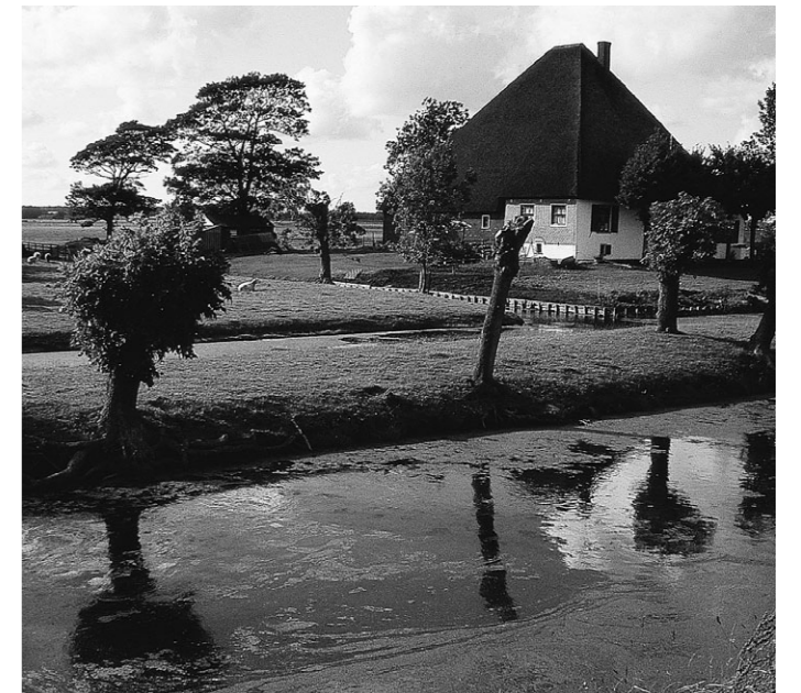
De dubbele singel van 'Weltevreden', aan de Zuidervaart, Zuidchermer.

In het Zwarte Kerkje in Zuidchermer (een godshuis gebouwd als stolp) is van 10 augustus t/m 7 september de tentoonstelling 'De Stolp in Beeld' te zien. Op grote posters komen de verschillende aspecten van de stolp in Noord-Holland in beeld: de types, bouwkundige versieringen, het gebruik vroeger en nu en de bedreigingen. Ook zijn er unieke opnamen uit de jaren rond der eeuwwisseling naar de 20 eeuw uit de collectie van Jan de Groot waarbij Schermer families met knecht, meid, hond en boerenwagen geduldig de lens in kijken. Er zijn maquettes en bovendien zijn