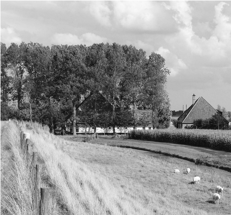
De Schermer. Met al 375 jaar beeldbepalende stolpen.