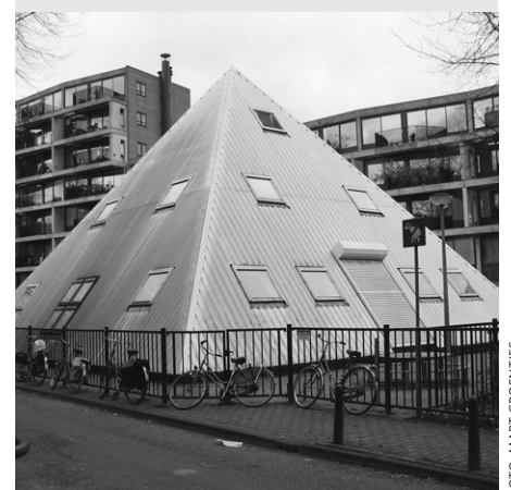
School in piramide-stolpmodel. Midden in Amsterdam