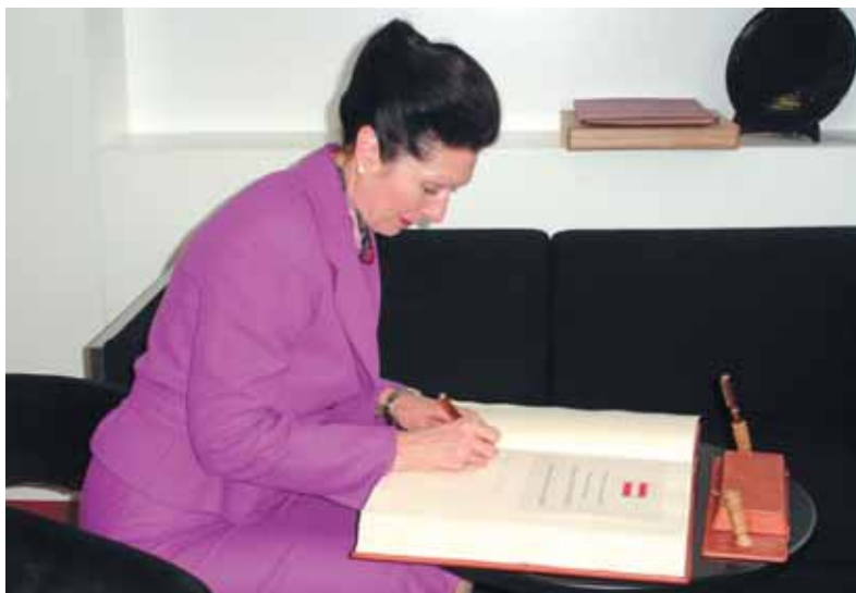
Rakouská velvyslankyně se zapsala do pamětní knihy Karlových Varů