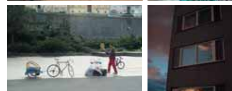
ukázky soutěžních prací