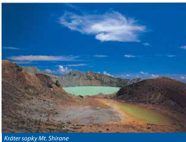
Kráter sopky Mt. Shirane