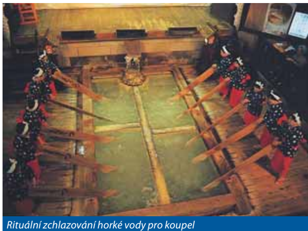
Rituální zchlazování horké vody pro koupel

V Japonsku existuje asi 3000 lázeňských míst s horkými minerálními prameny, které jsou sopečného původu. Kusatsu jsou nejstarší a neznámější japonské lázně, leží cca 160 km od Tokia, v hornaté části středního Japonska. Město s více než 8000 obyvateli je obklopeno horami – sopkami, z nichž nejvyšší je Mt. Shirane s 2160 m, tato sopka ještě v r. 1982 aktivně soptila, v jejím kráteru na vrcholu je jezero světle zelené barvy, jehož voda má vysoký pH faktor - blíží se až kyselině sírové. Z druhé strany hor se nachází proslulé zimní středisko Nagano – dějiště Zimních olympijských her 1998. I Kusatsu je v zimním období rájem zimních sportů a ještě do roku 2005-6 zde bylo mnoho sněhu od listopadu do téměř 20. dubna, ale poslední dvě zimní sezony globální oteplování, zdá se, zasáhlo i Japonsko a sněhu měli velmi málo. Najdete zde mnoho velkých hotelů a různých druhů ubytovacích služeb, uvádějí až 20.000 lůžek pro klienty.