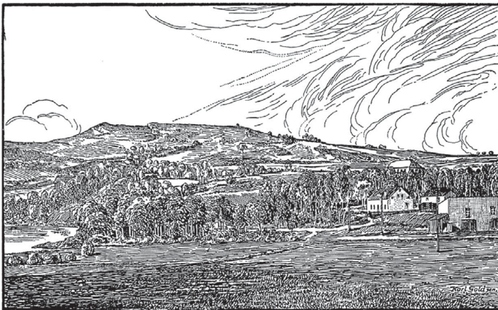
Pohled od Počeren jižním směrem na Tašovice - ráz krajiny se do dnešní doby příliš nezměnil