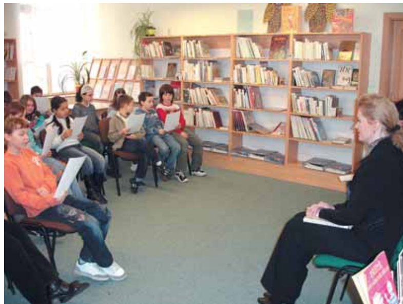
K celostátní kampani „Celé Česko čte dětem“ se připojila i městská knihovna

Městská knihovna Karlovy Vary se připojila ke kampani „Celé Česko čte dětem“. Projekt „Celé Česko čte dětem“ vznikl proto, aby si společnost uvědomila, jak velký význam má hlasité čtení dítěti pro jeho vývoj a pro formování návyku číst si v dospělosti. Hlasité předčítání v přátelské atmosféře je podle odborníků spolehlivý a účinný způsob, jak se může čtení stát pro dítě stejně přitažlivým, či dokonce ještě přitažlivějším než televize. Městská knihovna Karlovy Vary se k projektu připojila v březnu, kdy týden vždy dopoledne probíhalo v budově na ulici I. P. Pavlova čtení pro žáky základních škol.