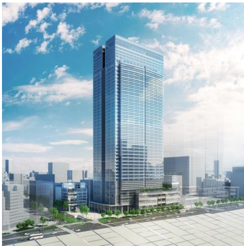
新店舗入居ビル イメージ図