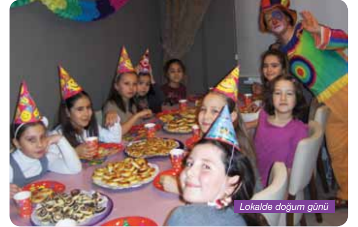
Lokalde doğum günü