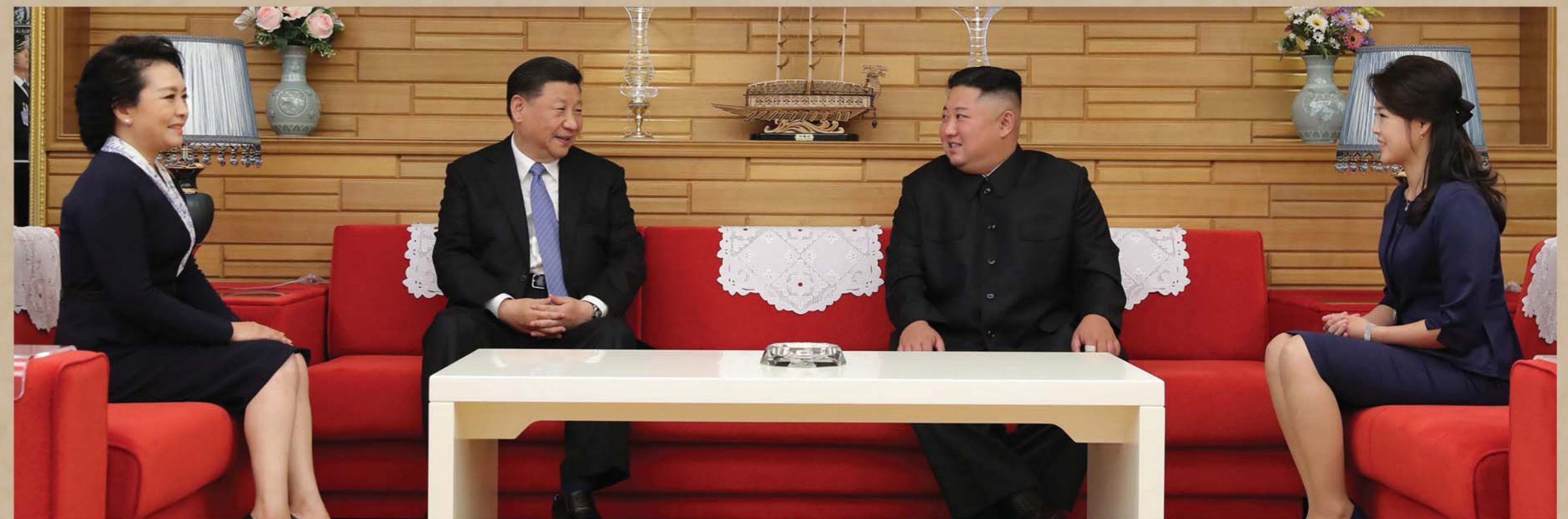
Ким Чен Ын вместе с супругой Ли Соль Чжу нанес визит в Кымсусанскую резиденцию для высоких гостей и тепло встретился с Си Цзиньпином и его супругой Пэн Лиюань. После беседы в дружной семейной обстановке они сфотографировались на память на фоне государственных флагов двух стран.