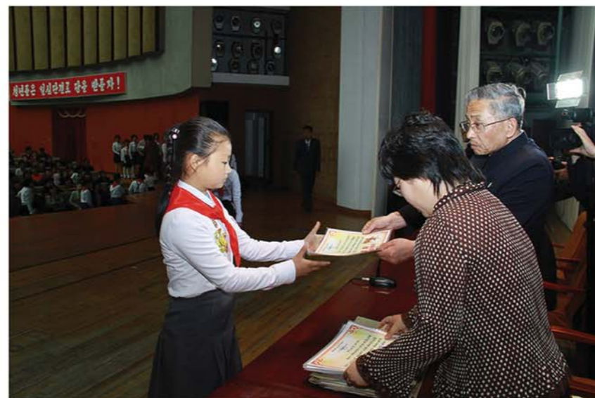
На общереспубликанских конкурсах на лучшее детское литературное произведение.

Уже в 5 лет она начала вести дневник. Таких тетрадей у нее несколько десятков. Там много песен и стихов, рассказывающих о становлении юной поэтессы. Если ее произведения начального периода рассказывали, в основном, о собственных чувствах, то поздние были посвящены рассказам о друзьях и учителях, чувствах любви и гордости за родной край, стремлении и желании беречь и прославлять его.