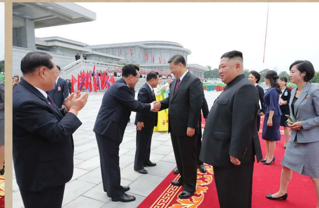
Машина с лидерами двух стран прибыла на площадь Кымсусанского Дворца Солнца, где их ожидают толпы.