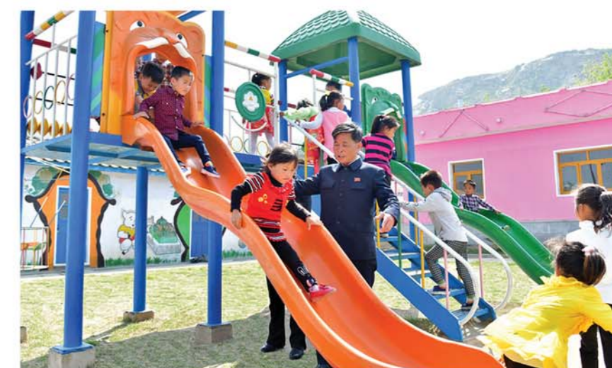
Детский сад – объект его особого внимания.