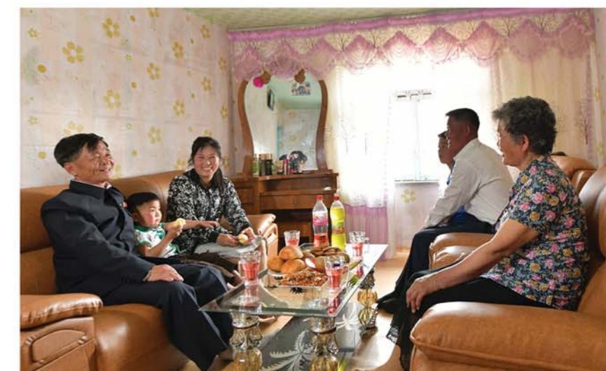
В гостях у рядового рабочего.