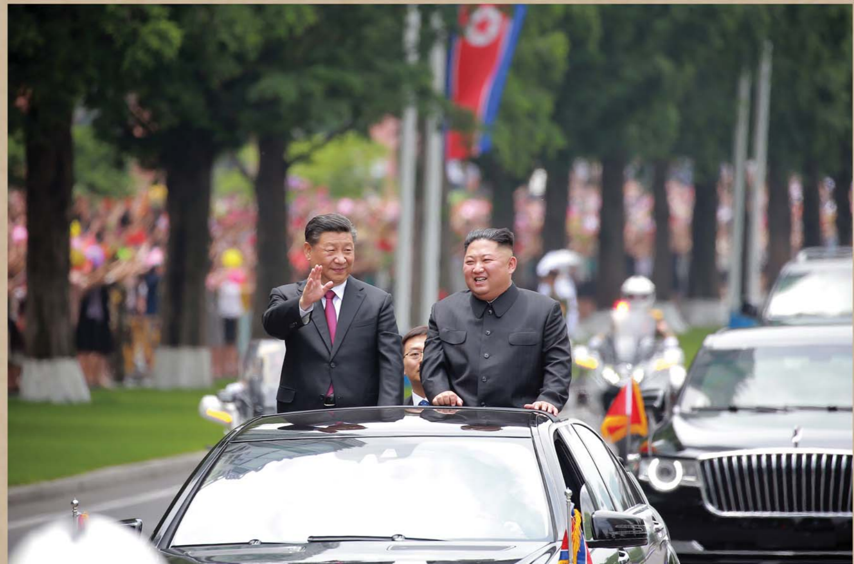
Жители Пхеньяна горячо приветствуют VIP-гостя из Китая, посетившего Корею с теплым чувством братского китайского народа.