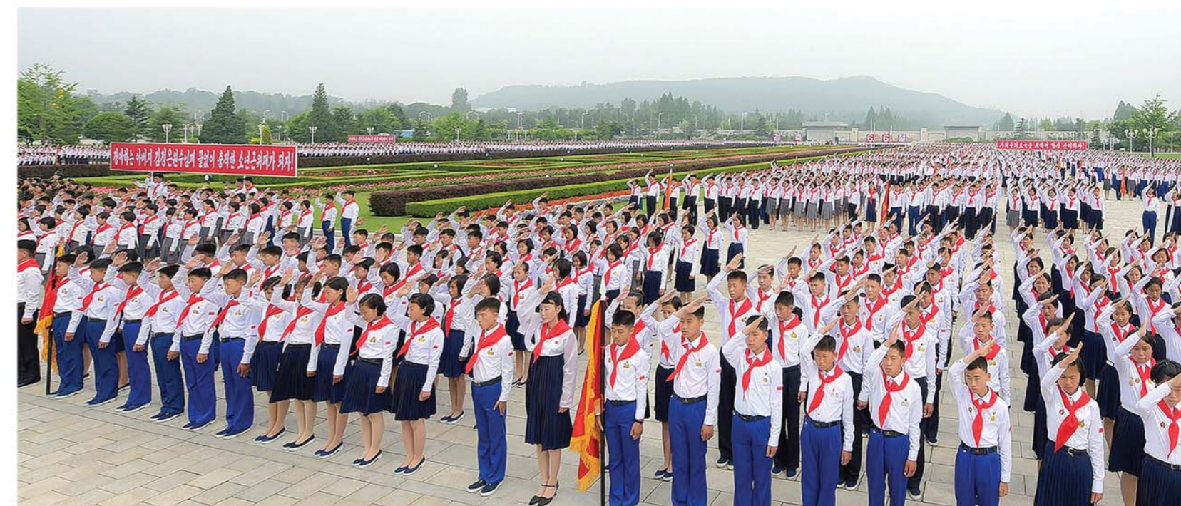
На площади Кымсусанского Дворца Солнца.

Детский союз Кореи отметил свой юбилей – 6 июня. Для участия в торжествах 73-летия Детского союза Кореи прибыли в Пхеньян юные делегаты из провинций и городов центрального подчинения. Первым делом они посетили бронзовые статуи Генералиссимусов Ким Ир Сена и Ким Чен Ира на возвышенности Мансу.