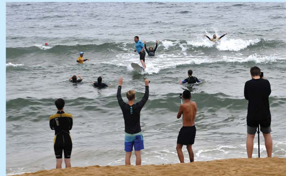
Предусмотрены специализированные виды туризма для любителей полета, лыжного спорта, серфинга и др.