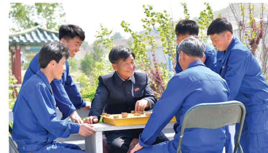
Он всегда открытен с тружениками предприятия.