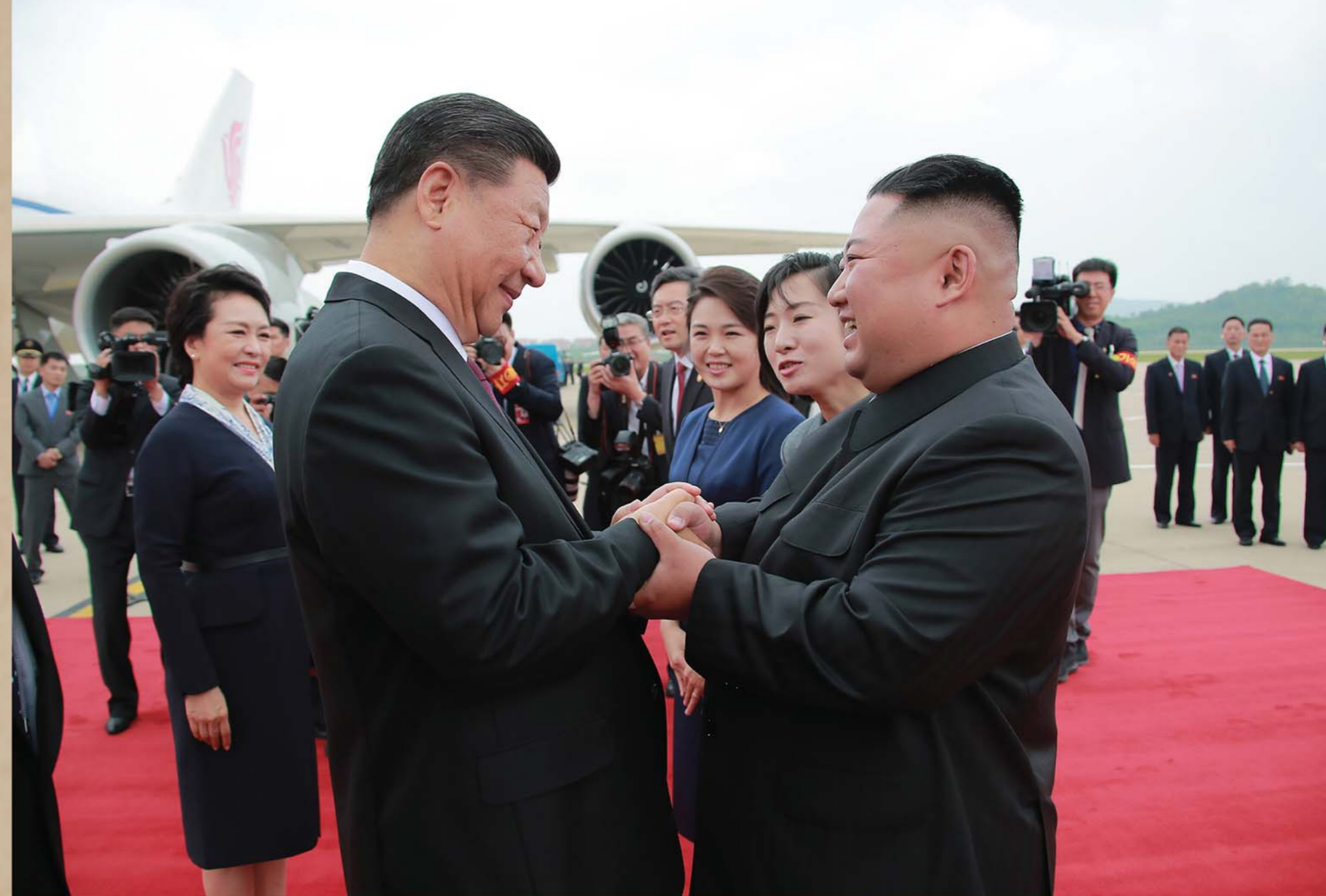
Высший руководитель КНДР Ким Чен Ын тепло встретил Генерального секретаря ЦК КПК, Председателя КНР Си Цзиньпина.