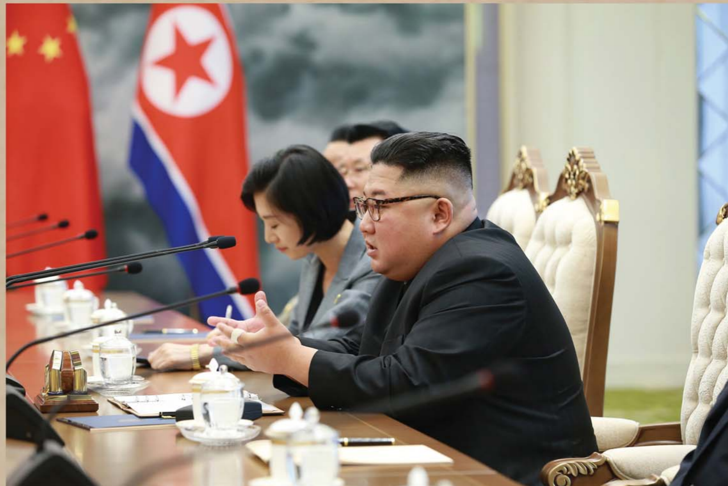
Переговоры между Ким Чен Ыном и Си Цзиньпином.

Во второй половине 20 июня Председатель ТПК, Председатель Госсовета КНДР Ким Чен Ын вел переговоры с Генеральным секретарем ЦК КПК, Председателем КНР Си Цзиньпином.