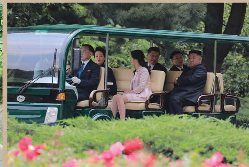
Лидеры и первые леди двух стран, прогуливаясь в саду резиденции, укрепили дружбу.