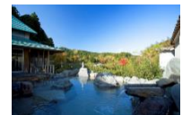
【滝見苑(ごりやくの湯)】