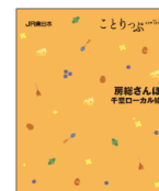
【ことりっぷ(房総さんぽ)】

JR久留里線、小湊鉄道(株)、いすみ鉄道(株)、銚子電気鉄道(株)のローカル線にスポットをあて、沿線のグルメやお土産情報を紹介する「ことりっぷ（房総さんぽ）千葉ローカル線」を10月以降首都圏の主な駅で無料配布します。