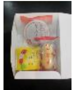
【和菓子詰め合わせ】