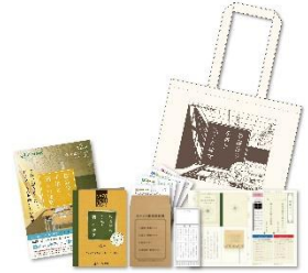
【第 2 章謎解きキット】

※謎解きキットはオリジナルトートバッグ付きです。4,000 名様限定。なくなり次第終了となります。