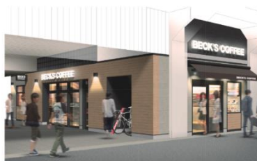
【店舗外観イメージ】

店名：ベックスコーヒーショップ両国 開業予定：9月7日（月） 営業時間：全日 7：00～21：00 運営：(株)JR 東日本フーズ 店舗面積：約 110㎡(約 50席)