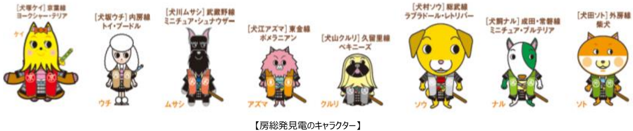
【房総発見電のキャラクター】

※TWITTER、TWEET (ツイート)、RETWEET (リツイート)、Twitter のロゴは Twitter, Inc.またはその関連会社の登録商標です。