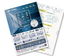
【アナザーストーリー謎解きキット】

[入手方法] 第 2 章謎解きキットのトートバッグを提示のうえ、第 2 章のクリアキーワードを店舗スタッフにお伝えください。※謎解きキットは 2,000 名様限定。なくなり次第終了となります。