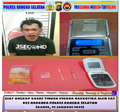
Salah satu tersangka narkoba yang bersama barang bukti berhasil diamankan Sares Narkoba.

tempat olahraga rumah jaga, gudang perbekalan, gudang amunisi, gudang senjata dan beberapa yang lain yang harus kita miliki," ujar dia. Sedangkan untuk personel sendiri, kata Danrem, setelah Makodim Bangka Selatan ditetapkan dan semuanya akan dipenuhi dari komando atas. "Nanti, akan ada alih kodal dari Kodim Bangka Induk (Kodim 0413/Bangka) yang membawahi beberapa kabupaten. Koramil yang disini (Bangka Selatan) langsung otomatis kendali di bawah Kodim Bangka Selatan dan personel Makodim akan dipenuhi dari pimpinan," ungkapnya. Ia mengatakan, pihaknya akan merawat Makodim Bangka Selatan yang telah diserahkan dan akan digunakan untuk kantor Perwira Penghubung (Pabung) yang berpangkat Letkol beserta staf Pabung. "Setelah serah terima ini, Makodim akan ditempati perwira penghubung yang tugasnya untuk berkomunikasi dengan pak Bupati dengan Kapolres dan yang lainnya yang merupakan penghubung dari Kodim Bangka," tutup Danrem. (raw/3)