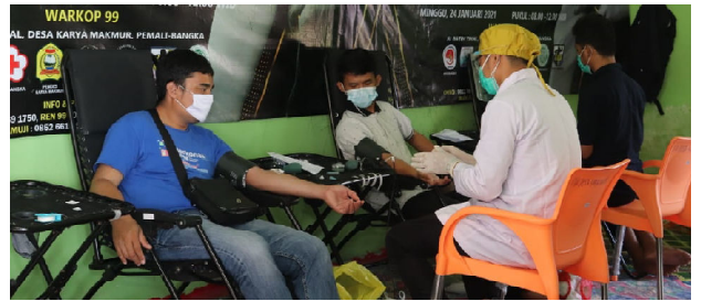
Kegiatan donor darah yang digelar KPD Bangka di Warkop 99 Desa Air Ruay, Pemali, Minggu (24/1/2021).

PEMALI - Komunitas Pendonor Darah (KPD) Bangka melaksanakan donor darah massal di Warkop 99 Desa Air Ruay, Kecamatan Pemali, Minggu (24/1/2021). Kegiatan tersebut dalam rangka peresmian sekretariat KPD yang kini telah ditetapkan menjadi yayasan.