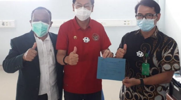
Wabup Belitung usai divaksin Covid-19.

"Mari kita sukseskan proses imunisasi vaksin COVID-19 di Indonesia demi Indonesia yang lebih baik di tahun 2021 pulih dari segi kesehatan dan ekonomi," ajak dia. (ant/3)