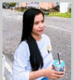
berdonasi untuk para korban bencana di Kalimantan Selatan dan Sulawesi Barat. Hal ini membuktikan bahwa di tengah kemajuan digital saat ini, keberadaan Influencer tidak dapat disepelekan, karena mereka dapat memberikan pengaruh besar dalam membangun jaringan informasi di era digital sekarang, terutama perannya dalam membantu korban bencana alam yang terjadi saat ini.

Namun Influencer Rachel Venya dan juga Fadil Jaidi merupakan salah satu contoh yang memanfaatkan media sosial dalam hal yang positif, yaitu dengan membantu korban bencana banjir di Kalimantan Selatan dan Gempa di Sulawesi Barat. Sebagai aktor yang memiliki power besar dalam sosial media, mereka dapat menggerakkan para pengikutnya di Instagram ikut andil