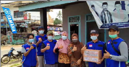
Para pemuda menggelar aksi sosial untuk korban bencana alam di Pulau Jawa, Sulawesi dan Kalimantan, Jumat (22/1/2021).

"Kami sangat mendukung kegiatan positif yang melibatkan para pemuda di Belinyu. Berkegiatan positif seperti ini kedepannya