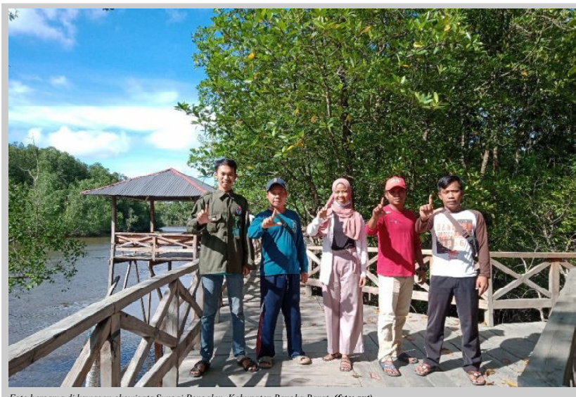
Foto bersama di kawasan ekowisata Sungai Pengalen, Kabupaten Bangka Barat.

Pariwisata berkelanjutan merupakan suatu upaya pemanfaatan sumberdaya lokal yang optimal adalah dengan mengembangkan pariwisata dengan konsep ekowisata dan pemberdayaan warga setempat.