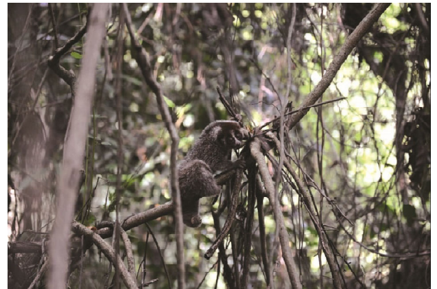
DILEPASLIARKAN - PT Timah bersama Animal Lovers Bangka Island (Alobi) Foundation melepasliarkan sebanyak 6 satwa endemik Provinsi Bangka Belitung (Babel) di salah satu hutan konservasi di Bangka, Kamis (21/1/2021).

Berdasarkan data Satgas Penanganan Covid-19 Babel tadi malam, kasus kumulatif terkonfirmasi positif tercatat sebanyak 3.990 orang. Pada Minggu tercatat ada penambahan 75 pasien baru. Selain itu, tercatat dua pasien meninggal dunia dari Pangkalpinang dan Kabupaten B a n g k a . ● ke Hal 11 Kol 1