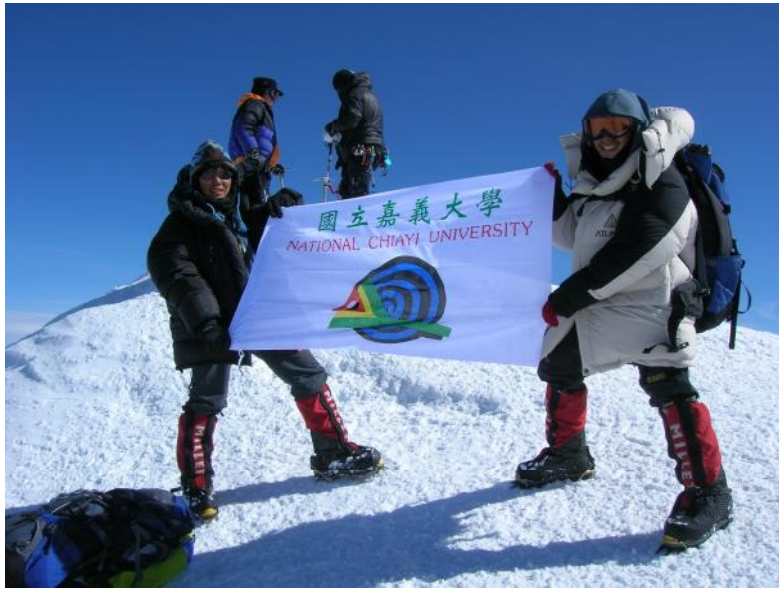
北美第拿里峰 6194 公尺