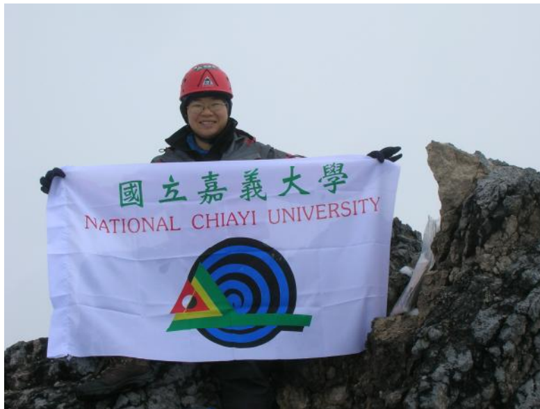
大洋洲查亞峰 4884 公尺

當 1995 年 5 月 12 日站在世界最高峰的同時，亦成為全球華人第一位成功攀登世界最高峰珠穆朗瑪峰(標高 8,848 公尺)的台灣女性，歷經整整 60 天低溫、低壓、低氧的高山冰雪環境下倖存，且全身而退，因此為台灣登山運動創出新紀元。2008 年 1 月 8 日成功完攀世界七大洲最高峰，依舊創下華人女性第一的殊榮。不僅為台灣社會帶來許多正面意義，也為我國登山運動做了最佳的國民外交。更獲頒 97 年度體育精英獎之最佳運動精神獎，經常獲邀至各機關業界演講；以完攀世界七大洲最高峰之經驗與生命歷練等來激勵每一位聽講者，受到相當大的迴響。藉此機會再度跨領域學習將此回饋社會，盼能為台灣登山運動、登山教育之理念帶來新的願景。