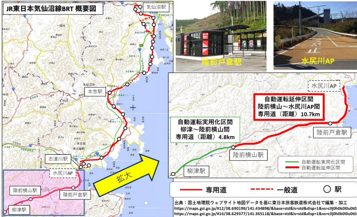
図 2：気仙沼線 BRT 自動運転区間

2022 年 12 月 5 日に気仙沼線 BRT 柳津駅～陸前横山駅間で営業運転を開始した自動運転バスの自動運転区間について、陸前横山駅～水尻川 AP 間を追加します。これにより、2024 年秋頃に自動運転区間は、柳津駅～水尻川 AP 間（15.5km）になります。