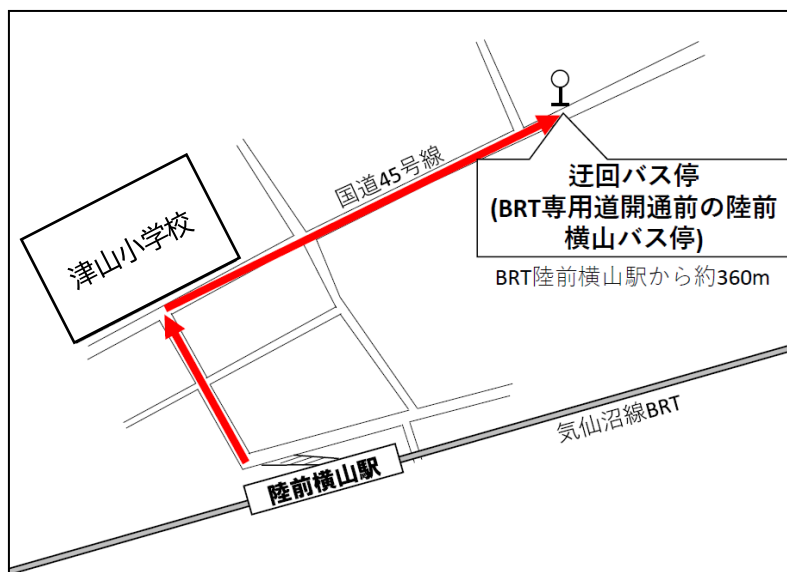
陸前横山駅 迂回バス停位置図