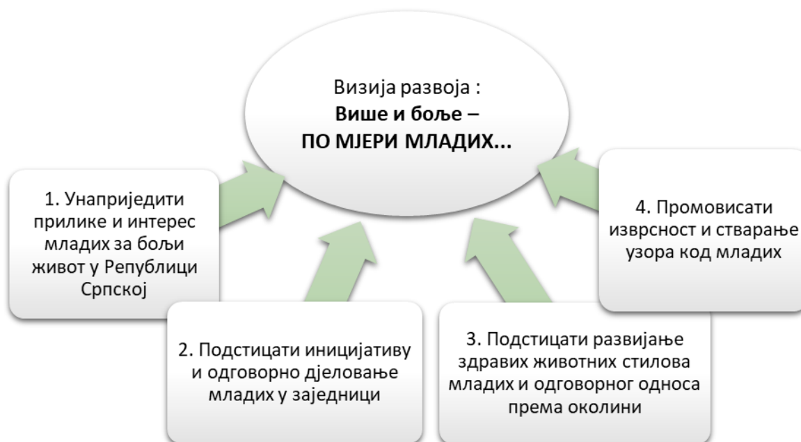
Слика 2: Међусобни однос визије и стратешких циљева

Први стратешки циљ је један од најважнијих циљева у сљедећем стратешком периоду за Републику Српску. Зато је радно тијело које се бави питањима младих Народне скупштине Републике Српске затражило да се у Омладинској политици Републике Српске 2023–2027. стварање услова и претпоставки за останак младих постави као приоритетни циљ и да се у склопу тог циља креира нека врста интерсекторске стратегије, којом би се објединиле политике, мјере и инструменти из других стратегија и ресора, те предложиле нове, недостајуће мјере и инструменти за подршку останку младих у Републици Српској. Ради се, прије свега, о политикама, мјерама и инструментима у областима од значаја за економски развој.