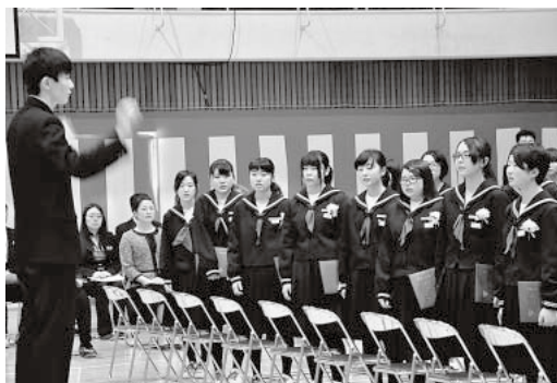
大鰐中学校卒業式(3月13日)