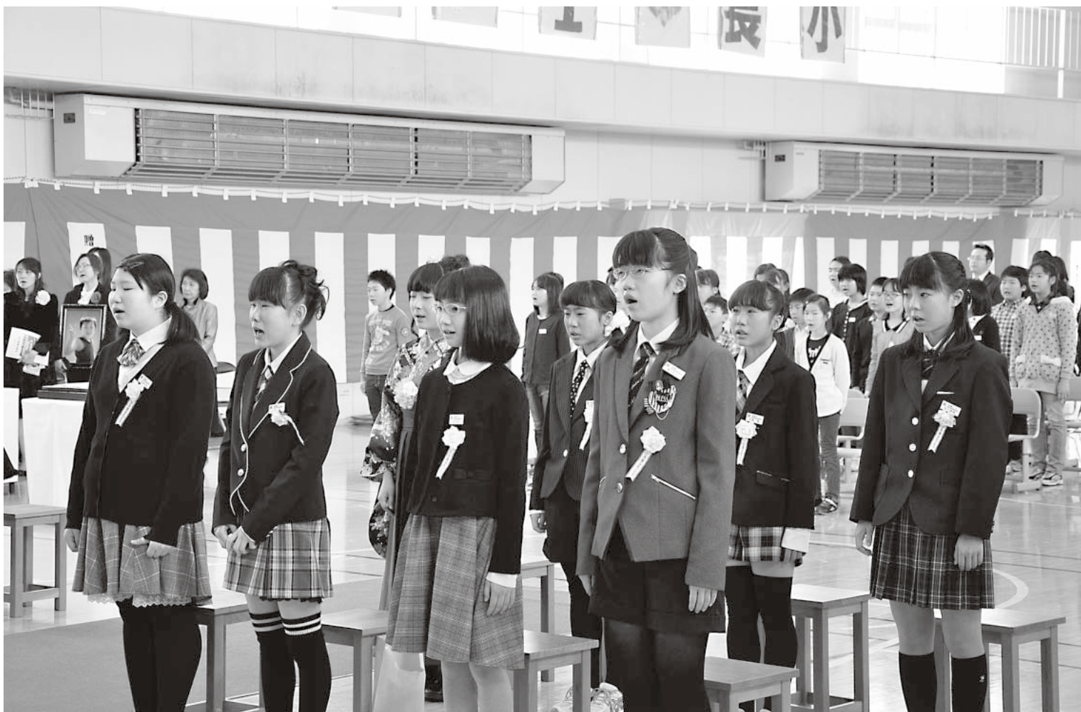
長峰小学校卒業式(3月20日)

大鰐町ホームページアドレス http://www.town.owani.lg.jp