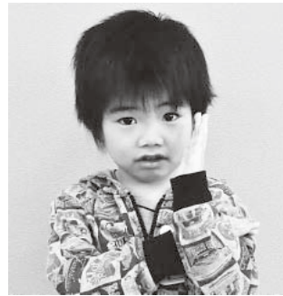
原子景尽ちゃん (慶隆・唐牛)