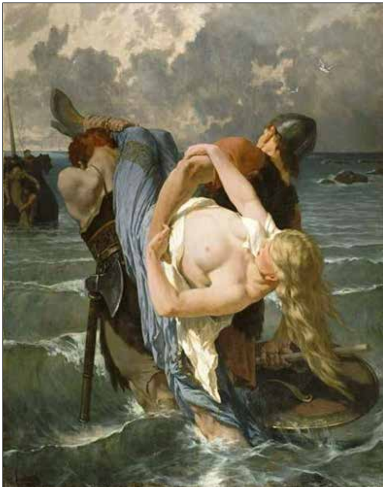
Évariste Vital Luminais (1822–1896), Vikingpiraten in de 9e eeuw , olieverf op canvas, 1,89x1,44 m., collectie Musée Anne de Beaujeu, Moulins