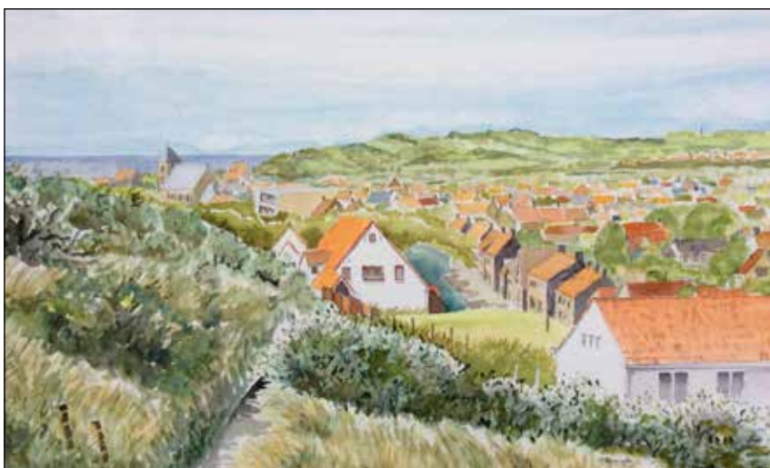
Maurits Schoenmaker, Zoutelande; één van de Zeeuws licht-ansichtkaarten

Het volgende nummer verschijnt in oktober 2016; kopij vòòr 1 september 2016.