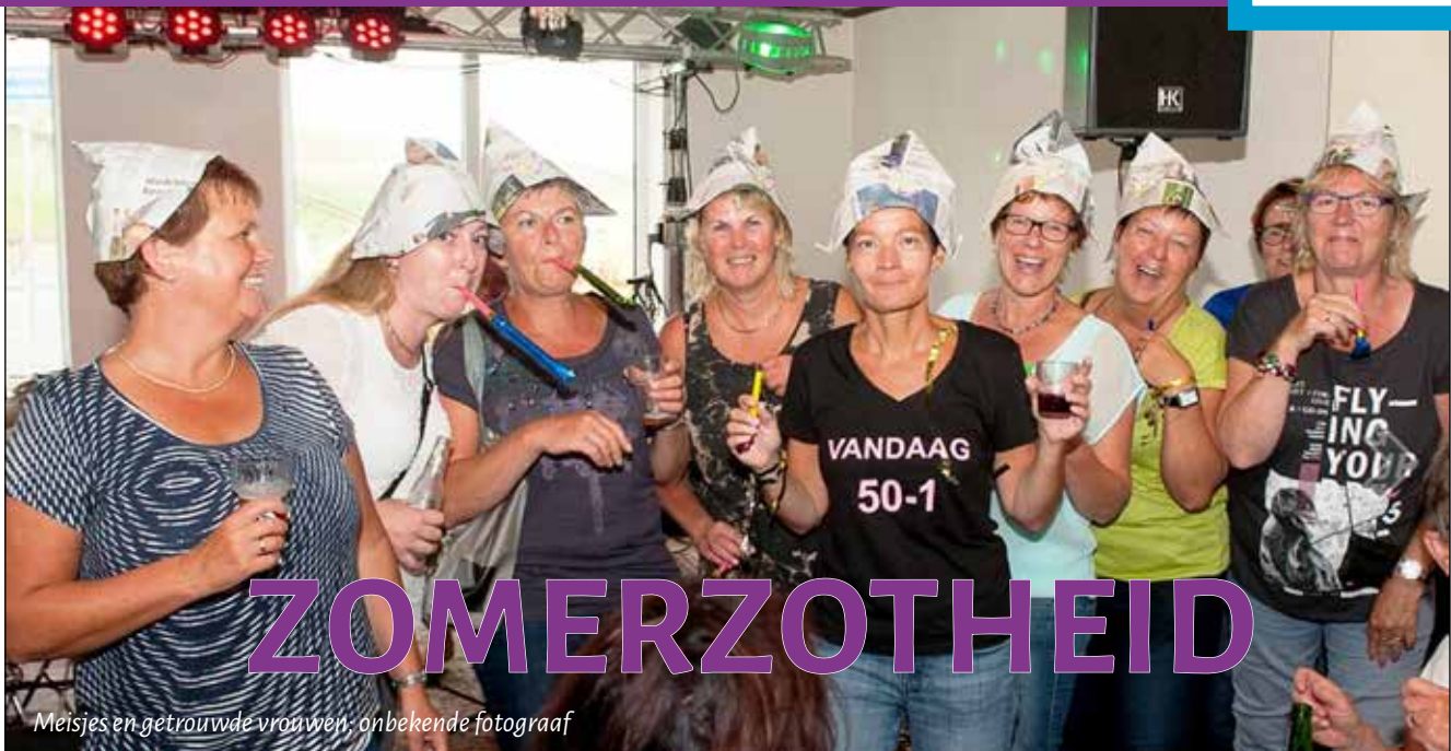
Meisjes en getrouwde vrouwen, onbekende fotograaf