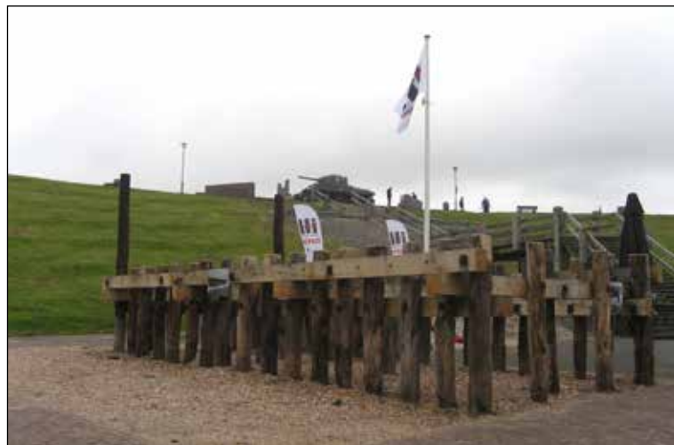
Paalhoofd, nagebouwd bij Het Polderhuis

Ook in het Polderhuis zelf zitten we niet stil. Exposities in het Museumcafé wisselen elkaar af en de permanente tentoonstel-