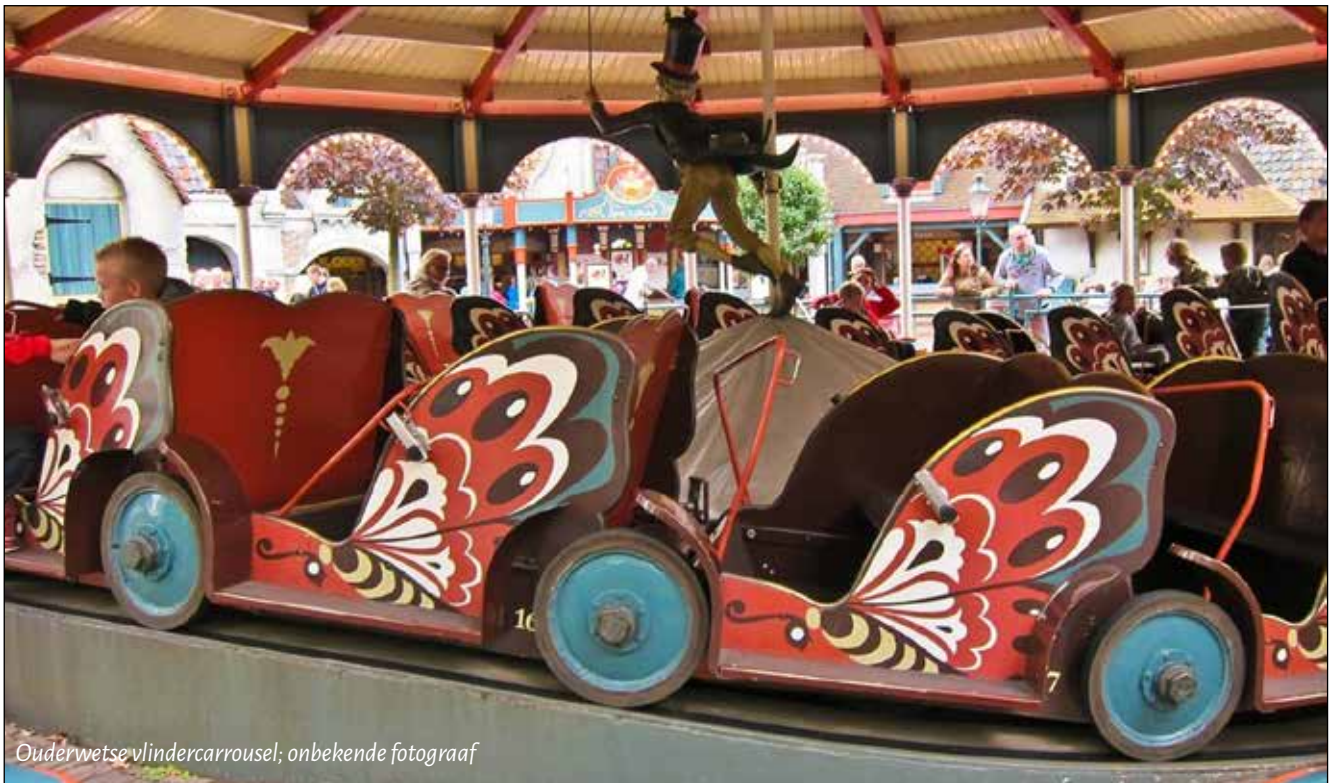
Ouderwetse vlindercarousel

De Westkappelse kermis is er altijd geweest en onveranderlijk, dat is één van z'n charmes. Als we met een tijdmachine konden teruggaan naar een kermis van 55 of 60 jaar geleden zouden we veel dingen direct herkennen. Maar er is ook heel wat veranderd.