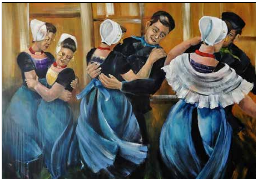
Cocky Wattel, Kermis in Westkapelle (naar Galloway); acryl; 90x120 cm; particuliere collectie

De climax van de dag kwam als je tegen de avond met je ouders mee mocht naar één van de cafés. Hier maakte je kennis met een andere dimensie van de dorpscultuur. Hier werd je voor de rest van je leven met het kermisvirus besmet. Wat was er toch gevaar in al die anders zo ingetogen en hardwerkende dijk- en Scheldewerkers en huisvrouwen? Wat een feest, wat een saamhorigheid! Live muziek en honderdstemmig 'Ach vreemdeling verlaat mij niet'. Je gemoed zou van minder volschieten. Op de voor de gelegenheid geboende dansvloer was het een gewemel van woest ronddraaiende dansparen, vrouwen met opwaaiende zwarte schorten en mannen in een wit overhemd, enkelen in een onderbuis. Het was een tijdperk van schaarste maar nu was overvloed de norm. Het kon niet op met de flesjes Jel of 7-up en als je geen dorst meer had kreeg je wel een Kwatta. Een magische sfeer die eigenlijk niet in woorden is te vatten.