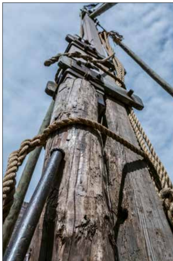
Haal op de hei; foto Stichting Waterheritage

Deze woensdag is ook de dag van de Stratenloop en Wieleronde van Westkapelle met start en finish op de Markt.