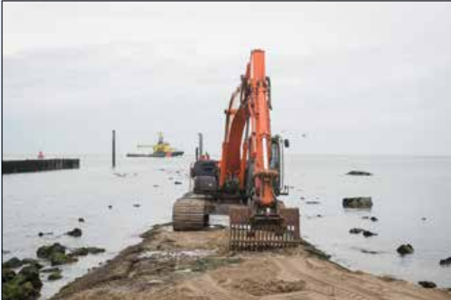
Herstelwerkzaamheden aan 'd'n Bêrm'

Twee jaar geleden sloegen we alarm over 'd'n Bêrm', de strekdam op het badstrand. Steeds sneller en steeds meer kalven er stenen af, waardoor hij helemaal dreigt te verdwijnen. Met de krabben! Als oeverbescherming heeft "D'n Bêrm" geen functie meer en daarom werd er geen onderhoud meer aan gepleegd. Maar gelukkig zijn heeft het Waterschap Scheldestromen toch een aantal herstelwerkzaamheden uitgevoerd