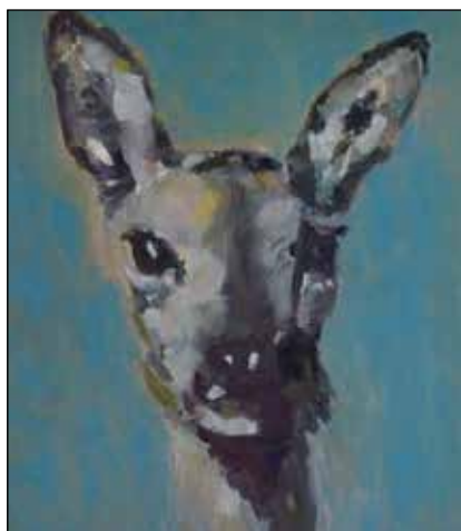
Sabine Beckmann, 'Bambi', olieverf op linnen, 60 x 50 cm, 2014

jaren op Walcheren. Van 25 juni t/m 31 augustus 2016 zijn haar werken bewonderen.