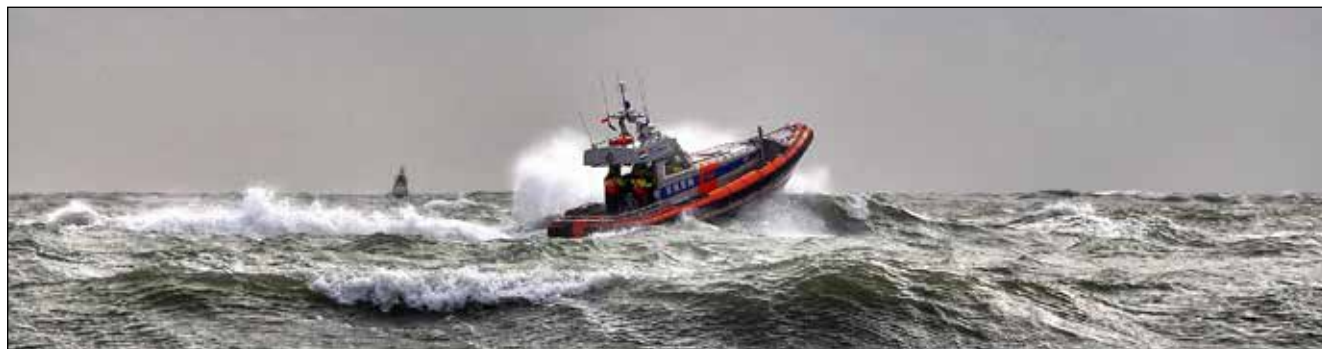
De reddingboot Uly met zware zeegang; foto KNRM

Meer programmadetails en informatie over tijden, deelname, prijzen en inschrijving op http://www.polderhuiswestkapelle.nl/nl/cultuur-en-evenementen/woensdag-westkapelle