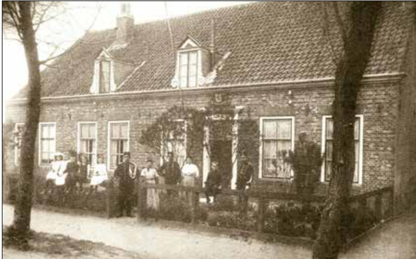
Marechausseekazerne Zuidstraat omstreeks 1920

Maar deze affaire had kwalijke gevolgen voor Westkapelle. Door bemiddeling van burgemeester Overduin kwam er geen verder onderzoek naar de schutter maar er werd een detachement mare-