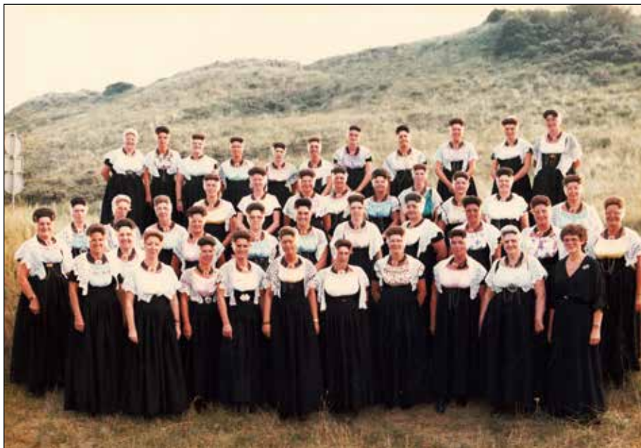
Het Westkappels Dameskoor in 1982

Gedurende het jubileumjaar zal het Westkappels Koor regelmatig te horen en te zien zijn. Op 28 maart 2020 is in 'Westkapelle Herrijst' de jubileumuitvoering met medewerking van het shantykoor De IJsselmannen