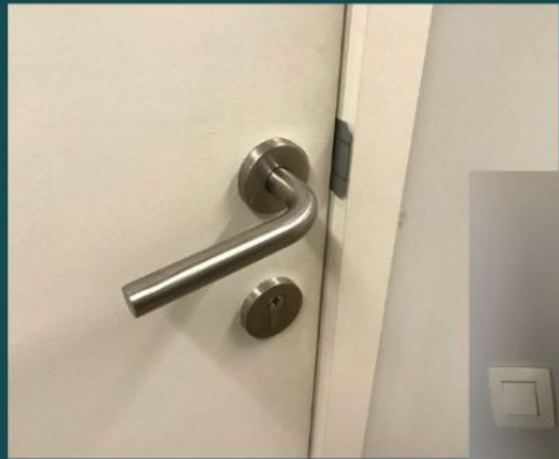
Buitenkant (links) Binnenkant (hieronder)