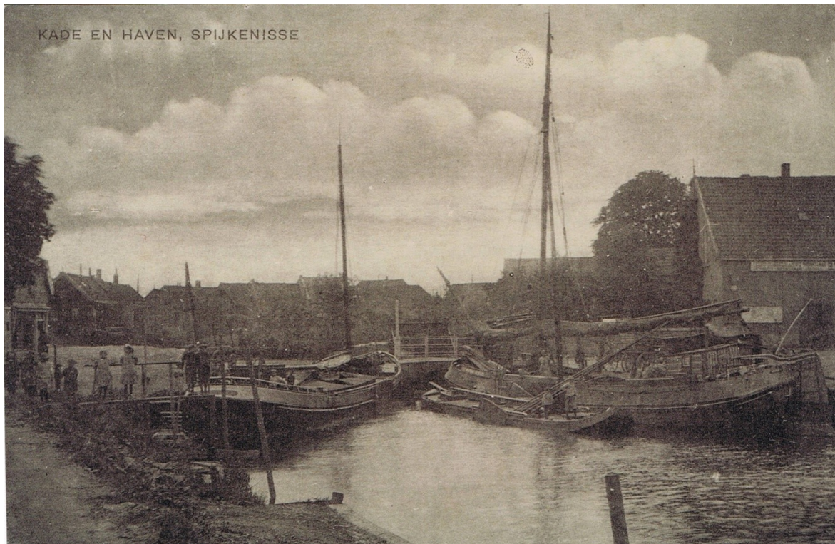
Foto 2. 1915: Haven met op de achtergrond de huizen van de Nieuwstraat.