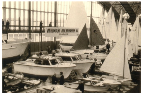
Foto 7 (rechts). De stand van Van Hamburg's Machinefabriek op de HISWA in 1965.