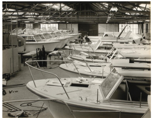
Foto 6 (links) Productiehal en scheepshelling op het ganzengors gezien vanaf het Noordeinde nabij de molen.