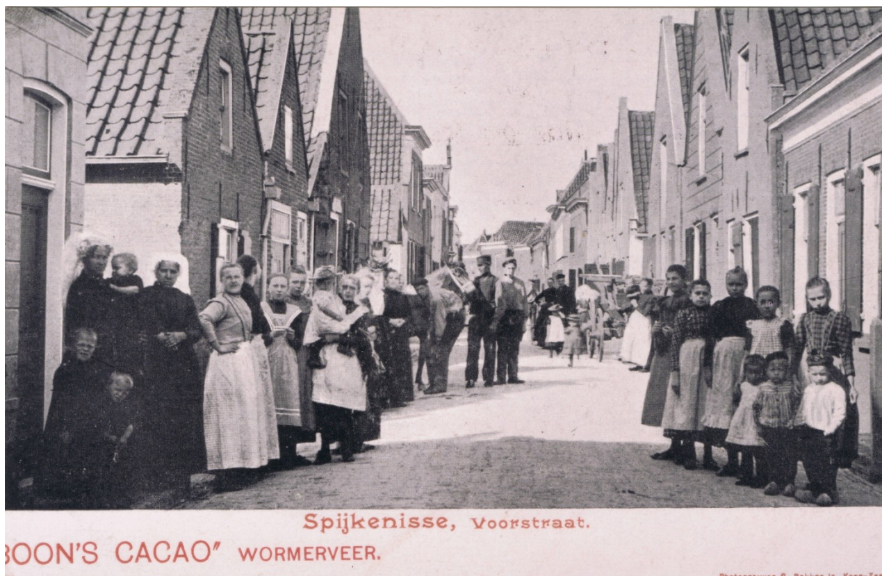
Foto 1 Voorstraat. Eerste huis links is nummer 58 (nu de winkel van Van den Engel), op de plaats van het eerst pand rechts staat nu nummer 65, een nieuw pand met de winkel van Miss Syllly.

Van (een fotokopie van) een Ansichtkaart was de achterkant wel zo interessant als de voorkant. Het gaat om een reclamekaart voor Boon's Cacao waarop de Voorstraat van vóór 1905 te zien is.