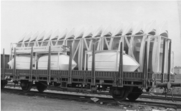
Foto 4 (links) Wagon geladen met een twintigtal roeiboten, klaar voor internationaal vervoer.

Hamburg bouwde op het ganzengors. Het begon met de productie van polyester roeiboten, vervolgens kleine zeilboten, daarna snelle speedboten en eindigde met grote, luxe, stalen jachten. Op het terrein van Van Hamburg werd een helling aangelegd waarmee de grotere schepen te water gelaten konden worden.