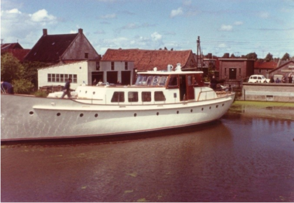
Foto 9. Jacht dat zojuist de scheepshelling van Van Hamburg heeft verlaten. Op de plaats van het witte gebouw achter het jacht staat nu, in het Noordeinde, een benzinstation.

Van Hamburg ontwierp ook een éénwielig aanhangwagentje voor achter een personenauto.