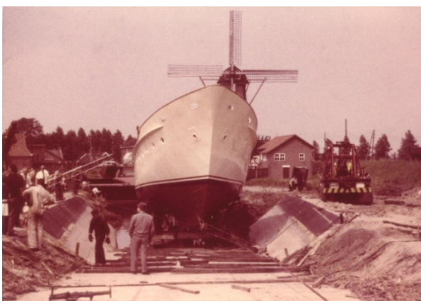
Foto 8 (linka). Scheepshelling van Van Hamburg op het ganzengors. Tewaterlating van ca 20 meter lang stalen jacht. Op de achtergrond de molen in het Noordeinde.