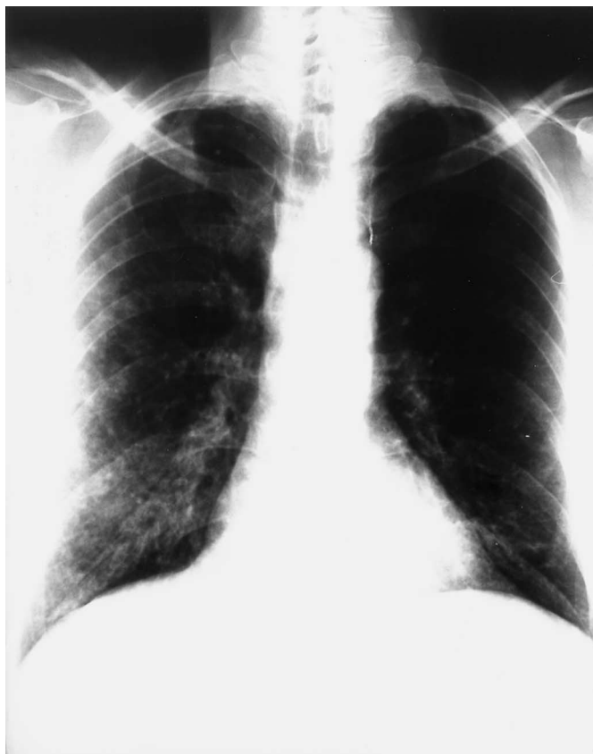
Abb. 1 Röntgen-Thorax kleinfleckige pulmonale Infiltrationen prä- und perikardial sowie beidseits basal mit Betonung des rechten Lungenflügels.

Mycoplasma pneumoniae ist eine von 3 Mykoplasmen-Spezies, die häufig Infektionen bei Menschen verursachen. Die beiden anderen Erreger, Mycoplasma hominis und Ureoplasma ureolyticum , verursachen Erkrankungen des Urogenitaltrakts. Die Infektionsquelle für Mycoplasma pneumoniae ist ausschließlich der Mensch. Die Erreger zeigen eine erhöhte Affinität für das Flimmerepithel des Respirationstrakts [5,6]. Sie wachsen extrem langsam und stellen die kleinsten, bisher bekannten Organismen dar, die sich in einem zellfreien Medium vermehren können. Ihre geringe Größe und das Fehlen einer starren Zellwand sind die Gründe, warum diese Erreger nicht durch übliche bakteriendich-