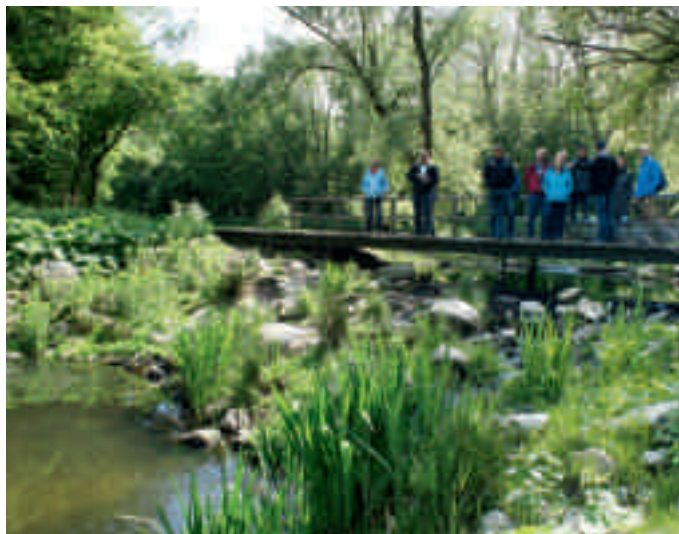
Bij de vistrap.

veel hout uit het bos voor de kachel of open haard. Ze ervoeren het als hún bos. En nog steeds, wat te zien is aan hoe ze met honden het park gebruiken. De mensen bedenken hun eigen regels, wat lastig is als je als gemeente ook rekening moet houden met de Flora- en Faunawet. Daarom is sturing via het hondenbeleid hard nodig. Er zijn duidelijke regels waar honden wel en niet mogen komen. Als mensen zich er niet aan houden, kunnen ze op een bekeuring van de boswachter rekenen. Er is een goede samenwerking tussen alle disciplines: beheer, politie, boswachter, groenverzorgers, et cetera, vertellen de beheerders. Iedereen voelt zich verantwoordelijk voor het geheel van 200 hectare