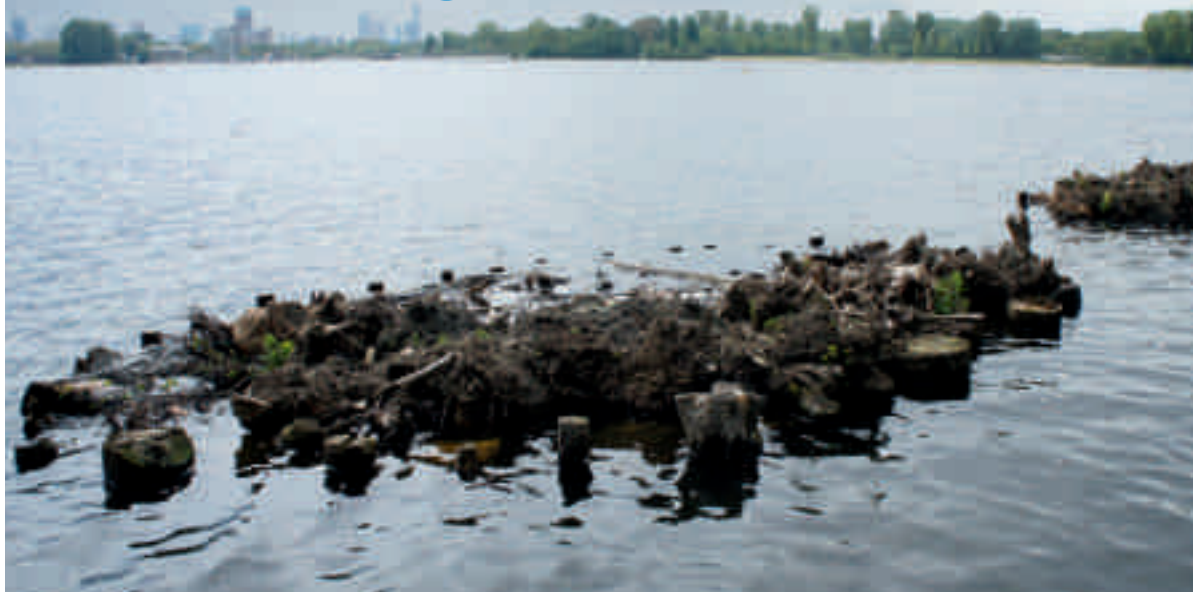
Eilandjes van boomstronken in de Kralingse plas.