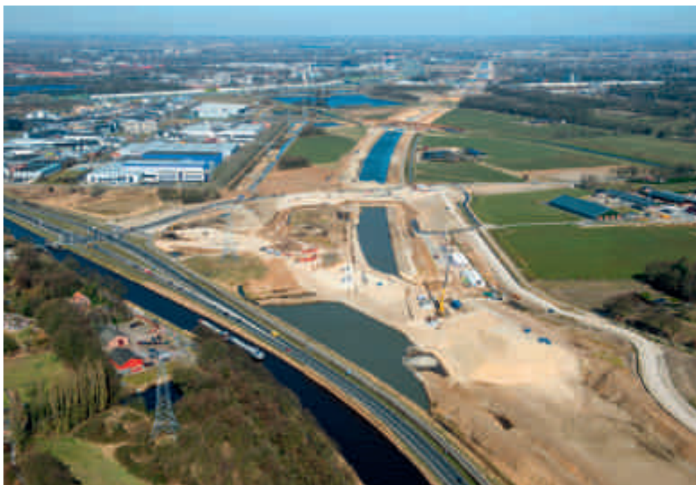
Links: impressie van de het aftakpunt van de omlegging na voltooiing. Boven: de situatie in april.

Het is uniek dat er na jaren weer een kanaal gegraven wordt. Rijkswaterstaat legt tussen Den Bosch en Rosmalen een tracé aan van 9 kilometer. VVA organiseert op vrijdagmiddag 20 september een excursie naar deze verlegging van de Zuid-Willemsvaart vanaf Den Dungen tot aan de Maas. De nieuwe vaart ontlast Den Bosch en kan straks ook grotere schepen met drie lagen containers (klasse IV) aan.