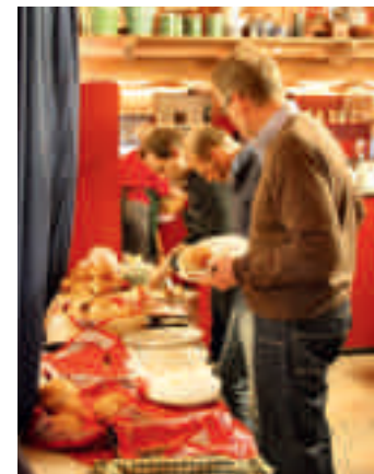
De ALV van 12 april op landgoed Staverden met een lunch en excursie.

Tijdens de Algemene Ledenvergadering (ALV) van 12 april is besloten dat de kascommissie een inventarisatie opmaakt over de stand van zaken van de kas en dat er binnen drie maanden een extra ALV zal worden belegd. Deze extra ALV vindt plaats op donderdag 18 juli om 16.00 uur te Velp. De aanwezigen op de ALV van 12 april hebben schriftelijk een uitnodiging ontvangen. Overige VVA-leden kunnen zich tot aanvang van de vergadering aanmelden via info@vva-larenstein.nl of 026-3695725.