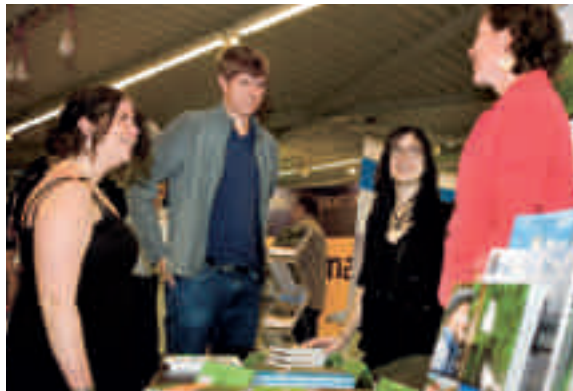
Impressie van de Carrièredag 2012.

tevreden, zo bleek uit de exitpeiling. Vooral de mogelijkheid om te netwerken en zich te oriënteren op de arbeidsmarkt werden in belangrijke mate voorzien. De Carrièredag levert daarmee een directe bijdrage aan de carrièreontwikkeling van studenten en alumni en de personeelsbehoefte van werkgevers. Doe dus als bedrijf of organisatie mee met een stand. Interesse? Informeer bij het VVA-bureau (Marleen Jacobs, info@vva-larenstein.nl , 026-3695864). En kom vooral naar deze succesvolle activiteit op 4 oktober, 10:00-15:00 uur bij Van Hall Larenstein in Velp.