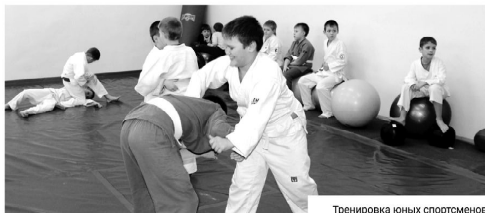
Тренировка юных спортсменов