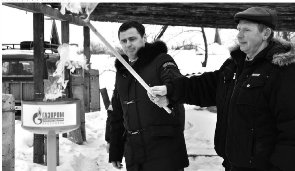
Дмитрий Миронов (слева) в с. Дмитриановское Ростовского района на запуске межпоселкового газопровода

В ЯРОСЛАВСКОЙ ОБЛАСТИ СТАРТОВАЛ МАСШТАБНЫЙ ПРОЕКТ ГАЗИФИКАЦИИ С ОБЩИМ ОБЪЕМОМ ИНВЕСТИЦИЙ ПОЧТИ 2 МИЛЛИАРДА РУБЛЕЙ