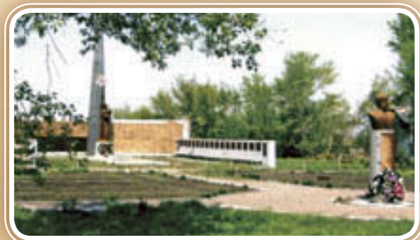
Мемориал воинам-землякам, погибшим в годы Великой Отечественной войны д. Kirgintsevo. 1978 г.