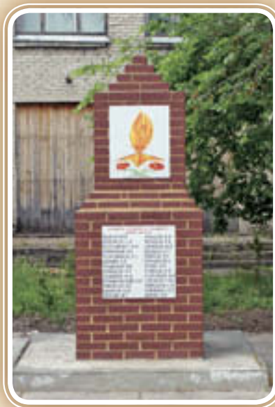
Памятник учителям и ученикам школы № 80, погибшим в годы Великой Отечественной войны ул. Советов, 261. 1967 г., 1976 г., 2010 г.