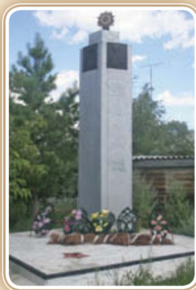
Обелиск воинам-землякам, погибшим в годы Великой Отечественной войны д. Благовещенка. 1979 г.

Установлен по инициативе жителей села и участников Великой Отечественной войны. Посвящен памяти 166 земляков, павших в годы войны.