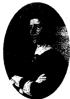
Шарлотта Перкинс Гилман

бежным результатом определенной стадии человеческой истории. Хотя Гилман говорила, что не согласна «ни с теорией, ни с методами, выдвинутыми последователями Маркса» (Цит. по: Hill, 1980, p. 283), ее взгляды имели явное сходство с основной доктриной марксизма. Она утверждала, что экономические условия являются главными для развития человека, что человеческая сущность — не неизменный, но постоянно развивающийся продукт общества и что работа есть первейшая потребность человека, которая в будущем может быть освобождена от экономического принуждения и станет свободно выполняться для всеобщего блага. Подобно Марксу, она считала, что экономическое развитие выведет общество за рамки эгоистичного индивидуализма, эксплуатации и накопительства к человеческой свободе, сотрудничеству и равенству. В отличие же от Маркса она полагала, что это произойдет не путем классовых столкновений и революции, а постепенным и мирным развитием тенденций, уже присутствующих в современном обществе: