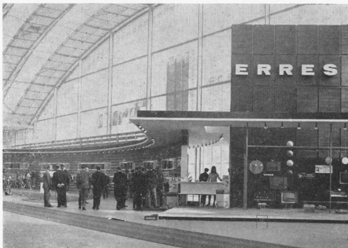
Een gedeeltelijk overzicht van de werkelijk originele ERRES-stand op de Firato. Grijsgrauwe gemetselde stenen in een zeer flauwe hoefijzervorm gaven deze trekpleister een lengte van 80 meter, 15 meter diepte en een oppervlakte van 1000 vierkante meter, terwijl het plafond ongeveer 400 meter in het vierkant groot was. Op de voorgrond de inrichting van een ERRES-hartewensenetalage, met daarnaast de receptie. Van der Heem produkten te kust en te keur werden door de Stokvismensen in deze omgeving opvallend en met smaak getoond.