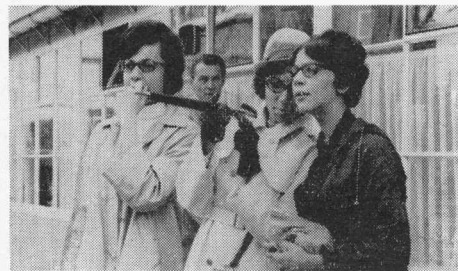
DAAR KOMEN ZE!!

Ik zou u lange verhalen kunnen vertellen over tal van leuke en prettige dingen die wij hebben meegemaakt, de vriendelijkheid