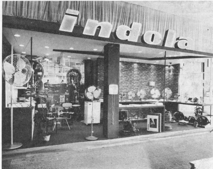
Jaarbeurs Parijs 1965.

Het Parijse kantoor is een der oudste buitenlandse vestigingen: evenals Indola-