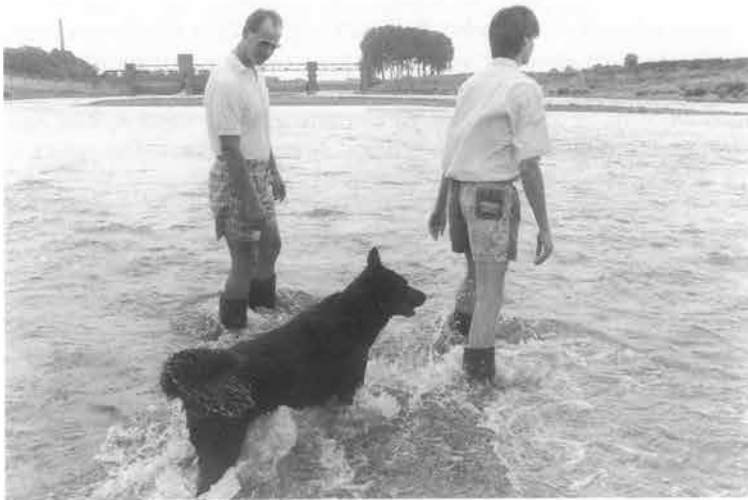
Zo droog was in 1989 de warmste zomer van de 20e eeuw dat de Maas bij Borgharen te voet kon worden overgestoken.

Mocht de toekomstige generatie Maastrichtenaren anders dan de huidige het milieu vriendelijker gaan bejegenen, dan zal dit mee te danken zijn aan de afdeling Kindertuinen, een onderdeel van de sector Natuur- en Milieu-educatie van het Natuur Historisch Museum. Aan 3300 schoolkinderen, die negentig procent van het Maastrichtse basisonderwijs vertegenwoordigen, geven de medewerkers van die afdeling samen met leerkrachten wekelijks praktische invulling aan het begrip natuureducatie. Ook de ouders worden hier zoveel mogelijk bij betrokken. De afdeling, die 13 september haar tweede lustrum vierde met een (eerste) openbare presentatie, neemt in dit opzicht in Limburg het voortouw. Wat in 1979 aarzelend werd aangezet, heeft inmiddels zo'n weerklink gevonden dat scholen voor het voortgezet onderwijs hierop hebben ingehaakt in de vorm van plantsoen- en landschapsadoptatie.