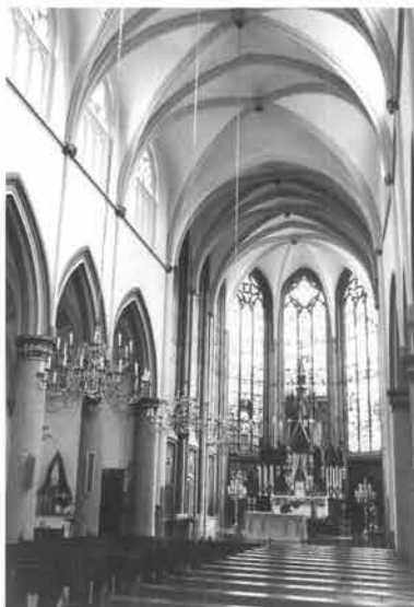
'In de schaduw' van de restauratie van de Sint-Servaasbasiliek voltrok zich in de Sint-Mathiaskerk aan de Bosschstraat eveneens een ware metamorfose.

Een beter lot was de vroeg veertiende eeuwse Sint-Mathiaskerk beschoren. Dit voor de binnenstad zo karakteristieke kerkmonument, dat een bijzondere plaats inneemt in de sociale geschiedenis van de stad, kon na een ingrijpende restauratie 'van vloer tot dak' ten bedrage van zeven miljoen gulden weer worden opengesteld.