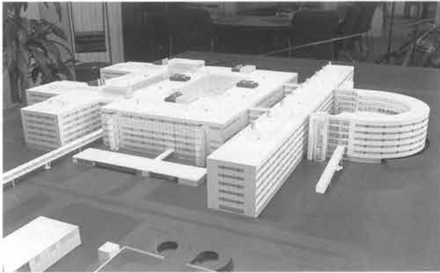
Aansluitend aan de nieuwbouw van het academisch ziekenhuis op Randwyck verrijst (rechts op deze maquette) in de komende twee jaar het nieuwe faculteitsgebouw voor Geneeskunde en Gezondheidswetenschappen.