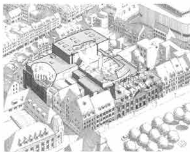
Achter het Generaalshuis aan het Vrijthof wordt reeds hard gewerkt aan het Theater, dat gaat reiken tot aan de Grote Gracht.

muziekaccommodatie à raison van ruim 30 miljoen gulden. De turbulentie in politieke en culturele gelederen is alom en zal jaren aanhouden. De weerstand in de politiek wordt voornamelijk aangewakkerd door grote vraagtekens achter de financierings- en exploitatiekosten. Vanuit de (vooral) muzikale wereld zijn de bezwaren toegespitst op de 'dure, achterhaalde en altijd ongelukkig blijvende combinatie van muziek- en theatervoorziening zonder uitbreidingsmogelijkheid'. In 1981 gaat de raad met zeer ruime meerderheid in principe accoord met het plan Bofinex. Twee jaar later krijgt datzelfde plan van de vroedschap nog slechts de gunst van de twijfel. De meerderheid van stemmen blijkt afgekalfd tot de kleinste mogelijke (20 tegen 19). Die verhouding omlijst het raadsbesluit om het Generaalshuis alvast te restaureren tot cultuurhuis als anticipatie op de totstandkoming van het muziekhuis.