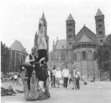
Tijdens het Internationaal Jongleursfestival gaven deelnemers op het Vrijthof hoogstandjes ten beste, die bijna tot aan de spits van de Sint-Janstoren leken te reiken.