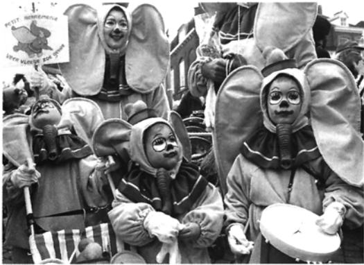
Vastelaovend: elk jaar weer hetzelfde en elk jaar toch weer anders, zolang de jeugd 'het' met de papepel ingegeven krijgt.

Er ging in 1989 praktisch geschakeerde leven van c met een notitie in herinne gebeurtenissen tot kleine, gold vooral voor de 'Mestreech' voor heten doot dat jaar weer heel wat te vieren, te herdenken, te beleven en, zoals de lokale folklore het wil, ook te 'vreigele'. Het was dát 'Mestreech' dat de charme, de zwier en de ambiance van de stad bepaalde en uitstraalde.