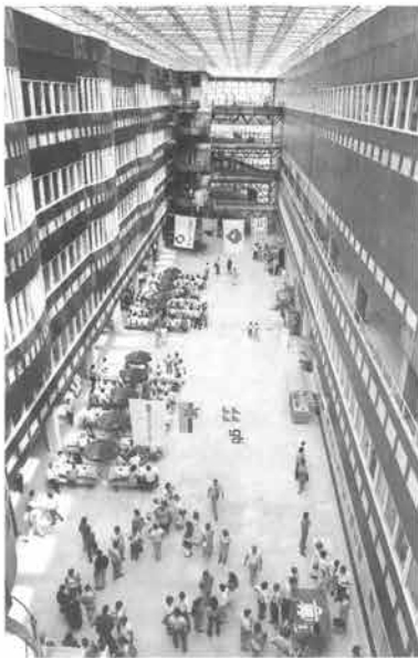
Een doorkijk op de zogenaamde serrehal van het nieuwe, op Randwyck in aanbouw zijnde academisch ziekenhuis.

Kort voor het einde van het jaar ging op Randwyck de eerste paal in de grond voor het nieuwe faculteitsgebouw Geneeskunde en Gezondheidswetenschappen. Het zal architectonisch een eenheid vormen met de nieuwbouw van het AZM. Het zes verdiepingen tellende nieuwe onderdak van de medische faculteit, dat 52 miljoen