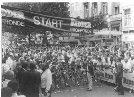
Aan de meet op het Vrijthof van een van de jaarlijkse binnenstedelijke sportevenementen, de Ridderronde voor prof-wielrenners. Per traditie altijd goed voor een drankje-na.