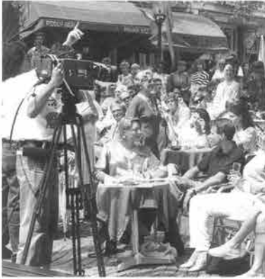
Het Onze-Lieve-Vrouweplein, nu niet alleen een groot en gezellig terras, maar voor een ochtend ook een grote openluchtstudio.

Vrijdag 20 mei zeven uur in de ochtend, New Yorkse tijd. Ruim 21 miljoen Amerikanen, net uit de veren, lodderogen naar de beeldbuis. 'A very good morning America from Maastricht in Holland!' Een onvermijdelijke 'big smile' begeleidt de routineus opgewekte begroeting van de presentator aan de Europese kant van de Atlantische Oceaan. Televisiecamera's zoomen in op de caféterrassen van het O.L.Vrouweplein. Holland is kennelijk niet meer wat het geweest is. Er valt geen 'wooden shoe' op het beeldscherm te bespeuren, wel glazen bier op de terrastafeltjes. In Maastricht is het één uur in de middag.