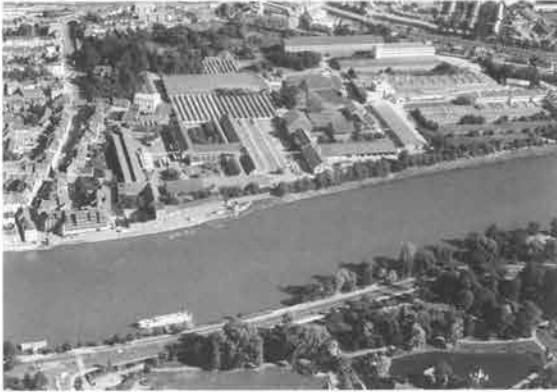
Het Céramiqueterrein in vogelvlucht, waar de Maastrichtse binnenstad haar stedelijke afronding realiseert.

Een globale opsomming en omschrijving van deze visie: