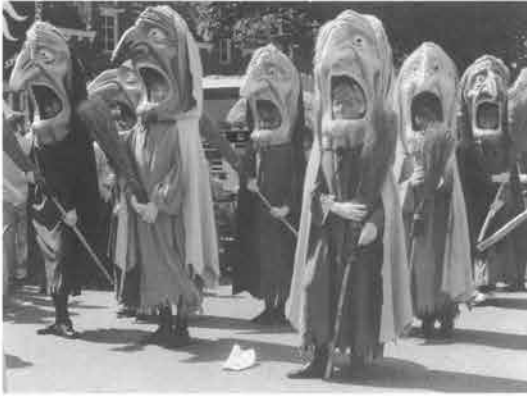
tijdens het Internationaal Reuzenfeest trokken in de kilometerslange stoet hordes heksen mee.