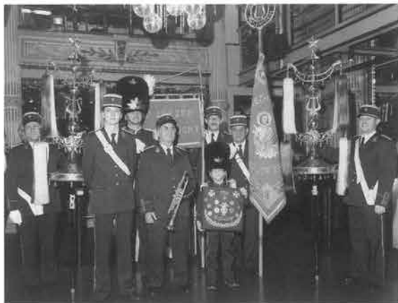
De Mestreechter Fanfaar Sint Jozep in haar nieuwe uitmonstering.