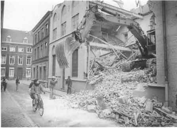
Dat gaf een klap, een stofwolk en een puinhoop, toen langszij de Witmakersstraat het Reparaticenklooster werd gesloopt.

de 'Kleine Komedie' aan de Patersbaan, van oudsher bekend als 'Derde Ordegebouw' en later herdoopt tot Gymnasion. Het vijf verdiepingen hoge gebouw telt drie woonvleugels, die een wintertuin omsluiten. Brandstichters waren de slopers voor. Op 13 april werd het Gymnasion door een felle brand grotendeels verwoest.