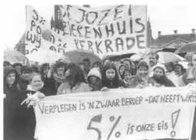
Verpleegkundigen uit geheel Limburg togen medio maart in het kader van een landelijke actie naar het Vrijthof voor het houden van een massale demonstratie met als inzet een loonsverhoging van vijf procent.

Eveneens voor 1990 zwengelden B en W een fusie aan van de kinderopvangverblijven in de stad. Door het vormen van één centrale instelling, ondergebracht in een stichting, zal er als voortvloeisel van de wet Oort aanzienlijk meer subsidie beschikbaar