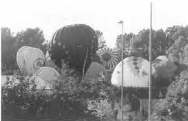
Als reuzenzwammen wellen de kleurige ballonnen op tussen het groen op de Dousberg.

Een van de markantste gedeelten vormde de uitbeelding van de 'blijde incomste', die Karel V samen met zijn zoon Philips II in 1550 in Maastricht hield. Dit reuze(n)festijn, voor de vierde maal door het Reuzengilde Gigantius georganiseerd, bracht naar schatting 60.000 mensen op de been. Onder het toezien van de Maastrichtse reus Gigantius werden aan de 'politieke reuzen' van Nederland en België, de premiers Lubbers en Martens, de eerste exemplaren aangeboden van de zilveren Caroluspenning, speciaal geslagen ter gelegenheid van het reusachtig rendez-vous. De penning was het wettig betaalmiddel ten tijde van het bezoek van Karel V aan Maastricht.