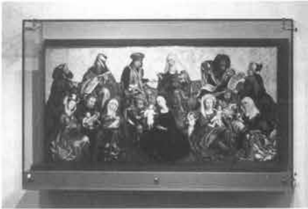
Het vijf eeuwen oude, op planken geschilderde paneel, waarmee de schatkamer van de Sint Servaas werd verrijkt.

restauratie-activiteiten. Zijn vaste plek, die hij sinds vele decennia op het Vrijthof innam, werd hem zonder pardon ontnomen. Hem wacht (nood)gedwongen emigratie naar het Keizer-Karelplein. Deze ingreep was nodig om het terrasvormig Vrijthofplateau aan te passen aan de nieuwe situatie, die in 1990 ontstaat wanneer de twee nieuwe toegangspoorten ter weerszijden van de absis in gebruik worden genomen. Bij de reconstructie en verfraaiing van het terras was de Servaasfontein, met op de rand het beeld van Maastrichts stadspatroon, een sta-in-de-weg. Deze creatie van Charles Vos krijgt straks een plek vlakbij de 'echte' ingang van de kerk.