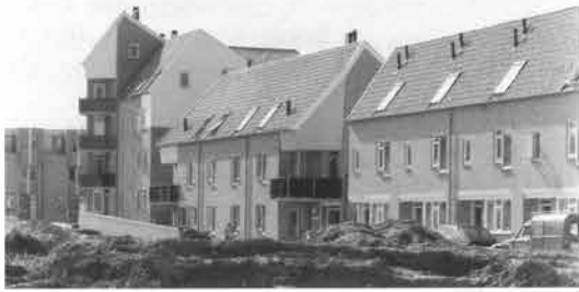
Nieuwbouw op Randwyck, waar de architecten, zo te zien, hun creativiteit de vrije teugel kunnen laten.

In 1989 had Maastricht 3400 woningen tekort. Om deze achterstand weg te werken en de (geringe) aanwas van de bevolking het hoofd