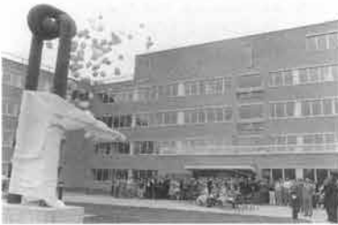
Aan de rand van Pottenberg verrichtte staatssecretaris Koning van Financiën met feestelijk ceremonieel - fiscaal aftrekbaar - de officiële opening van het nieuwe belastingkantoor.

De Vereniging Stadsvernieuwing Wyck vierde in april haar tweede lustrum. In die tien jaar is de vereniging met succes actief en alert geweest als het erom ging mee te denken, te bepleiten en te bemiddelen bij de renovatie-activiteiten van dit eens zo verwaarloosde stadsdeel. In het kader van de lustrumviering werd een herdenkingsboekje 'Wyck Vernieuwd' uitgegeven.