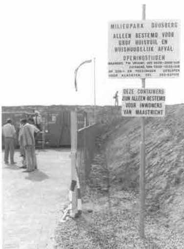
Maastricht wordt milieubewuster. Nabij de Dousberg werd het eerste van een nog te volgen reeks mini-milieuparken ingericht voor het gescheiden inzamelen van huisvuil.