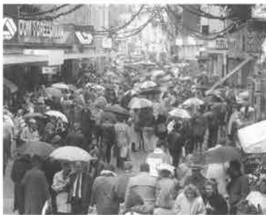
De Grote Staat in kerstfeer. Gezellig druk of irritant druk? Het winkelcentrum van Maastricht begint tekenen van oververhitting te vertonen, die volgens het stadsbestuur tot maatregelen nopen.

De Belgische madammen waren de eersten die het in de gaten hadden. Maastricht is om te winkelen een 'plesante stad met veel van uw goesting'. Niet uitsluitend om de boodschappentassen te vullen op de favoriete vrijdagmarkt, maar ook - of eigenlijk vooral - omwille van een dagje-uit. Al jarenlang is Maastricht voor hen een stad, waar het met een grote variatie aan 'staminees', eetgelegenheden en caféterrassen in en nabij de winkelstraten en pleinen gezellig toeven is. Belgische madammen als pioniers van wat later zou uitgroeien tot de nieuwe folklore van het kooptoerisme ofwel 'fun shoppen'.