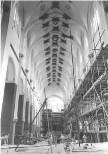
De metamorfose van het interieur van de Sint-Servaasbasiliek nadert haar voltooiing