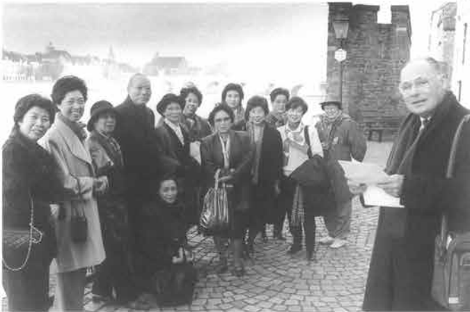
Een vertrouwd beeld in Maastricht. Een zwerm 'doing Europe'-toeristen uit Japan wordt door de stad geleid.

'Promoten' werd het nieuwe sleutelwoord. De Verenigde Staten en Japan gingen als 'verre markten' behoren tot het operatieterrein van de VVV, waaraan een 'Visitors & Convention Bureau' werd toegevoegd, de VVV/VCB. De KLM en sinds 1989 ook de Lufthansa namen Maastricht - met een gelijknamig vliegveld onder handbereik - op in hun toerprogramma voor Amerikaanse 'doing Europe'-toeristen. Bovendien werd Maastricht naast Amsterdam een toeristische 'speerpunt' van het Nederlands Bureau voor Toerisme (NBT) op de Amerikaanse markt. Om het bedrijfsleven eveneens van de promotionele effecten te laten profiteren, werd in 1989 de