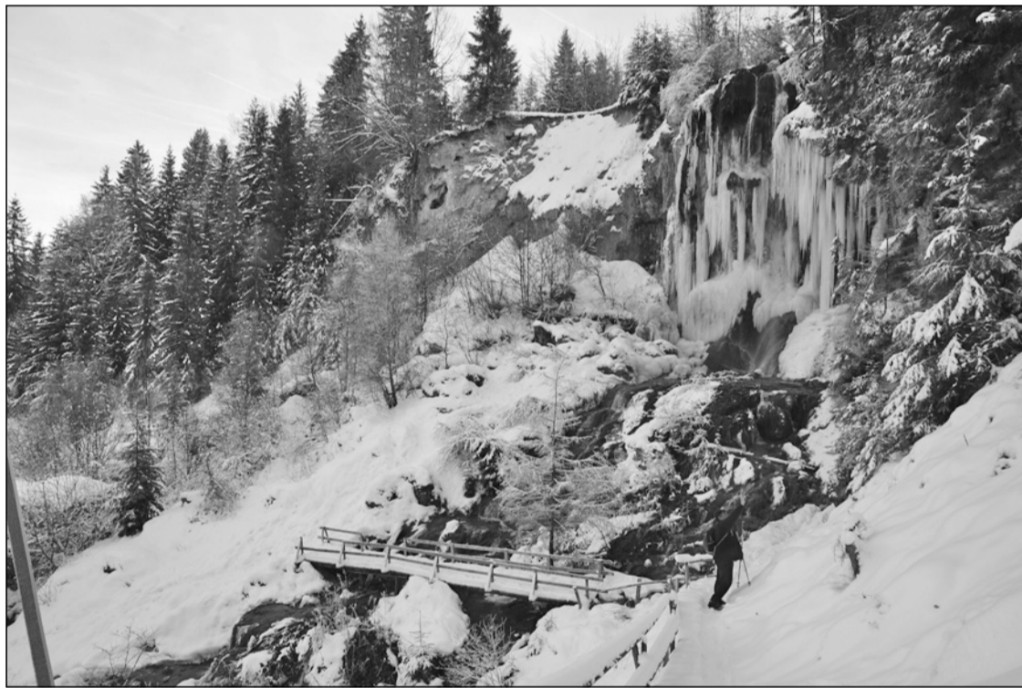
A Pisoaia-vízesés tájrezervátum

A Mócvidéken, vagyis a Bihar-hegység, a Gyalui-havasok és az Erdélyi érchegység térségében, az Aranyos, illetve a Fehér-Körös felső és a Kis-Aranyos folyásának vidékén még számos más látványosság is van, akit bővebben érdekel, az Perei Árpád turisztikai oldalán ( http://users.atw.hu/pereiarpad/cikkek/gaina/turaleirgaina.html ) sok részletes mócvidéki túra- és kirándulásleírást olvashat. Ezen az oldalon a móc szó eredetére is fény derül: románul hajtincset jelent, a mócok a hajukat hagyományosan varkocsba fonva viselték. Nocsak, ebből a szempontból majdnem olyanok voltak, mint a honfoglaló magyarok. De hagyjuk ezt! A természet úgyis hétnyelven – pontosabban a teljesség nyelvén – beszél.