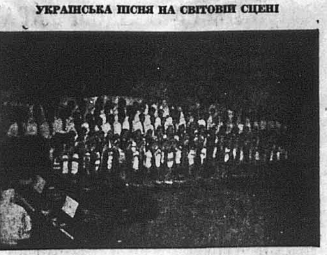
Фрагмент з виступу хору на величавому музично-танцювальному фестивалю, що відбувся в неділю, 16-го травня, в Карнегі Голл в Нью Йорку, з нагоди 60-річчя Українського Народного Союзу.

„Утвердження індивідуальності“ і „світ мистця“ Загально відомо, що в творчому, побутовому житті мистецтва, зокрема письменника, позначаються досить часті неуважності і навіть неорганізованість, що подекуди межує з дивацтвом. Причина цього та, що мистецьке побутовий життя живе так би мовити, „остілки-осілки“, тобто оскільки він — фізична істота, що не може цілувати „вискочити“ з матеріально-фізичної людської оболонки. Натомість „всією душею“ творець мистецтва живе в світі своїх мистецьких образів. Це — світ творчоготримованний, світ реальності, перепущений кризь призму мистецького духового Я його власної неповторної індивідуальності. Мистецький факт (у даному разі твір письменника) — це творчий відрив — проєкція письменника на якийсь означене, близьке йому середовище, хоча б зовні, з погляду формально-сюжетного, дія відбувається в рамках доби, віддаленої від автора часом тисячами років, а присутні — морями — океанами, в якихось екзотичних за-