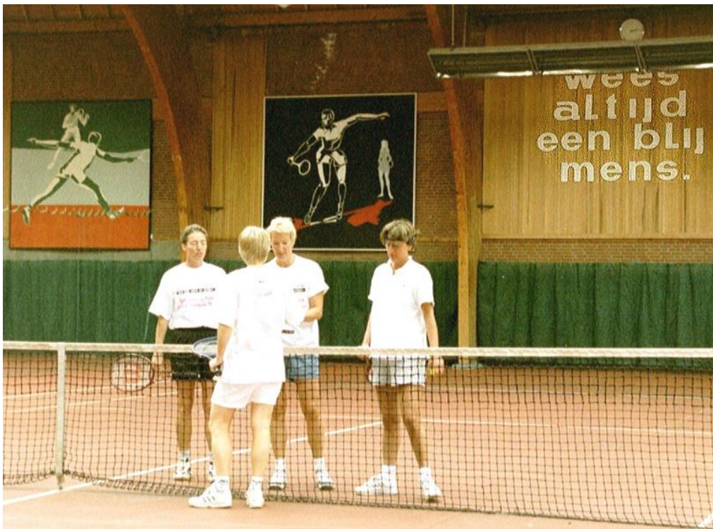
Blij met ons tennispark NTC, dat ook enkele binnenbanen heeft