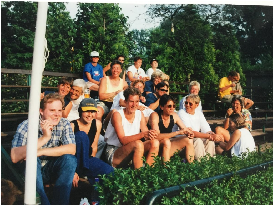
Gay Games 1998, Gold Star