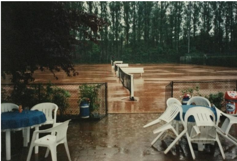
1998 PINKstertoernooi NTC bij de start op donderdagavond

Was het PINKstertoernooi 1997 een voorbereiding op de Gay Games - met een knock-outsysteem en voor de kleine schema's een poule-systeem – de editie van 1998 is dé generale repetitie. Er komt een mooi PINKstertoernooiboekje waarin alle wedstrijdschema's zijn opgenomen.