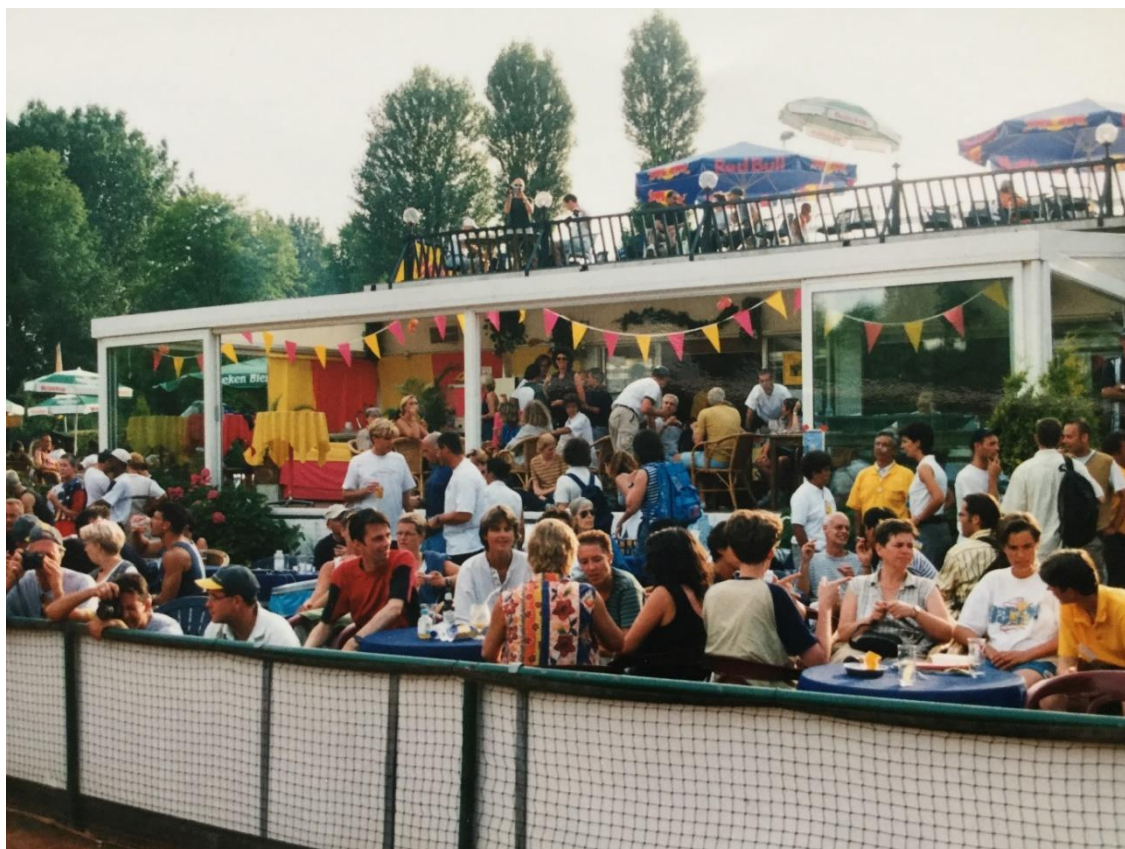
Gay Games 1998, terras Gold Star