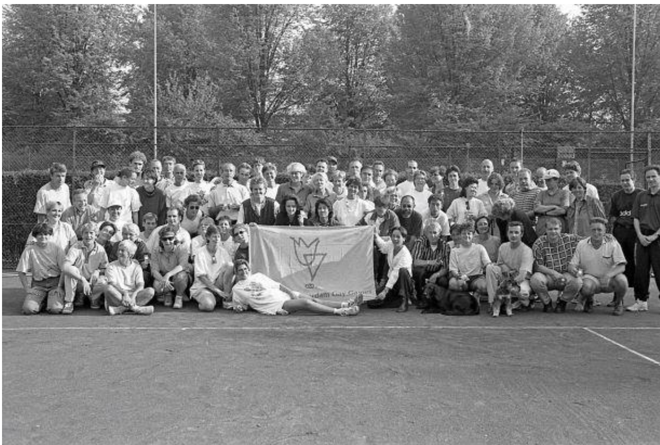
1997 Deelnemers 5° PINKstertoernooi 1997