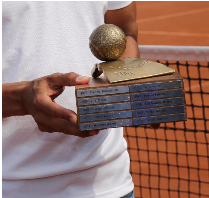
De nieuwe Wisseltrofee

Ook in het nieuwe ontwerp staat de driehoek van verleden, heden en toekomst symbool voor homoseksualiteit. De golfvranden symboliseren de beweging van het spel. De tennisbal rust los op de voet, zodat deze in de hand genomen kan worden in concentratie voor een wedstrijd. Op de voet staat de verenigingsnaam van Smashing Pink, aangezien de club onlosmakelijk met het toernooi verbonden is. Anno 2021 vind je de volgende tekst over de wisseltrofee op www.pinkstertournament.com : De PINKsterTrofee is een wisseltrofee die tijdens de prijsuitreiking van het PINKstertoernooi uitgereikt wordt aan één van de winnaars die de homo-emancipatie in de sport symboliseert. (...) Ed: 'Met de trofee benadrukken we het specifieke karakter van het toernooi en de gelijkheid die wij nastreven. Iedereen, ongeacht geslacht, categorie of speelsterkte, kan de trofee winnen.'