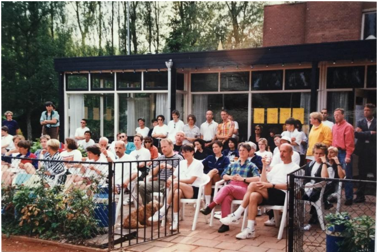
1997 PINKstertoernooi - terras van NTC