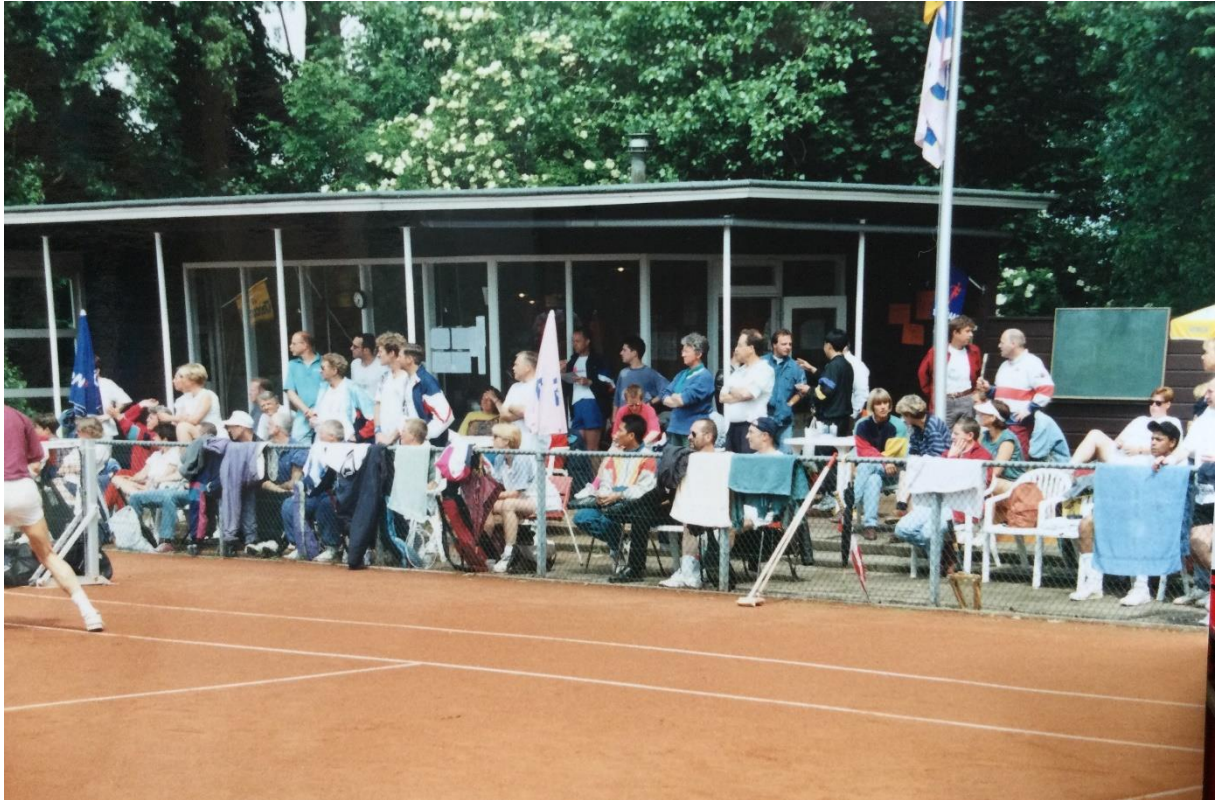
1995 3 e Roze Tennistoernooi terras Valentijnkade