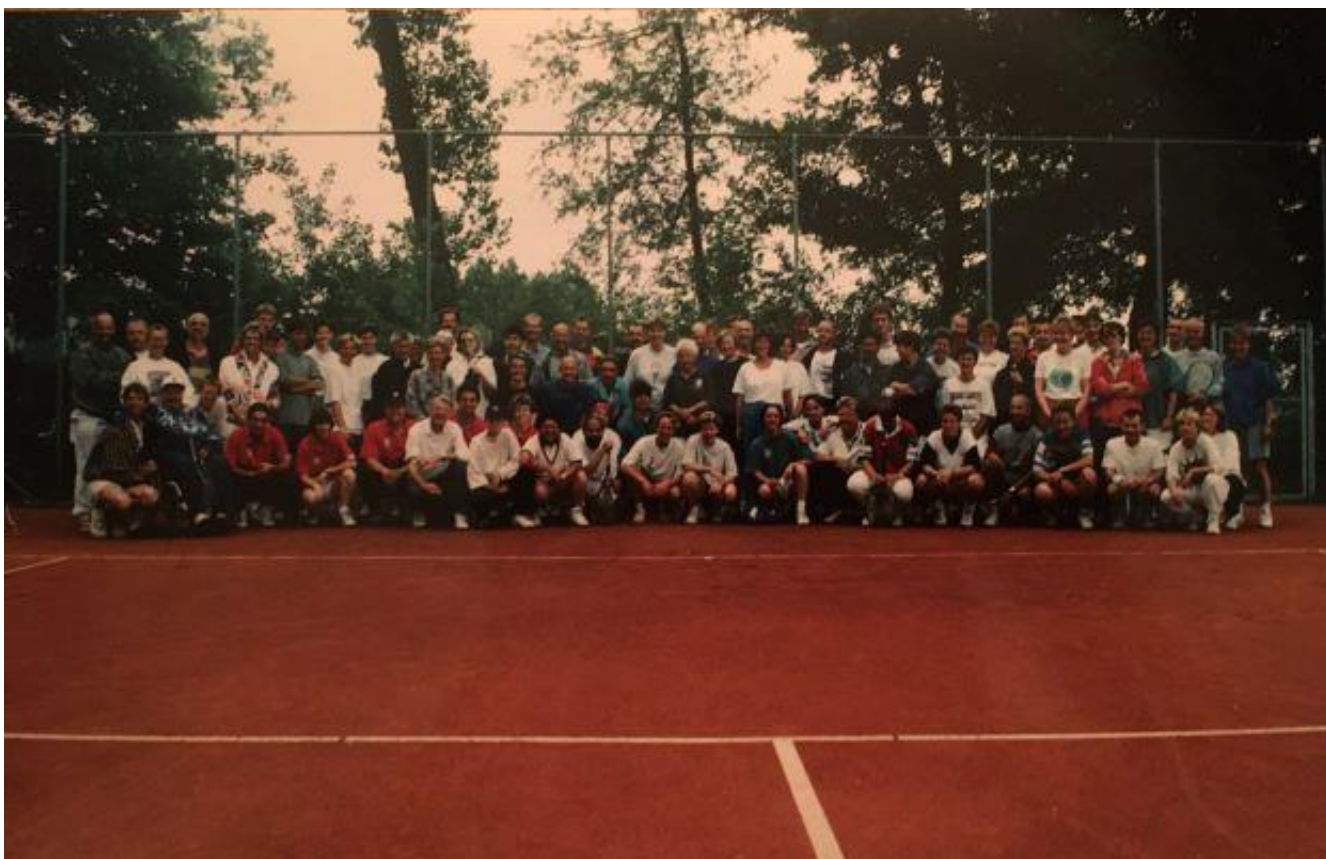
3 e Roze Tennistoernooi Valentijnkade, maandag 5 juni 1995: deelnemers en PTI-coaches (rood T-shirt)

Het blijkt dat Stadsdeel Zeeburg bereid is de vijf tennisbanen op zaterdagmiddag ter beschikking te stellen van de roze tennissers. En zo wordt er in de zomer van 1995 door zo'n 75 mensen vier maanden lang vrolijk getennist voor 30 gulden per persoon.