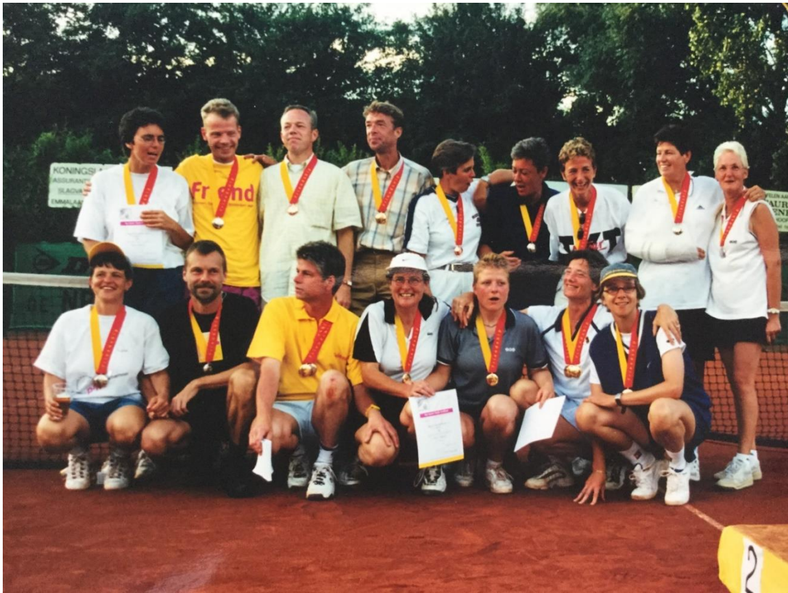
Gay Games 1998: Smashing Pinkers winnen 5 gouden, 7 zilveren en 11 bronzen medailles!