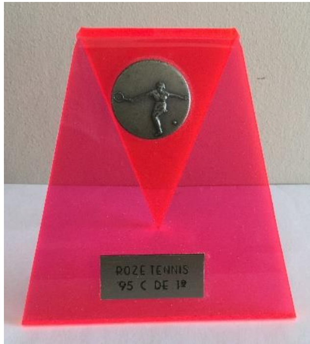
Prijs Roze Tennistoernooi 1995