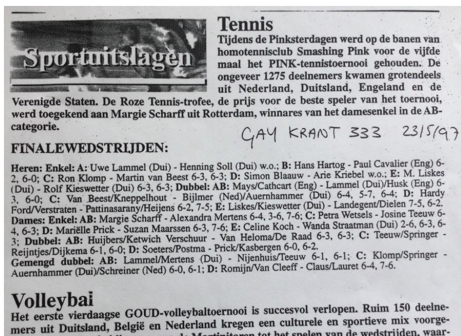
GayKrant 1997 (het aantal deelnemers dat vermeld wordt klopt overigens in het geheel niet....)