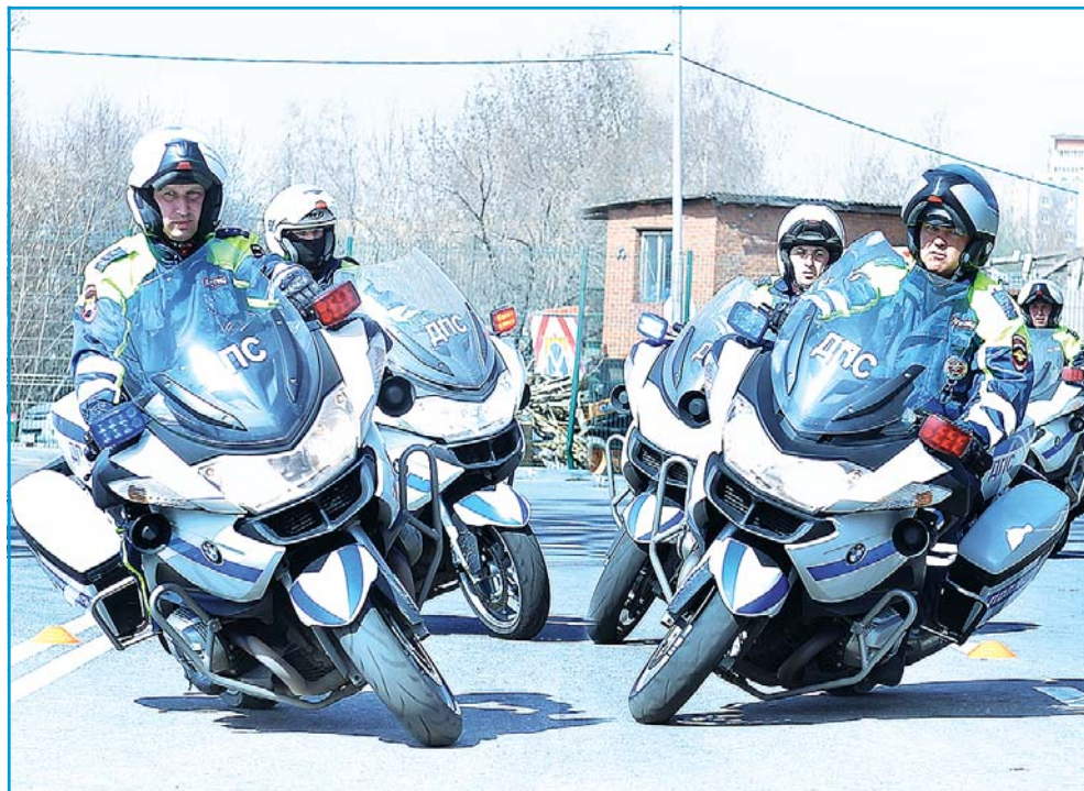
Вальс на плоскости