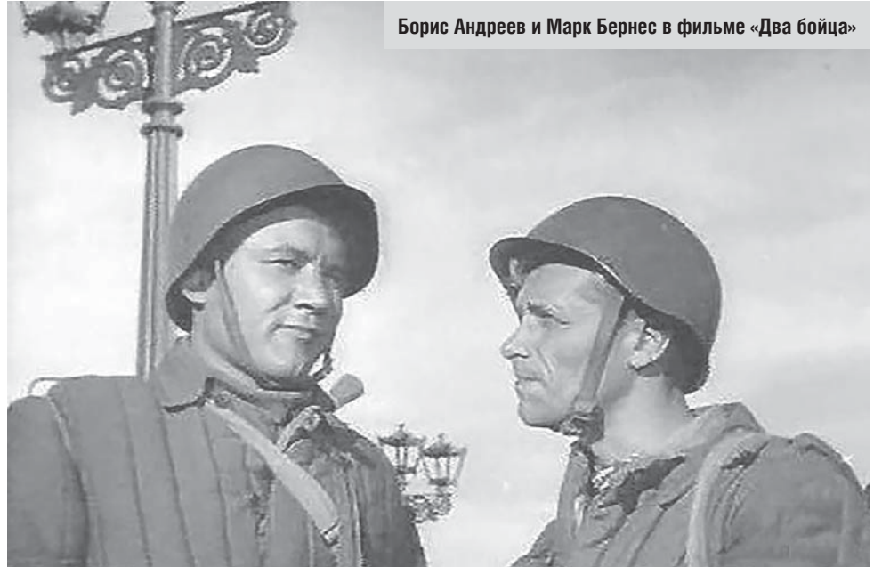
Борис Андреев и Марк Бернес в фильме «Два бойца»

Через пять лет его работы в МУРе в передовой статье милицмейской газете «На боевом посту» отмечалось: «Можно смело сказать: если бы все бо-