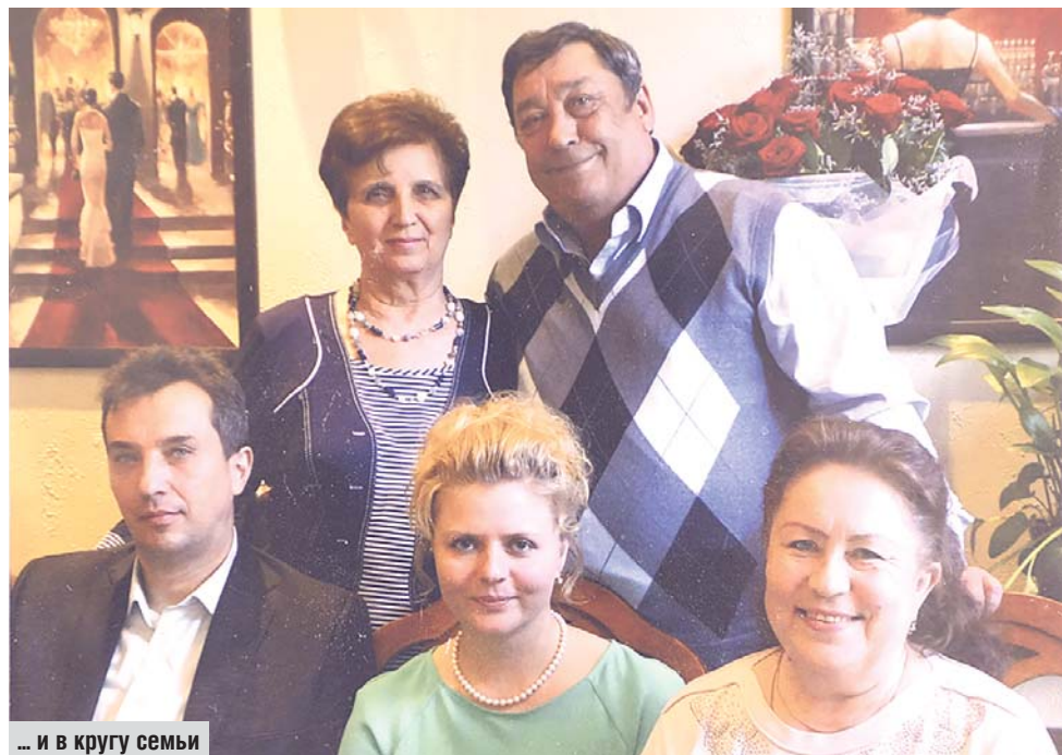
... и в кругу семьи