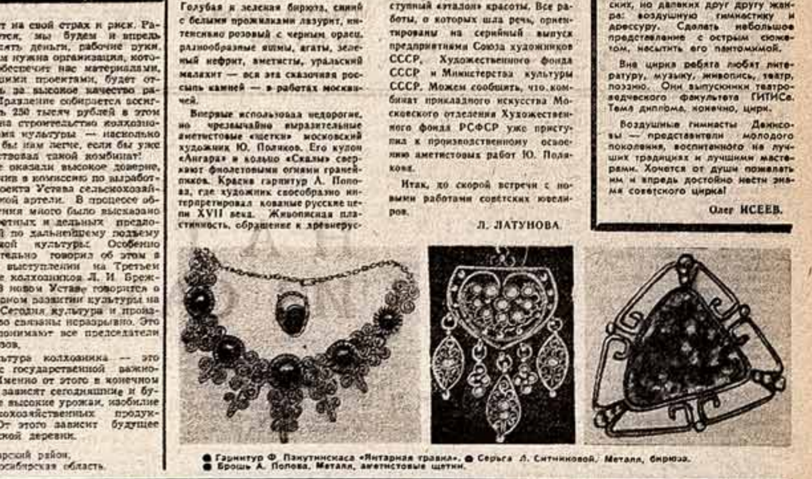
Гарнитура Ф. Пакутинисса «Янтарная трагедия». Серьезы А. Ситникова. Металл, бирюза. Брошь А. Попова. Металл, аметистовые шпаты.