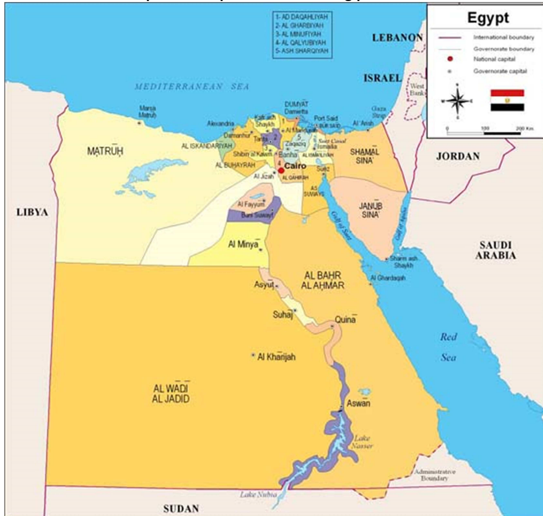
Mapa de la República Árabe de Egipto