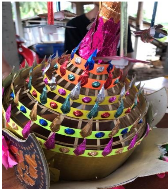
ลอมพอกด้านหลัง