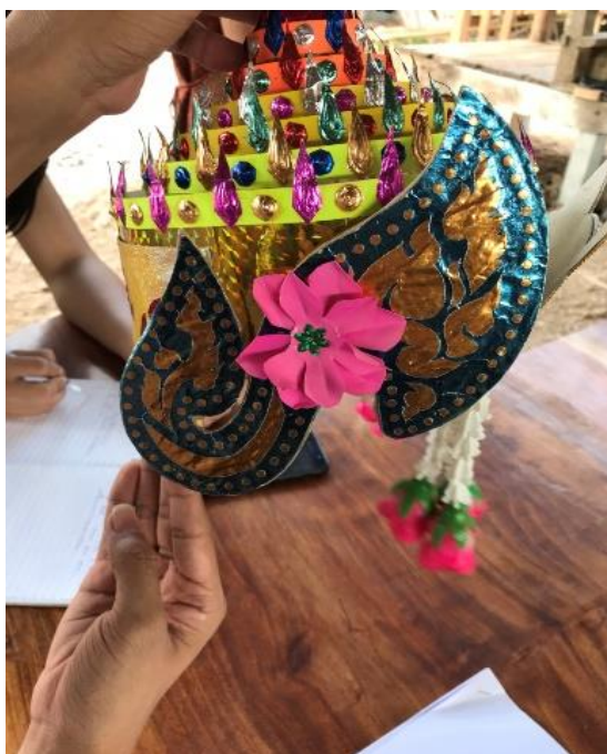
ลอมพอกด้านข้าง

๓. พอสานเป็นโครงเสร็จแล้วจึงนำแบบกระดาษแข็งติดบริเวณรอบด้านหลัง บริเวณจอหนู และติดข้างหน้า จากนั้นตามด้วยติดกระดาษสีต่าง ๆ และตกแต่งด้วยเลื่อมสีต่าง ๆ เพื่อความสวยงาม ถือว่าเสร็จสิ้นกระบวนการประดิษฐ์ตะลอมพอก