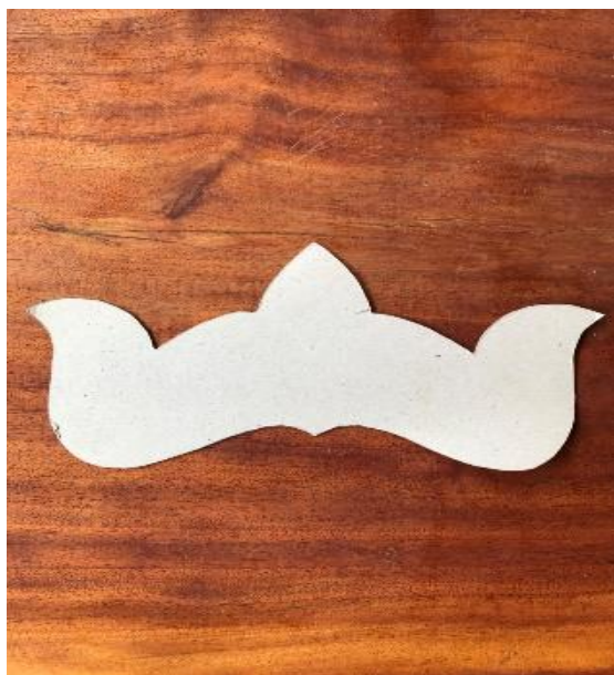
แบบช่องหน้า