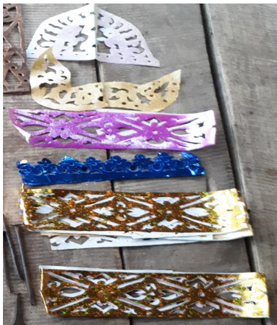
กระดาษสีที่แกะลาย