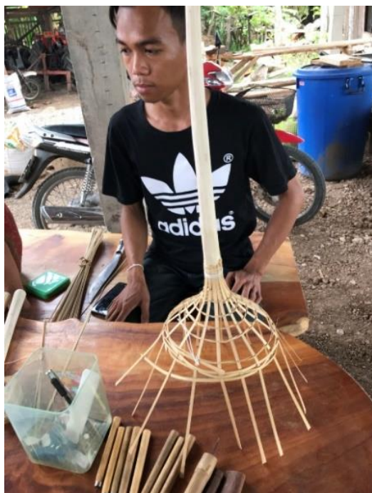
ขั้นตอนการสาน