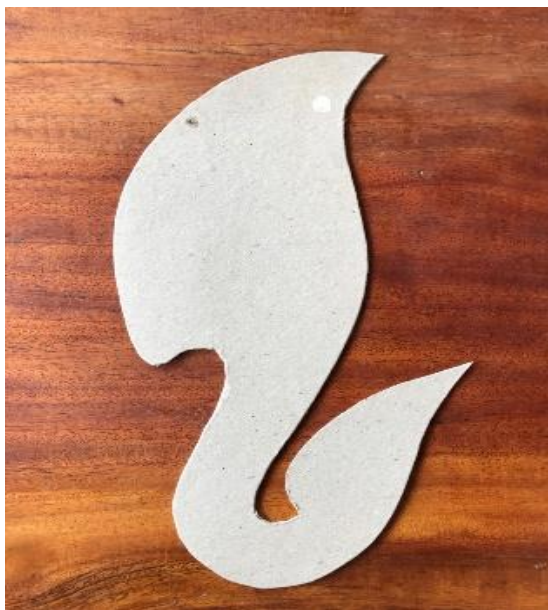
แบบจอนหู