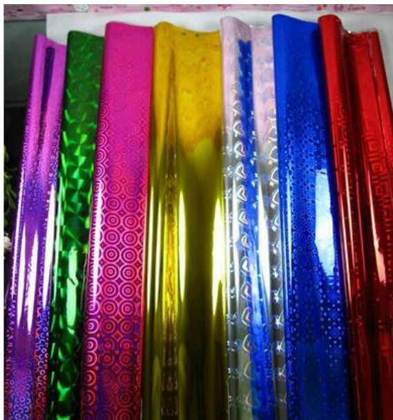
กระดาษสี