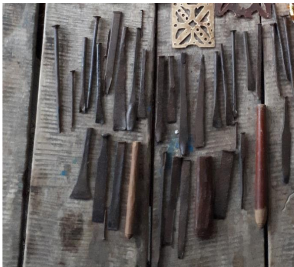
สิวสำหรับแกะหนัง และตะปู