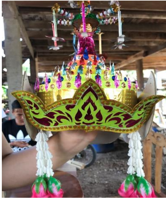
ลอมพอกด้านหน้า