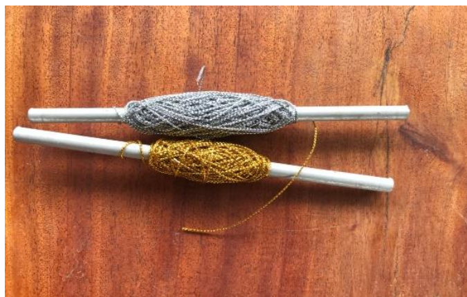
เชือกประดับสำหรับตกแต่ง