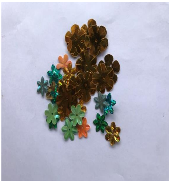
ดอกไม้ประดับ