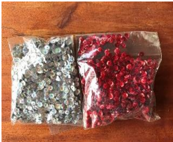
เลื่อมสำหรับตกแต่ง