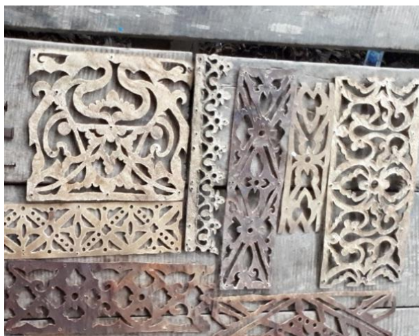
หนังสัตว์แกะลาย