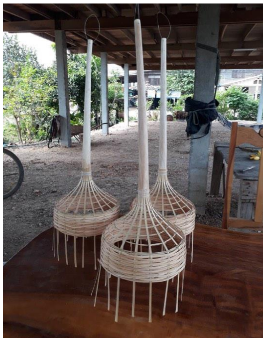
เค้าโครงลอมพอกที่สานเสร็จเรียบร้อยแล้ว

๓. พอสานเป็นโครงเสร็จแล้วจึงนำแบบกระดาษแข็งติดบริเวณรอบด้านหลัง บริเวณจอหนู และติดข้างหน้า จากนั้นตามด้วยติดกระดาษสีต่าง ๆ และตกแต่งด้วยเลื่อมสีต่าง ๆ เพื่อความสวยงาม ถือว่าเสร็จสิ้นกระบวนการประดิษฐ์ตะลอมพอก