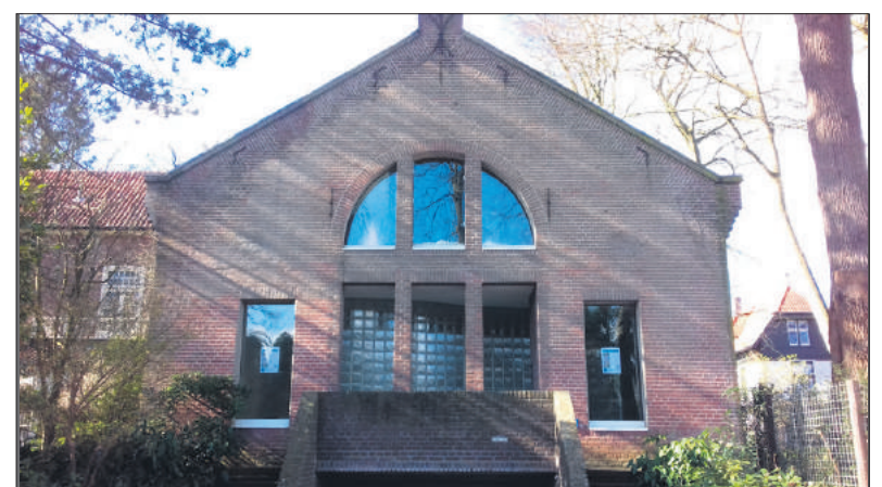
■ Huis Unger.

In 1901 kon hij van zijn erfenis de architect Cornelis Kruisweg opdracht geven om een huis met een aparte atelier- en expositieruimte te ontwerpen. Dit huis werd gebouwd aan de Boslaan 2a in Het Spiegel. Het atelier had grote deuren om zijn forse schilderwerken naar buiten te kunnen krijgen. Zijn schilderijen waren zo groot dat ze alleen al vanwege hun af-