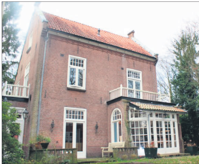
■ Villa Gerardina, Boslaan 2a.