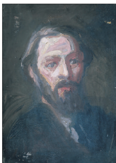
■ Portret van Pier Pander.